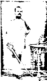
ფრიდრიხ ნიცშე (1844-1900)