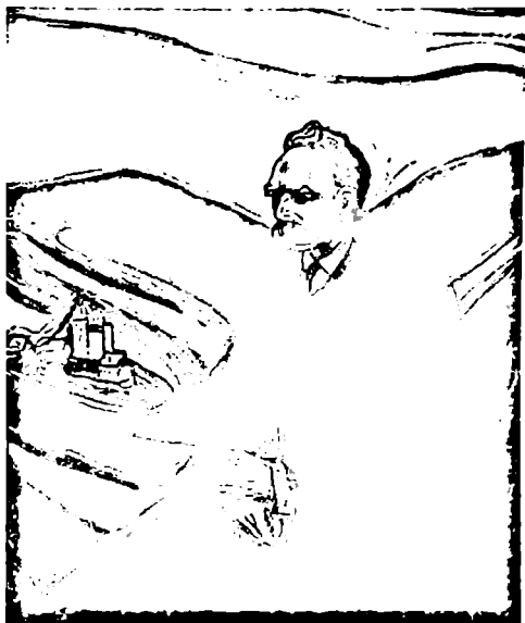
ედუარდ მუნქი, „ნიცშე“ (1906)