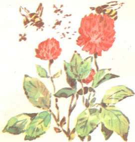
სადაცაა სურნელოვანი თაფლი

ძალზე სასარგებლოა ადამიანისათვის საფუტკრეში ყოფნაც — თაფლის და ფუტკრის სხვა პროდუქტების სურნელებით გაჟღენთილი ჰაერი ჭანმრთელობის განმტკიცების უძებარი საშუალებაა;