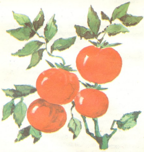
მატყარი პიორკი როინიშვილი

აპონიაში ერთმა ძირმა პამიდორმა, რომლი ტოტებისგან პატარა ხევიანია გაკეთებული, უკვე 13 ათასი ნაყოფი მოიხსა.