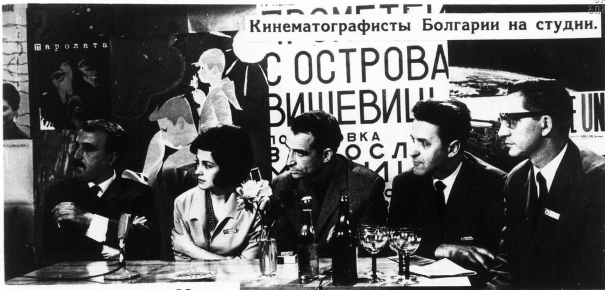
Ежедневно Центральное телевидение знакомит миллионы зрителей с кинематографистами IV Международного кинофестиваля.