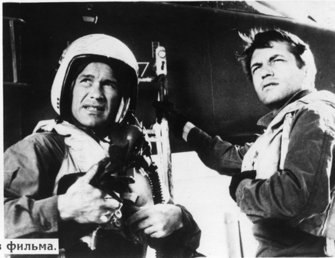
Кадры из фильма.

Со всеми этими вопросами вынужден столкнуться экипаж, и люди решают их сообразно обстановке, политической и гражданской зрелости. Это фильм об ответственности за мир в критическую минуту.