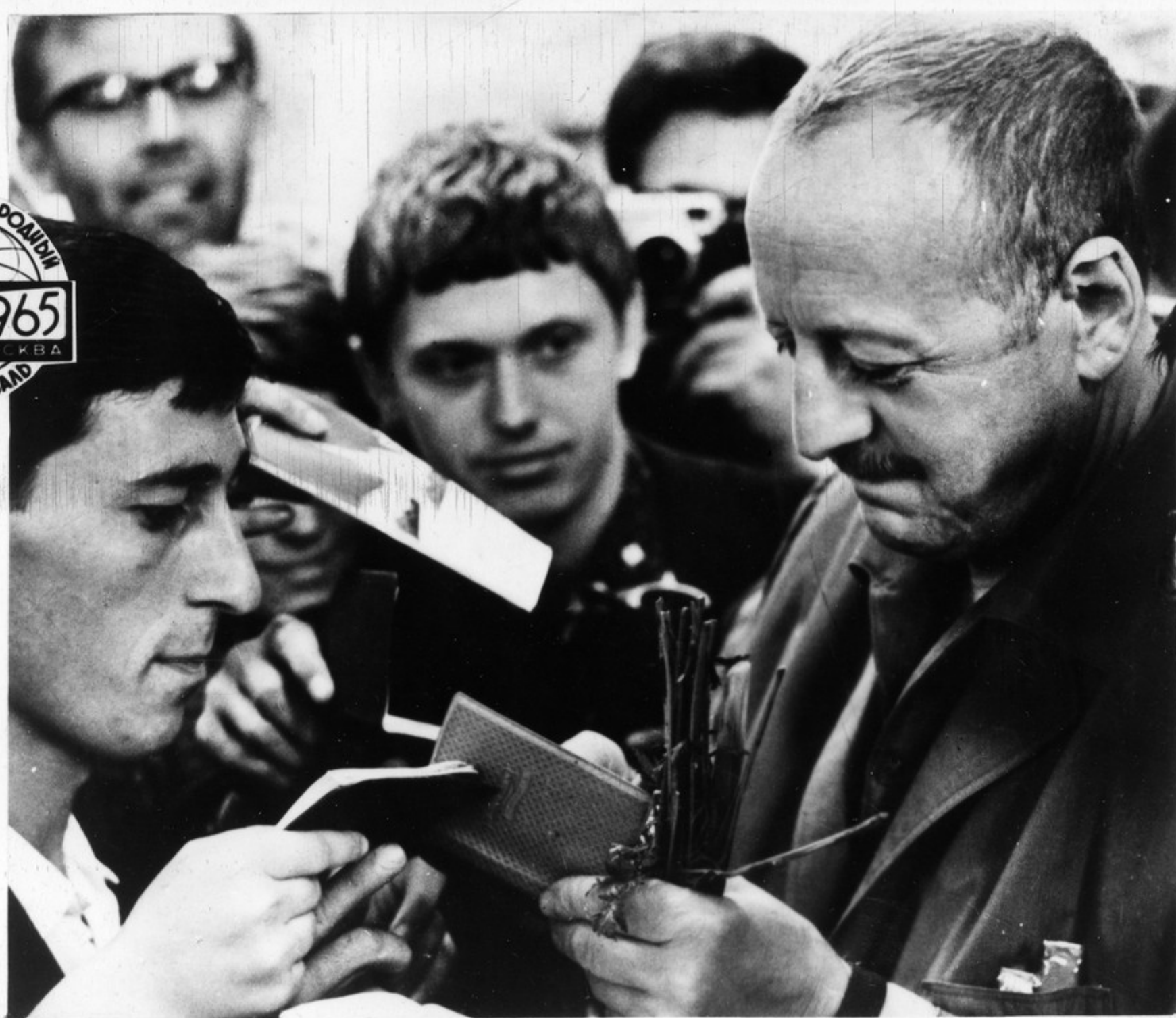
Популярный артист из ГДР Эрвин Гешонек, известный советскому зрителю по телевизионному фильму „Совесть пробуждается“, дает автографы москвичам.