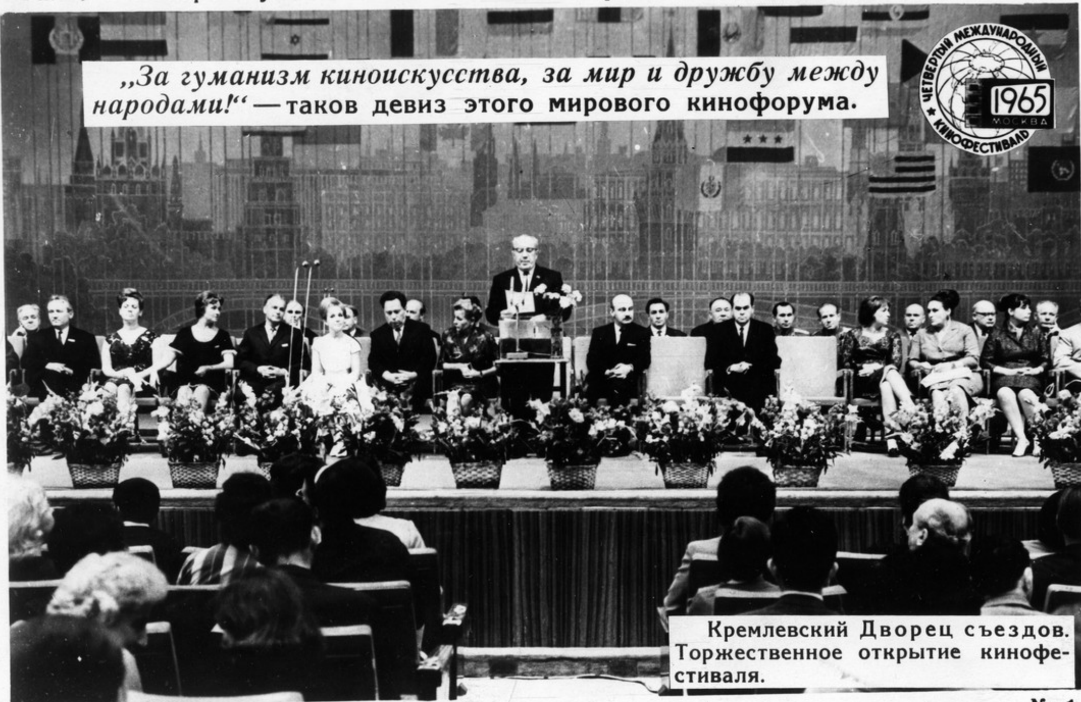
Кремлевский Дворец съездов. Торжественное открытие кинофестиваля.