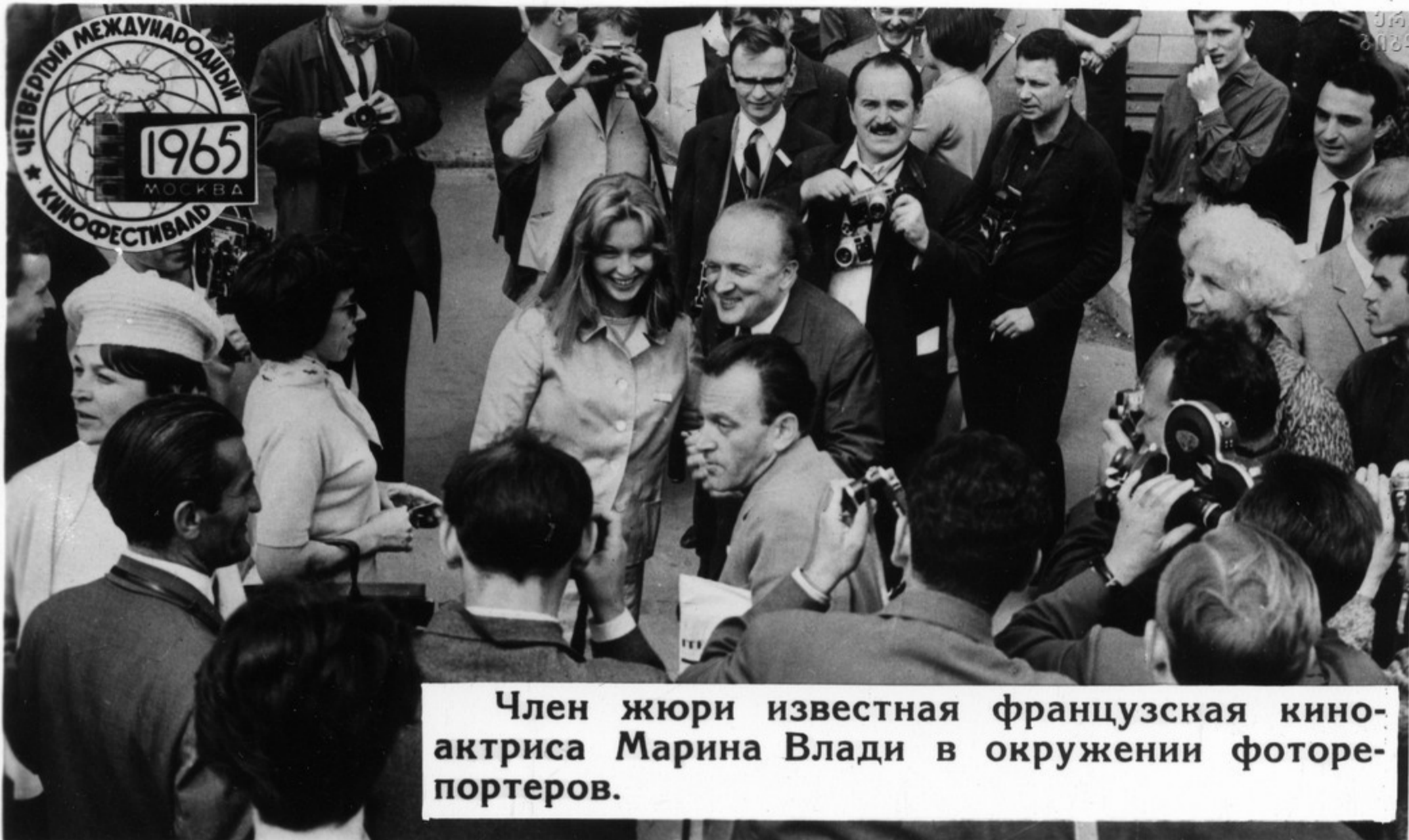
Член жюри известная французская киноактриса Марина Влади в окружении фоторепортеров.

Гости и делегаты фестиваля посетили крупнейшую киностудию страны „Мосфильм“. Состоялись дружеские встречи и беседы.