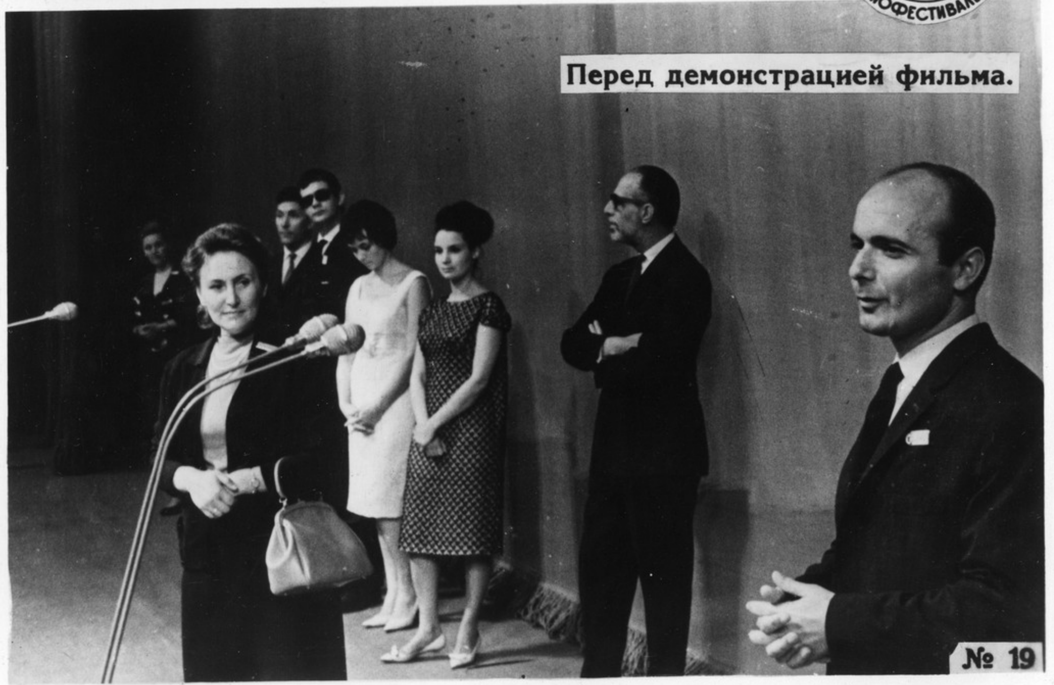
Перед демонстрацией фильма.