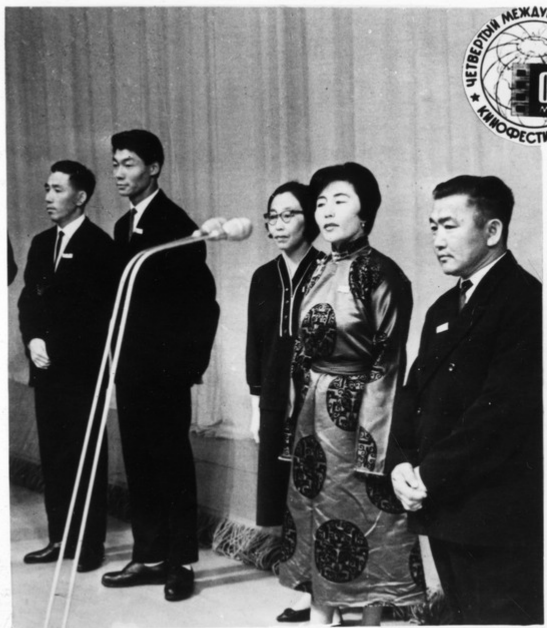
Делегация кинематографистов Монголии перед демонстрацией своего конкурсного фильма „Дружба дружбой“.