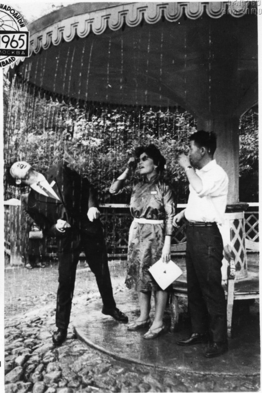
Монгольские работники кино в парке Петродворца.