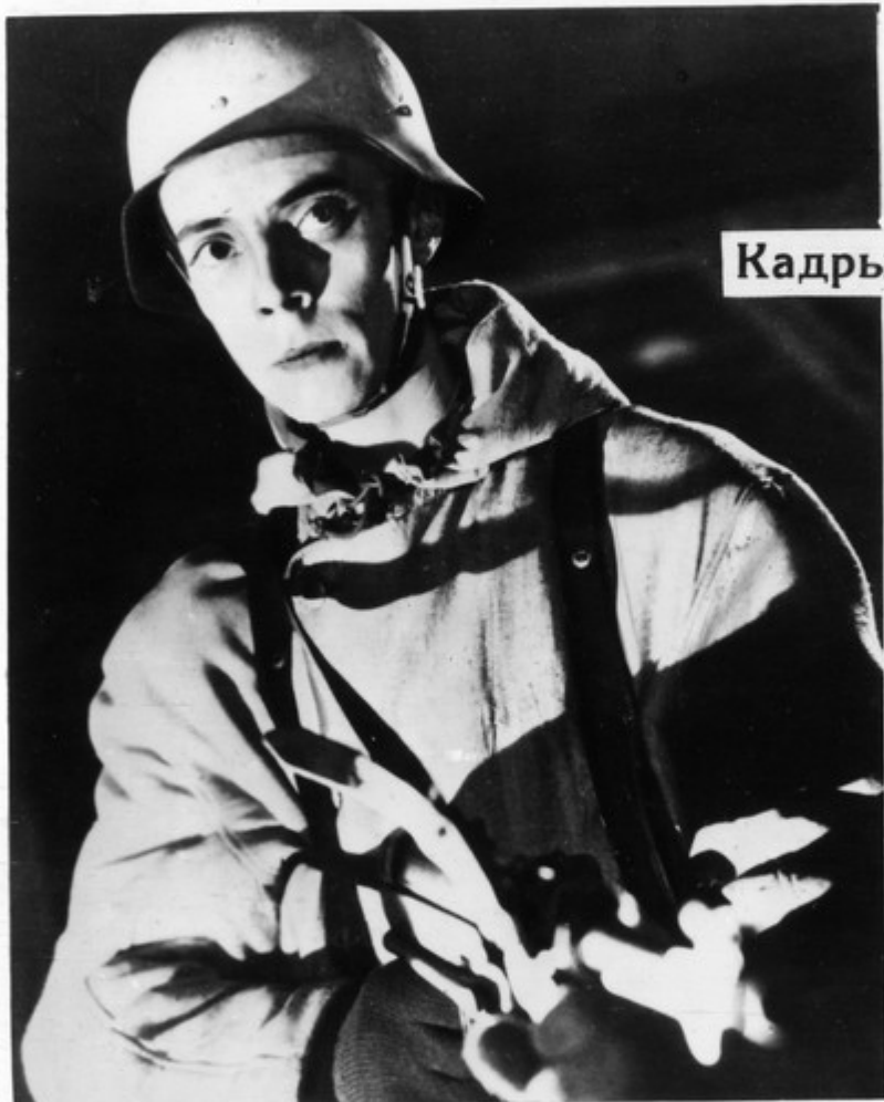
Кадры из фильма.