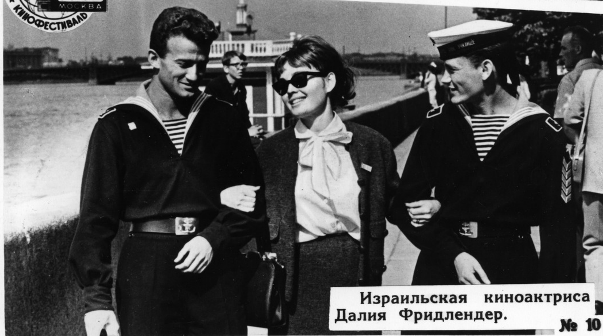
Израильская киноактриса Далия Фридлендер.