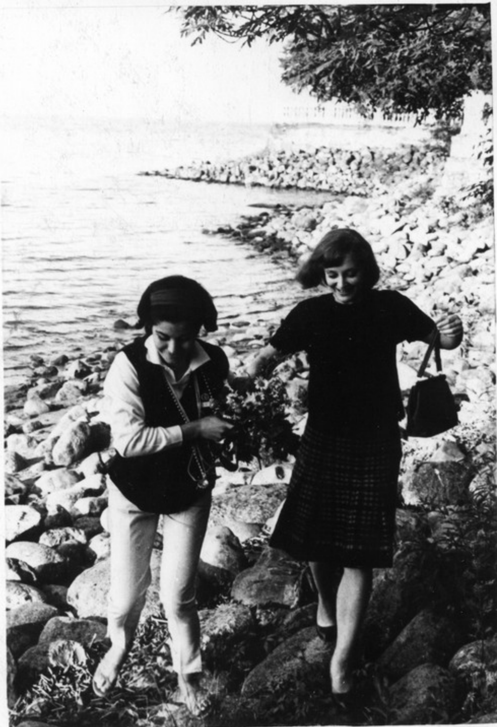
Иранская актриса Банои Пури и советская артистка Ирина Губанова на берегу Рижского залива.