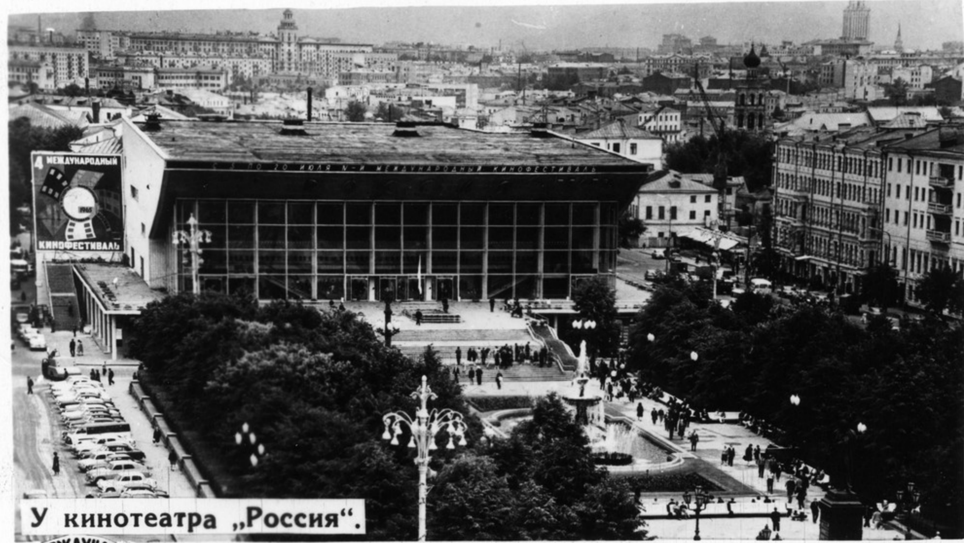
У кинотеатра „Россия“.

Москвичи и гости столицы с большим интересом знакомятся с кинокартинами участников фестиваля.