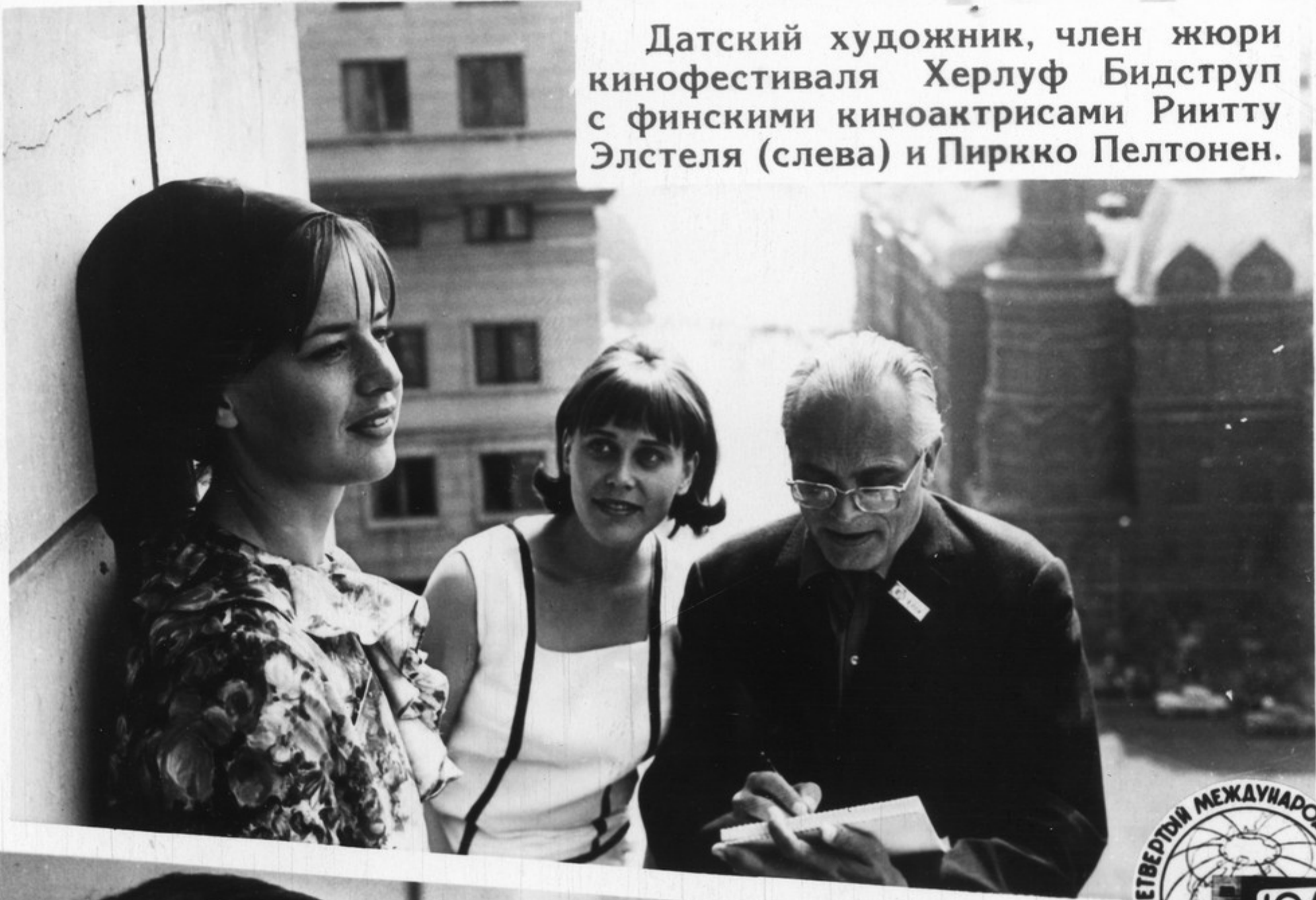
Датский художник, член жюри кинофестиваля Херлуф Бидstrup с финскими киноактрисами Риитту Элстеля (слева) и Пиркко Пелтонен.