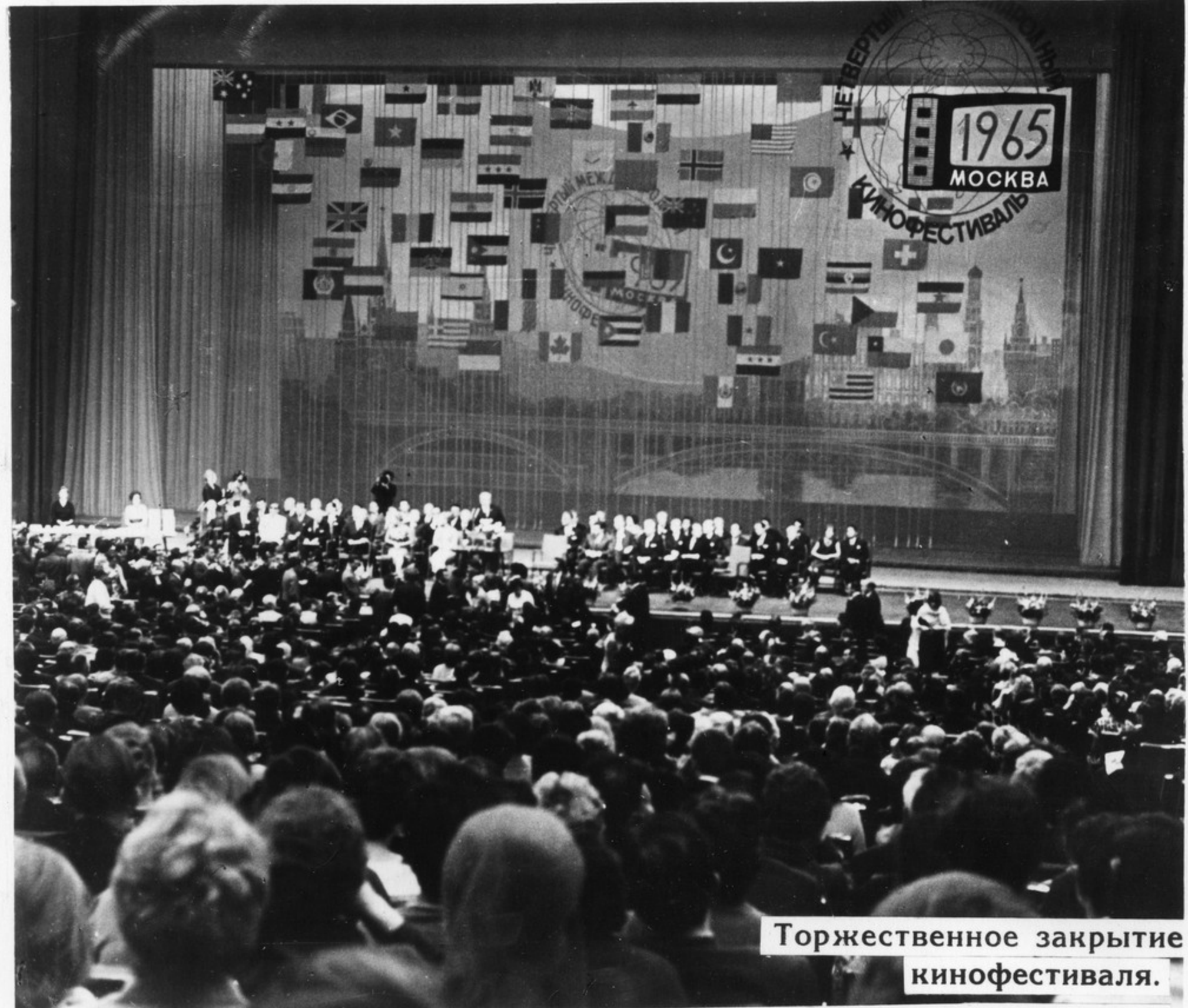
Торжественное закрытие кинофестиваля.

IV Международный кинофестиваль сделал новые шаги по пути укрепления сотрудничества и дружбы между деятелями самого массового из искусств — искусства кино.