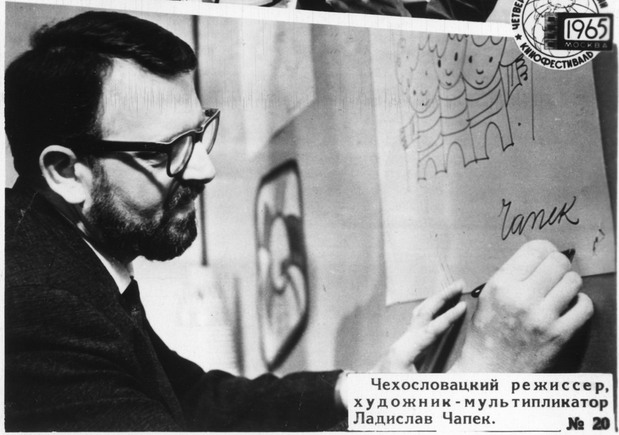
Чехословацкий режиссер, художник - мультипликатор Ладислав Чапек. № 20