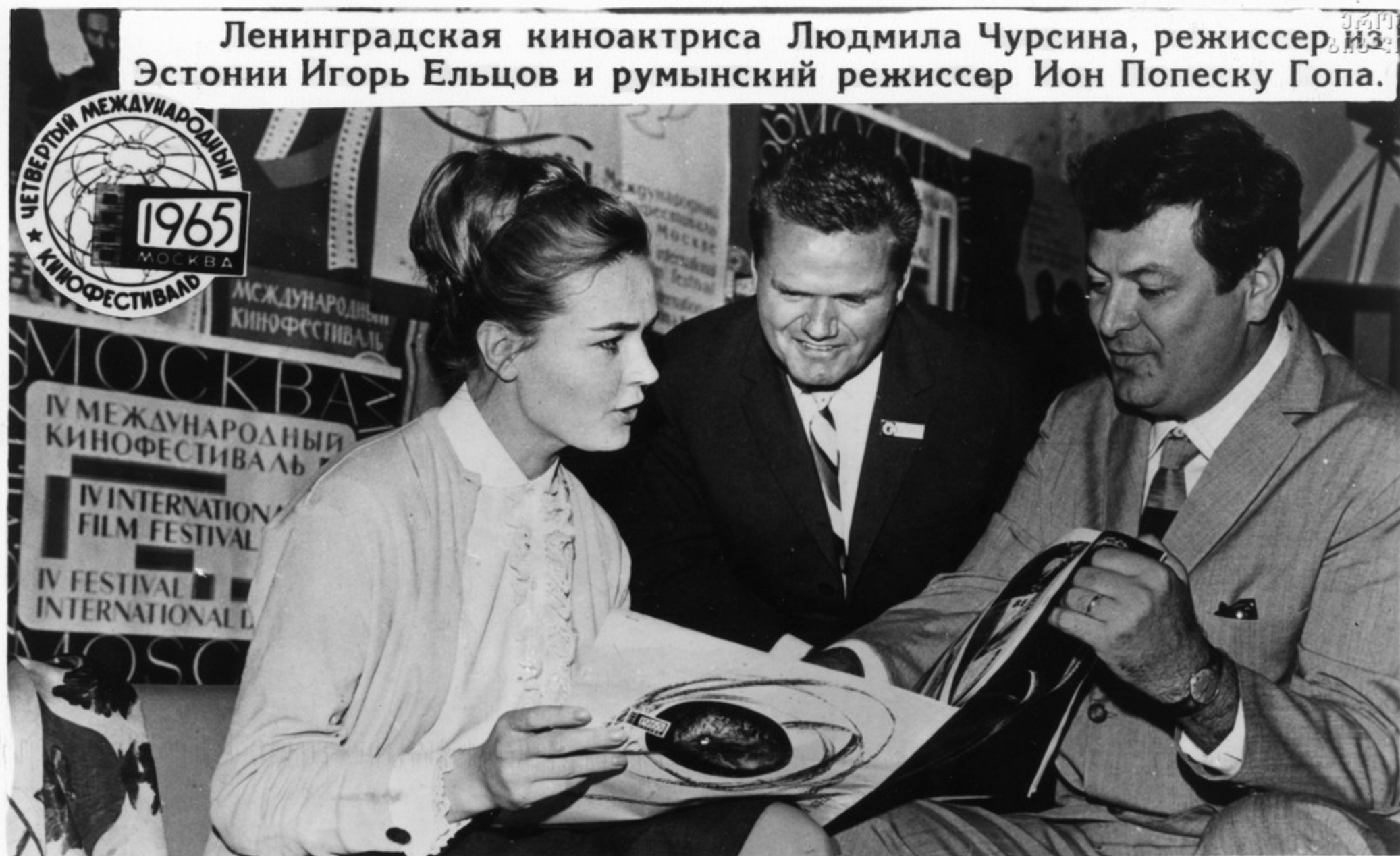
Фестиваль начинается встречами коллег по искусству.