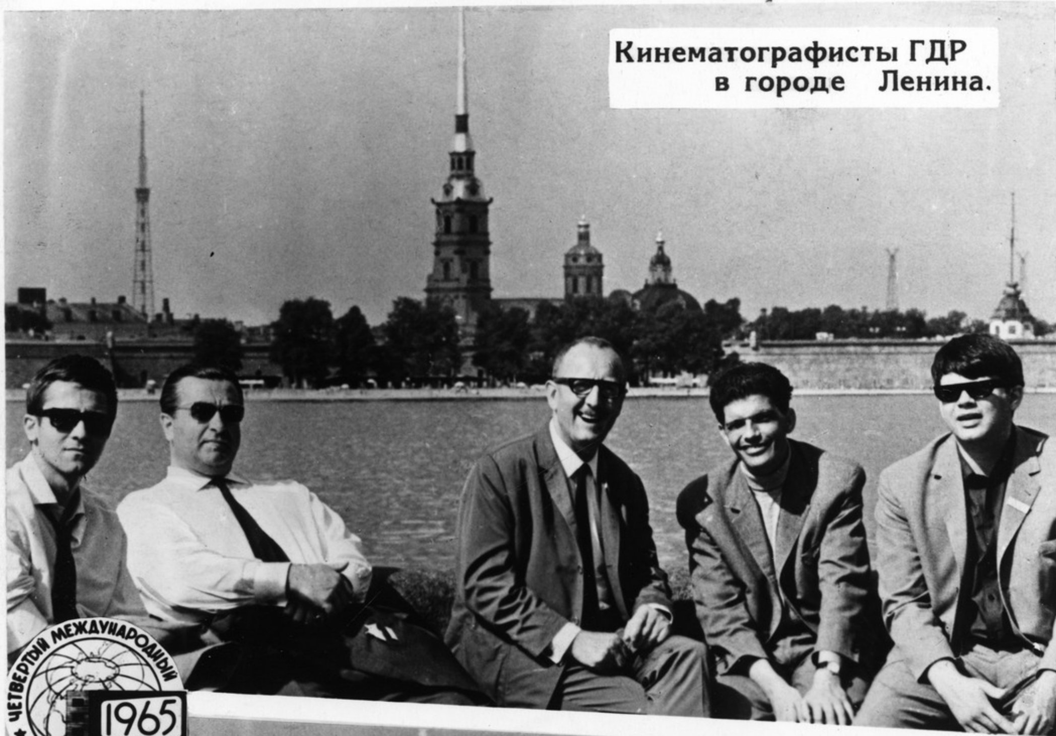
Кинематографисты ГДР в городе Ленина.