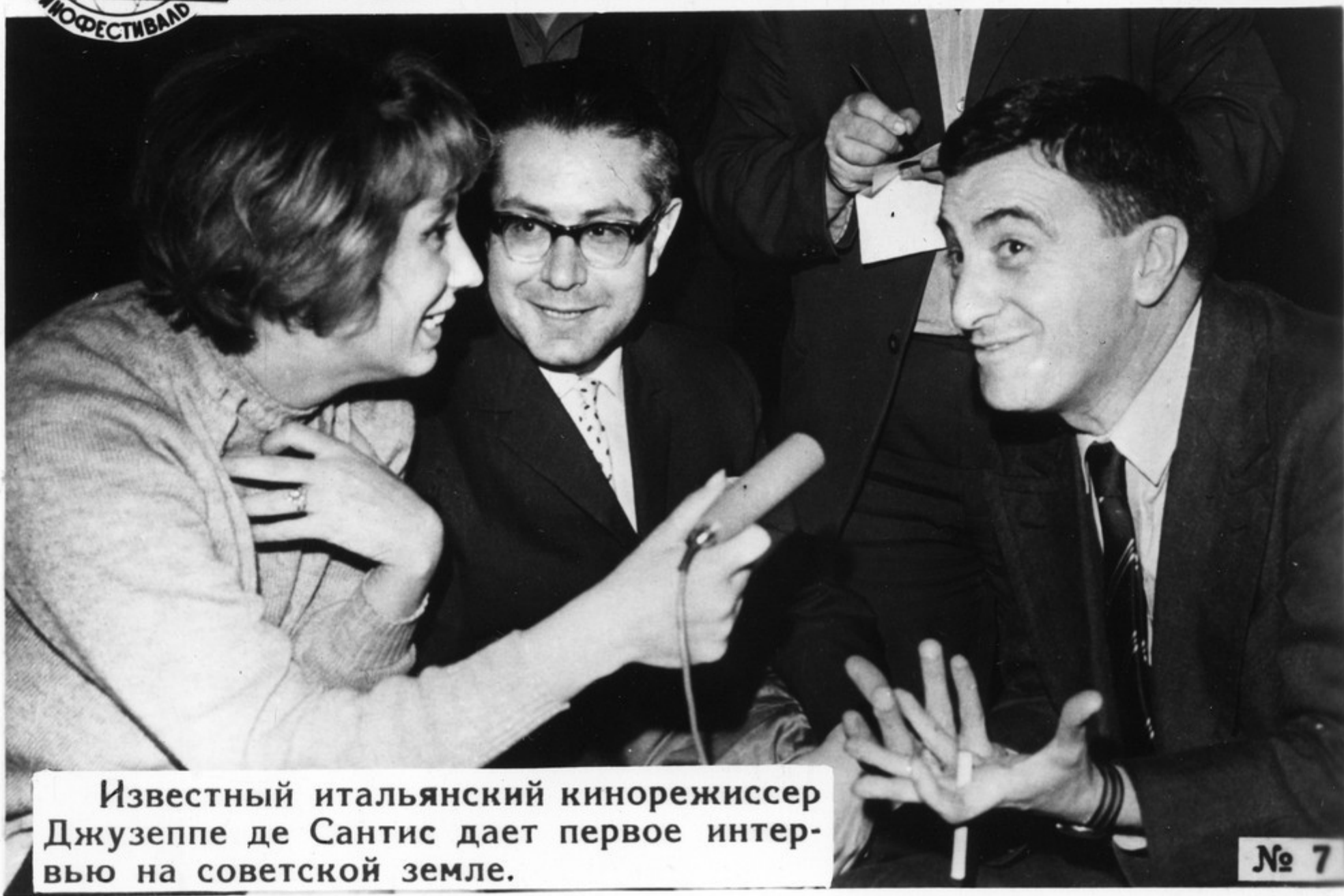
Известный итальянский кинорежиссер Джузеппе де Сантис дает первое интервью на советской земле.