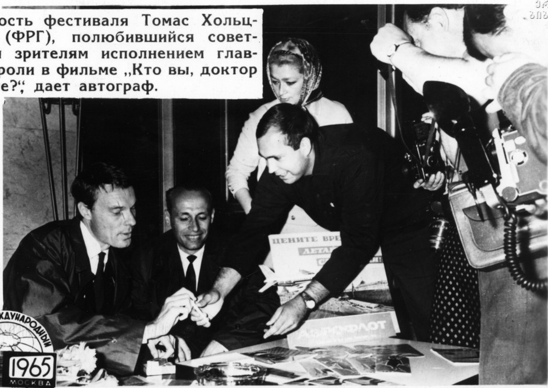
Гость фестиваля Томас Хольцман (ФРГ), полюбившийся советским зрителям исполнением главной роли в фильме „Кто вы, доктор Зорге?“, дает автограф.