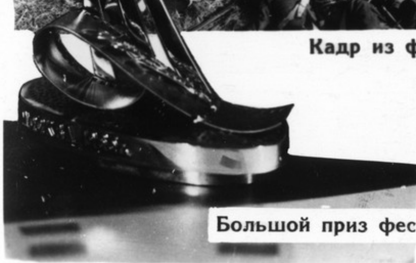
Большой приз фестиваля.