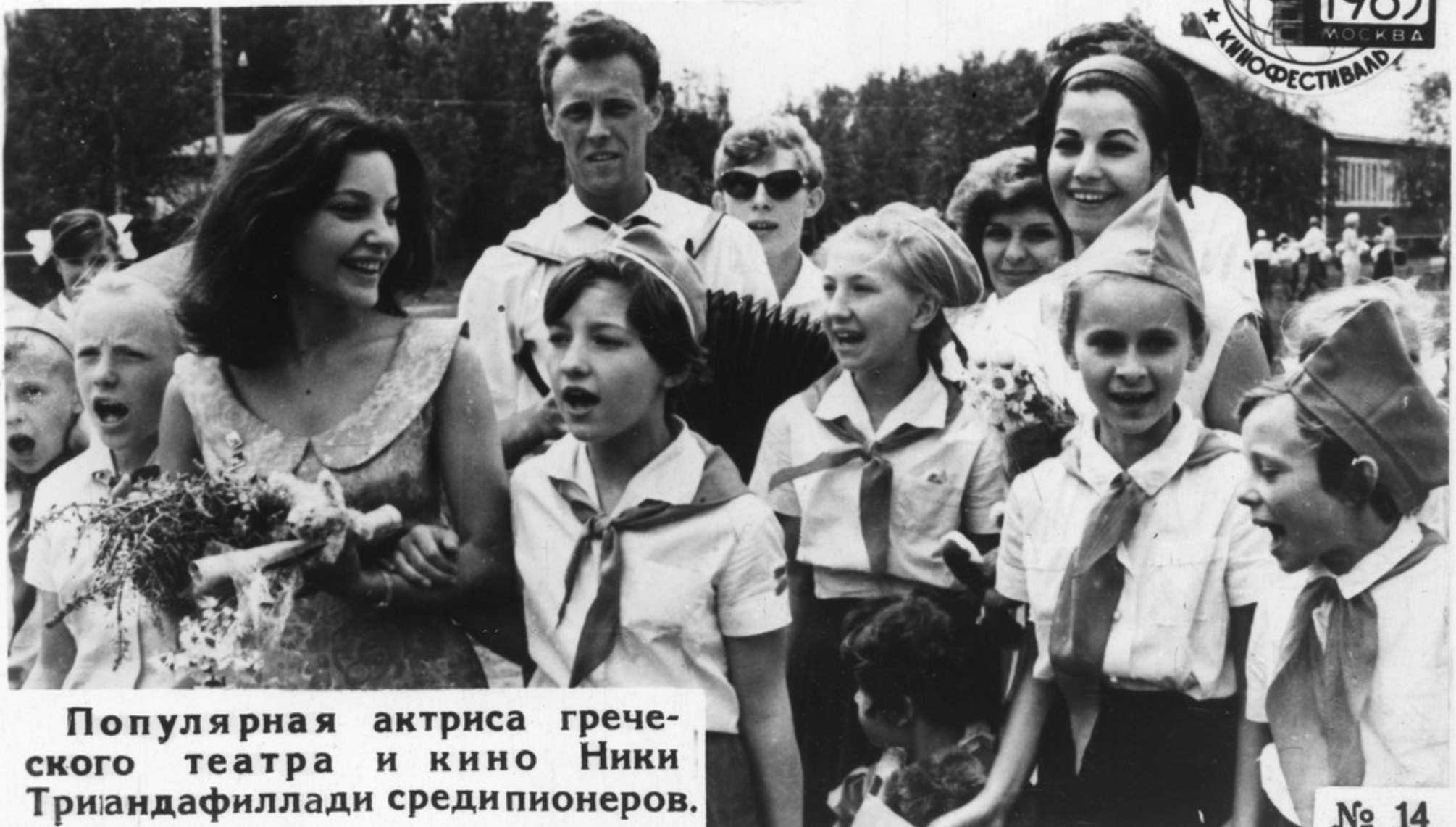
Популярная актриса греческого театра и кино Ники Триандафиллади среди пионеров.