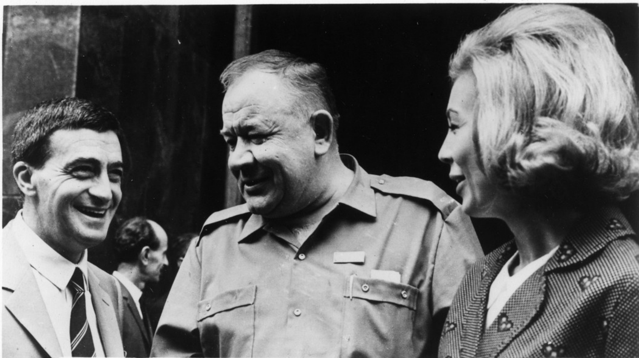
Народный артист СССР Борис Андреев беседует с итальянским кинорежиссером Джузеппе де Сантисом и югославской актрисой Горданой Милетич.