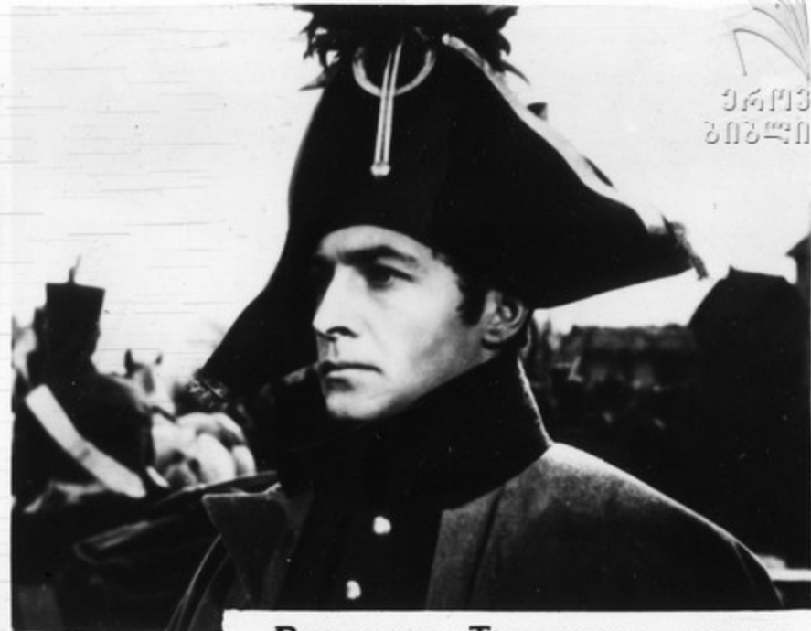
Вячеслав Тихонов — исполнитель роли Андрея Болконского.