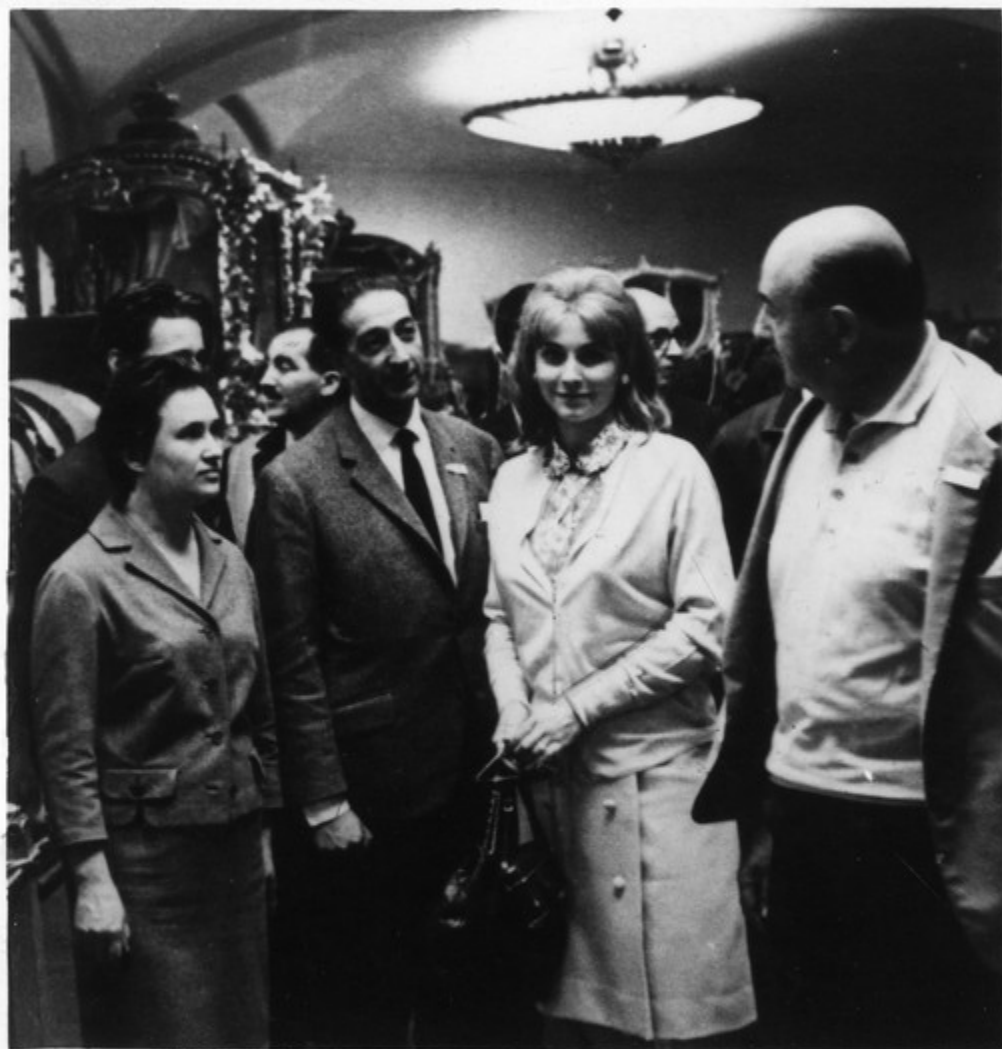
Делегация киноработников Испании на экскурсии в Оружейной палате Кремля.

В государственном Музее изобразительных искусств имени А. С. Пушкина.