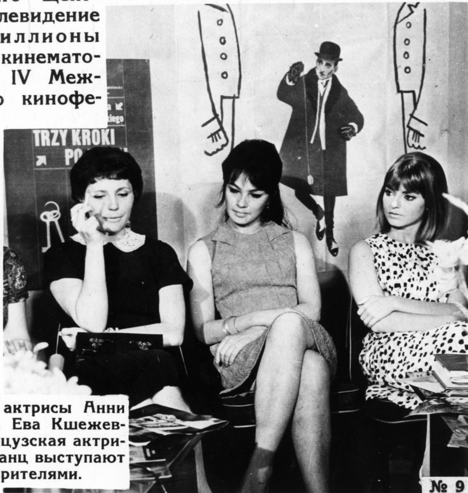
Польские актрисы Анни Чапельская, Ева Кшежевская и французская актриса Мари Франц выступают перед телезрителями.