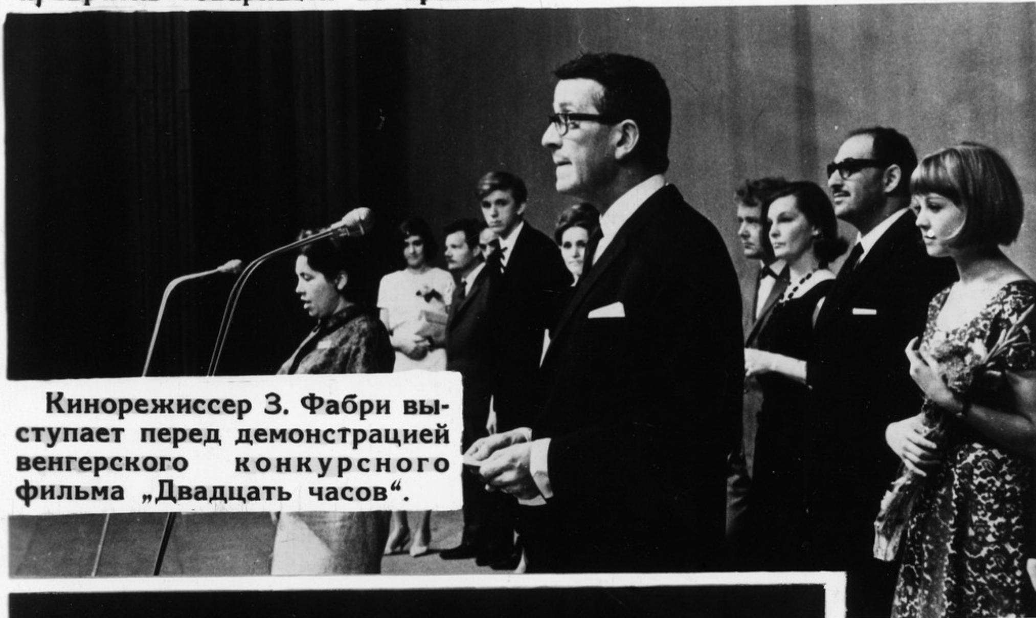
Кинорежиссер З. Фабри выступает перед демонстрацией венгерского конкурсного фильма „Двадцать часов“.

Этот фильм посвящен исследованию сложных социальных проблем современной венгерской деревни. Он рассказывает о драматической судьбе четырех бывших батраков. В прошлом они были друзьями, но жизнь, история разорвала эту дружбу, превратив товарищей во врагов.