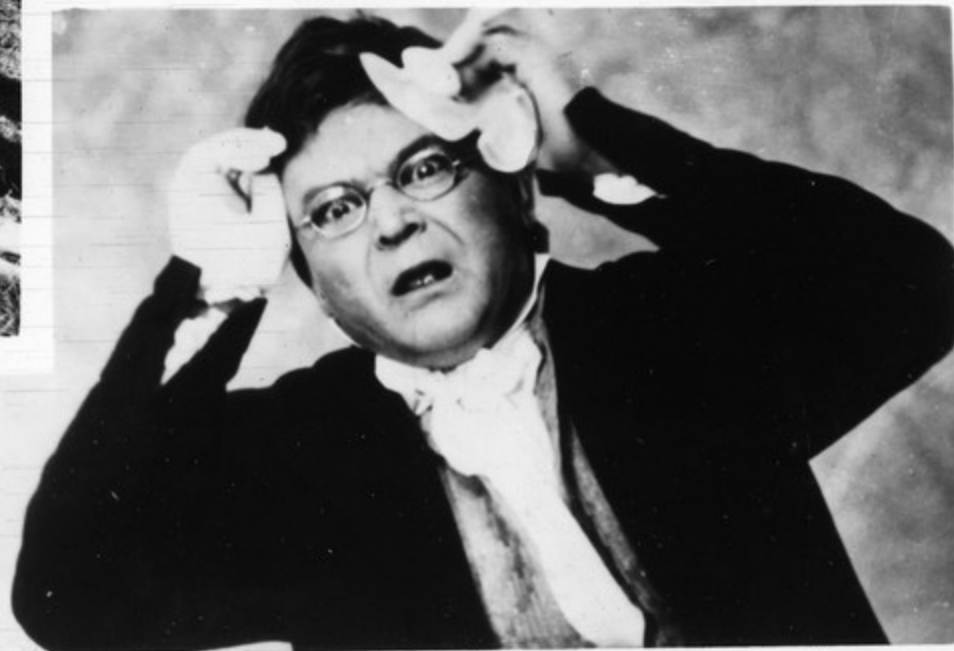
Сергей Бондарчук в роли Пьера Безухова.