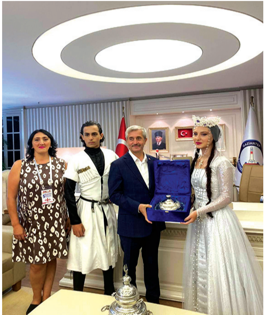
აუდიტორიას (კონცერტებს რამდენიმე სატელევიზიო არხი ლაივრეჟიმში აშუქებდა) ჩვენი ფოლკლორის საოცრება, რომელსაც მსოფლიოში ანალოგი არა ჰყავს!

ბავშვით (დელეგაციის მთელი შემადგენლობა 60 კაცს ითვლიდა) სად მოვთავსდებითო. იმანაც - ხუთვარსკვლავიანი სასტუმრო გვაქვს დიდებულიო. ოღონდ თქვენ დაგვთანხმდით და სამი დღე მთელ ხარჯებს, კვებიანად, მე ვიღებ ჩემს თავზეო. (სულ უხეში გათვლითაც, საუბარი 25-30 ათას დოლარზეა. გ.გ.).