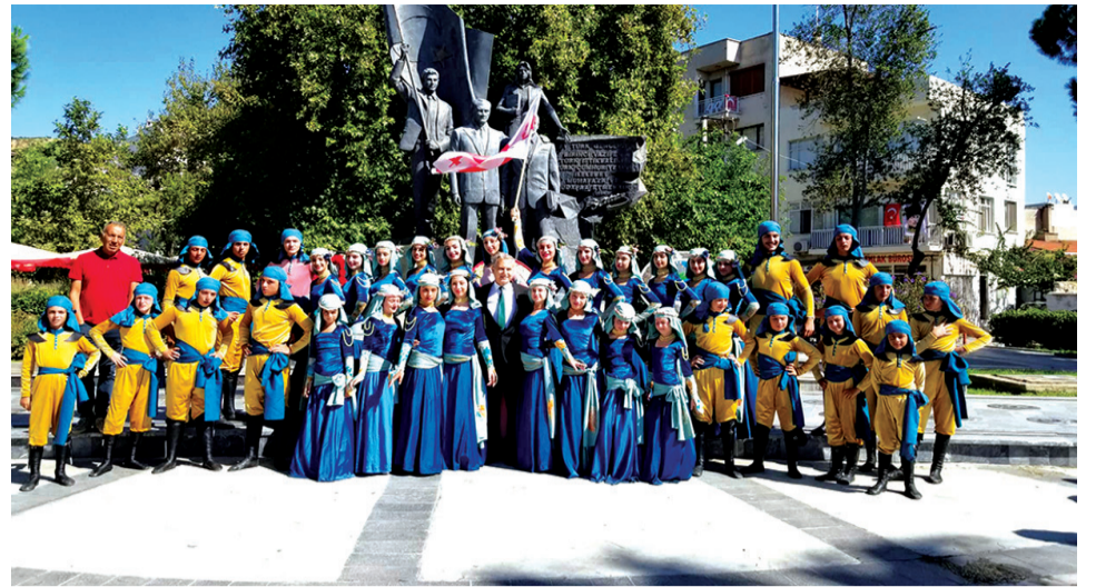
სპეციალურად რჩებოდნენ, რომ „ოქროს ფარის“ სცენური მშვენიერება ეხილათ.

მართლაც ბრავო „ოქროს ფარს“. ბრავო მათ ხელმძღვანელებს და ბრავო ამ შესანიშნავ ბავშვებს, რომლებმაც კიდევ ერთხელ აჩვენეს უზარმაზარ