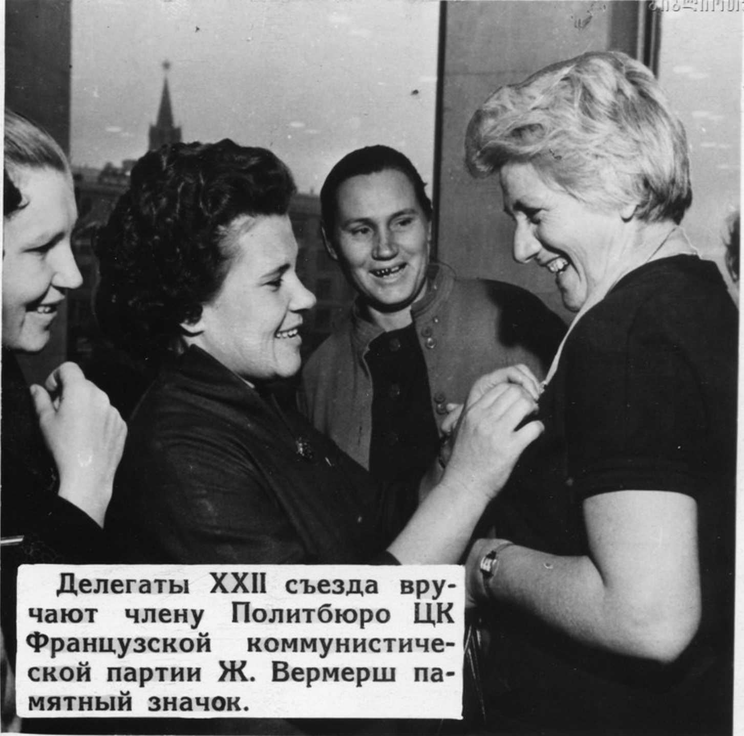
Делегаты XXII съезда вручают члену Политбюро ЦК Французской коммунистической партии Ж. Вермерш памятный значок.

Съезды Коммунистической партии Советского Союза всегда привлекают к себе пристальное внимание во всем мире. Они имеют, по определению В. И. Ленина, в высшей степени важное значение в международном коммунистическом движении.