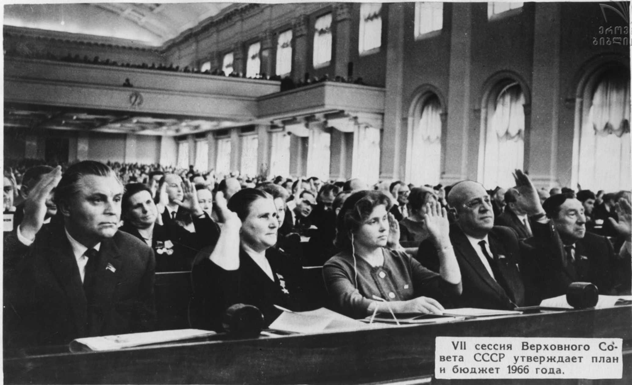
VII сессия Верховного Совета СССР утверждает план и бюджет 1966 года.

Всесторонне обсуждались в Президиуме ЦК КПСС и Совете Министров СССР план и бюджет нашей страны на 1966 год.