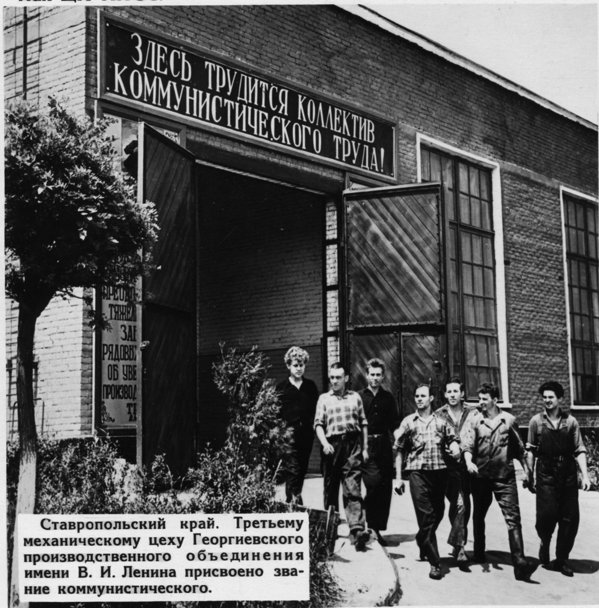
Ставропольский край. Третьему механическому цеху Георгиевского производственного объединения имени В. И. Ленина присвоено звание коммунистического.

Годы, прошедшие с XXII съезда КПСС, были годами, когда партия и весь народ, преодолевая встречавшиеся на их пути немалые трудности, подвергая критике недостатки, настойчиво претворяли в жизнь генеральную линию, выраженную в решениях XX и XXII съездов, в Программе КПСС и получившую дальнейшее развитие на октябрьском, ноябрьском (1964 г.), мартовском и сентябрьском Пленумах ЦК КПСС.