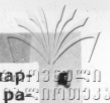
Заседание Совета по партийно-организационной работе Куйбышевского РК КПСС Москвы.