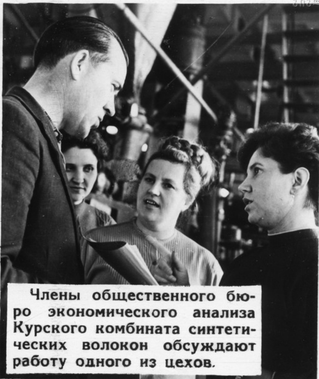
Члены общественного бюро экономического анализа Курского комбината синтетических волокон обсуждают работу одного из цехов.

Почти 5 миллионов трудящихся участвуют в постоянно действующих производственных совещаниях.