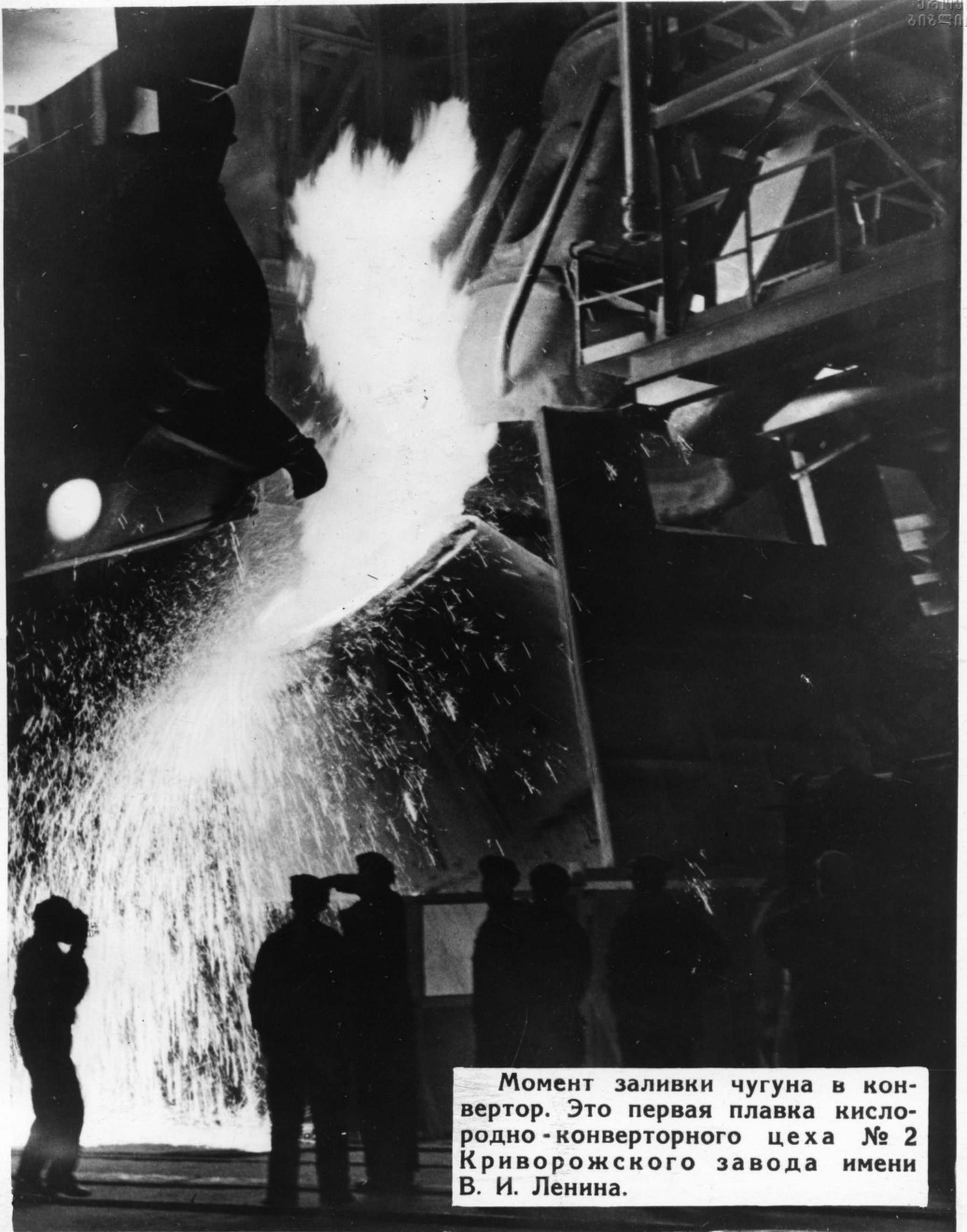
Момент заливки чугуна в конвертор. Это первая плавка кислородно-конверторного цеха № 2 Криворожского завода имени В. И. Ленина.

Под руководством Коммунистической партии советский народ своим самоотверженным трудом добился новых выдающихся успехов. Уже к 1 ноября 1965 года наша индустрия превзошла важнейшие показатели, намеченные семилеткой.