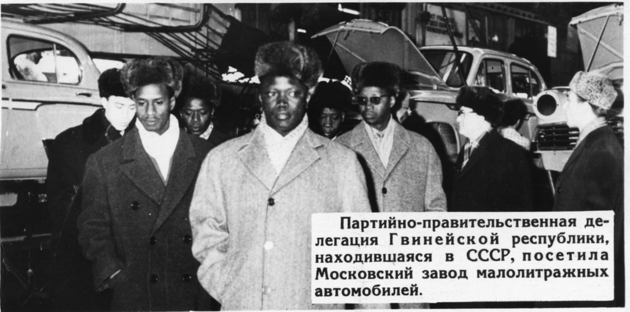
Партийно-правительственная делегация Гвинейской республики, находящаяся в СССР, посетила Московский завод малолитражных автомобилей.

Центральный Комитет КПСС за истекший год предпринял новые усилия для достижения единства социалистических стран и всего мирового коммунистического движения. Проведены встречи и обмен мнениями с партийно-правительственными делегациями 12 социалистических стран и с делегациями братских партий 50 капиталистических стран.