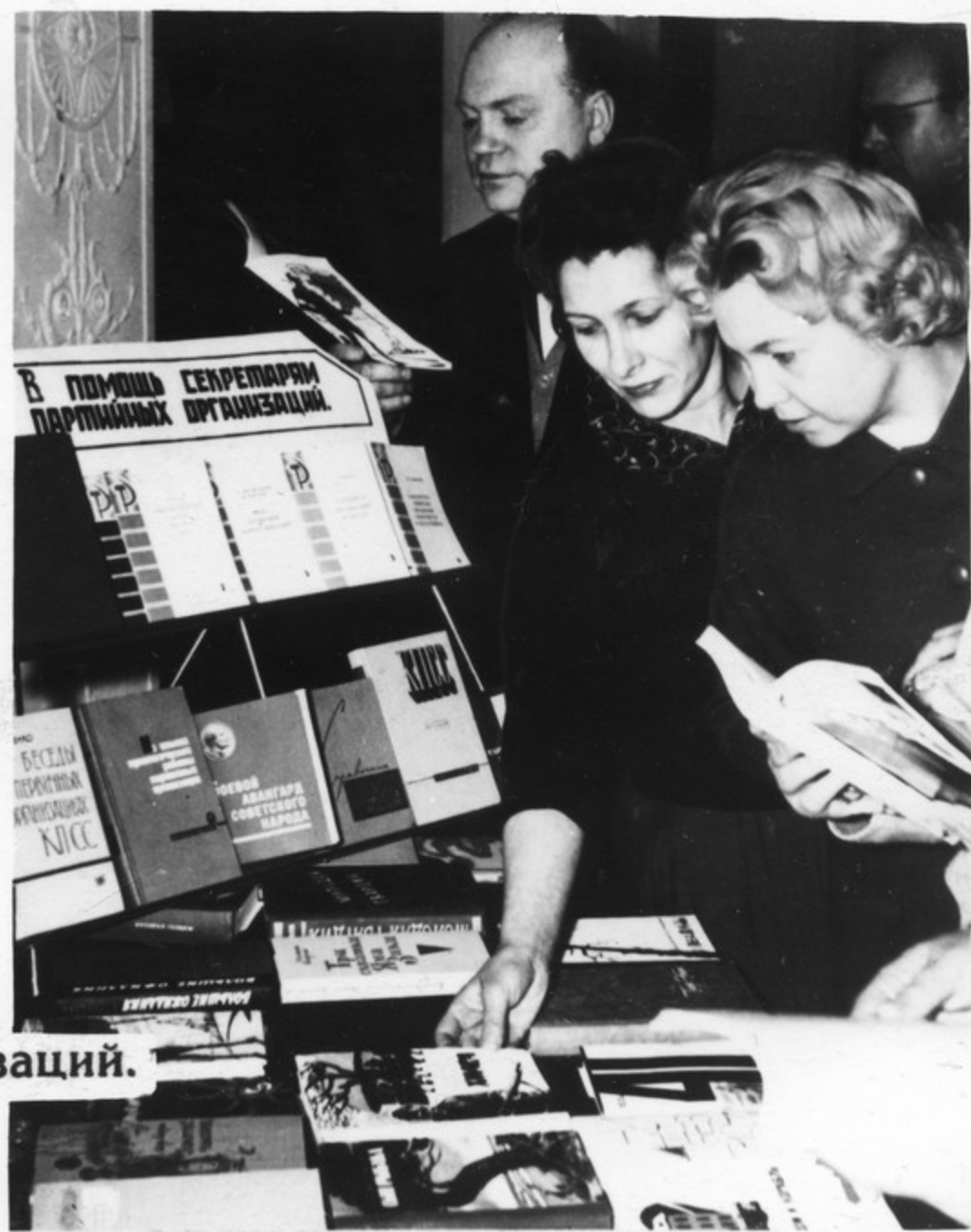
На совещании секретарей первичных партийных организаций.

Составной частью подготовки к съезду являются районные, городские, областные и краевые партийные конференции, съезды компартий союзных республик. Они сосредоточивают внимание коммунистов, всех трудящихся на первоочередных задачах хозяйственного и культурного строительства, повышении уровня всей партийно-организационной и идеологической работы.