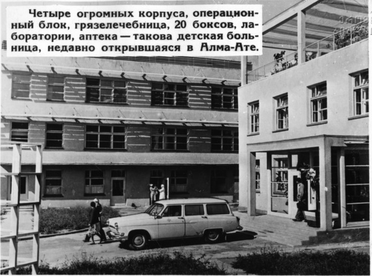
Четыре огромных корпуса, операционный блок, грязелечебница, 20 боксов, лаборатории, аптека — такова детская больница, недавно открывшаяся в Алма-Ате.

За время, прошедшее после XXII съезда, Коммунистическая партия и Советское правительство многое сделали для подъема жизненного уровня народа.