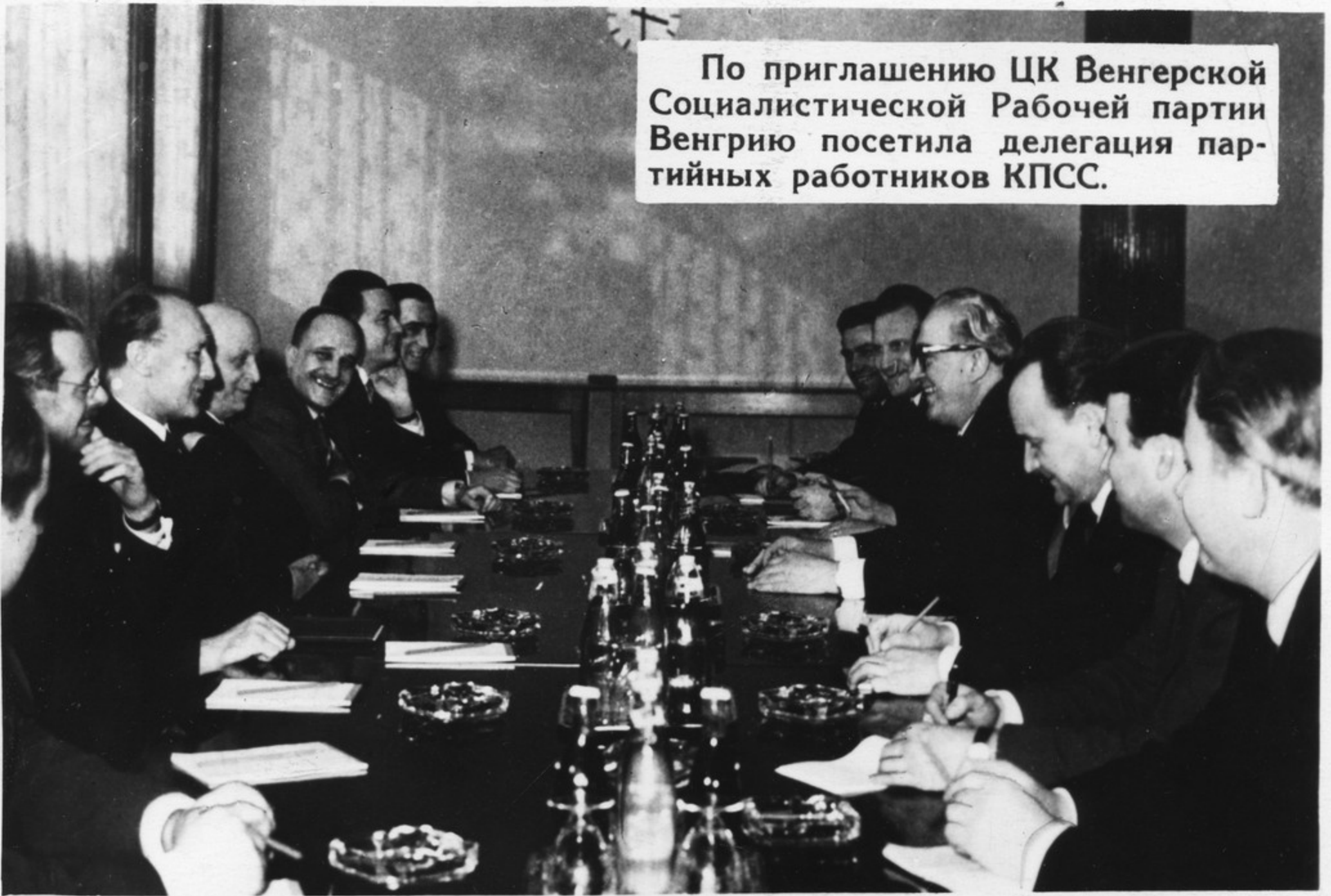
По приглашению ЦК Венгерской Социалистической Рабочей партии Венгрию посетила делегация партийных работников КПСС.