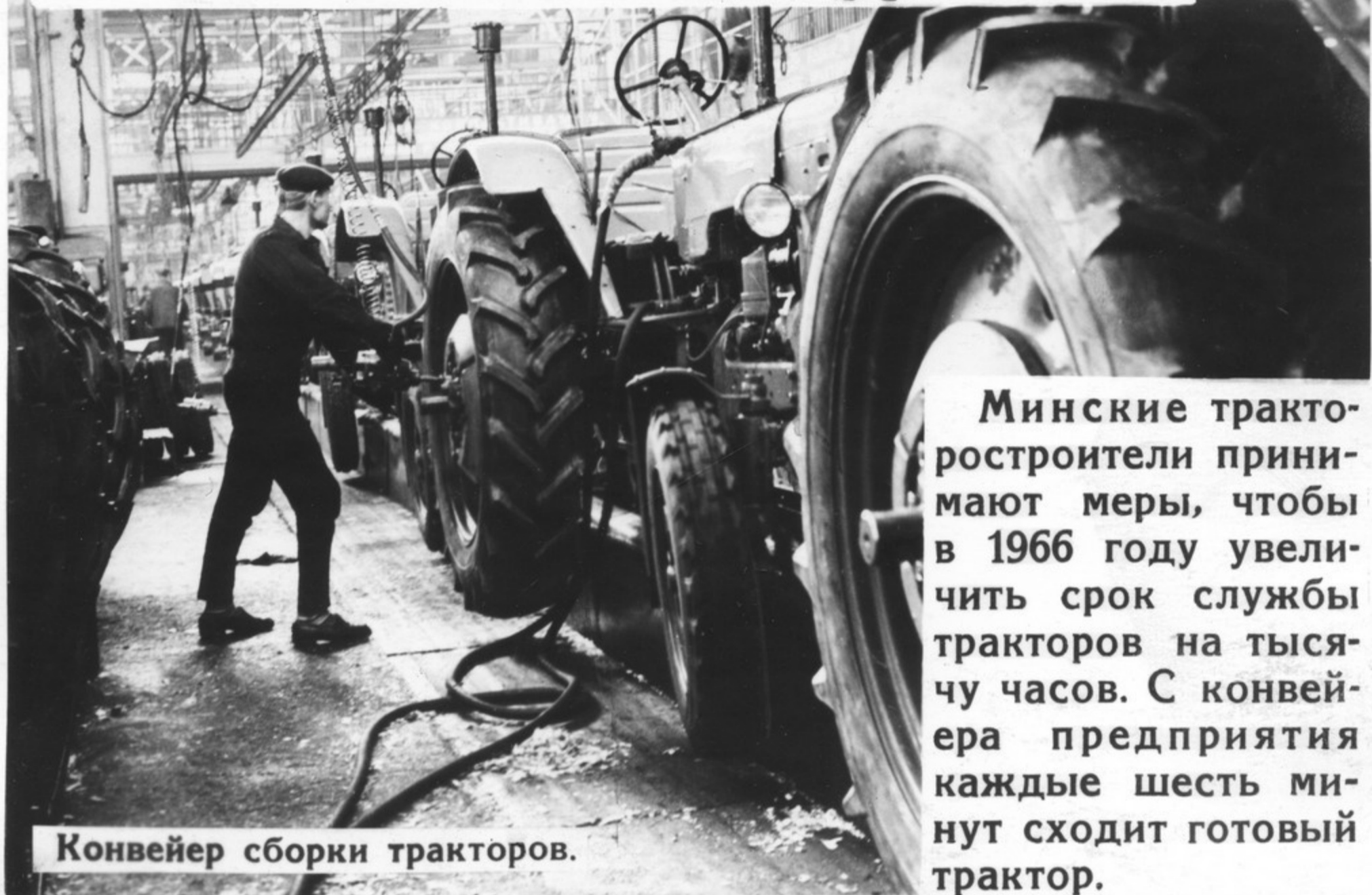
Конвейер сборки тракторов.

Минские тракторостроители принимают меры, чтобы в 1966 году увеличить срок службы тракторов на тысячу часов. С конвейера предприятия каждые шесть минут сходит готовый трактор.