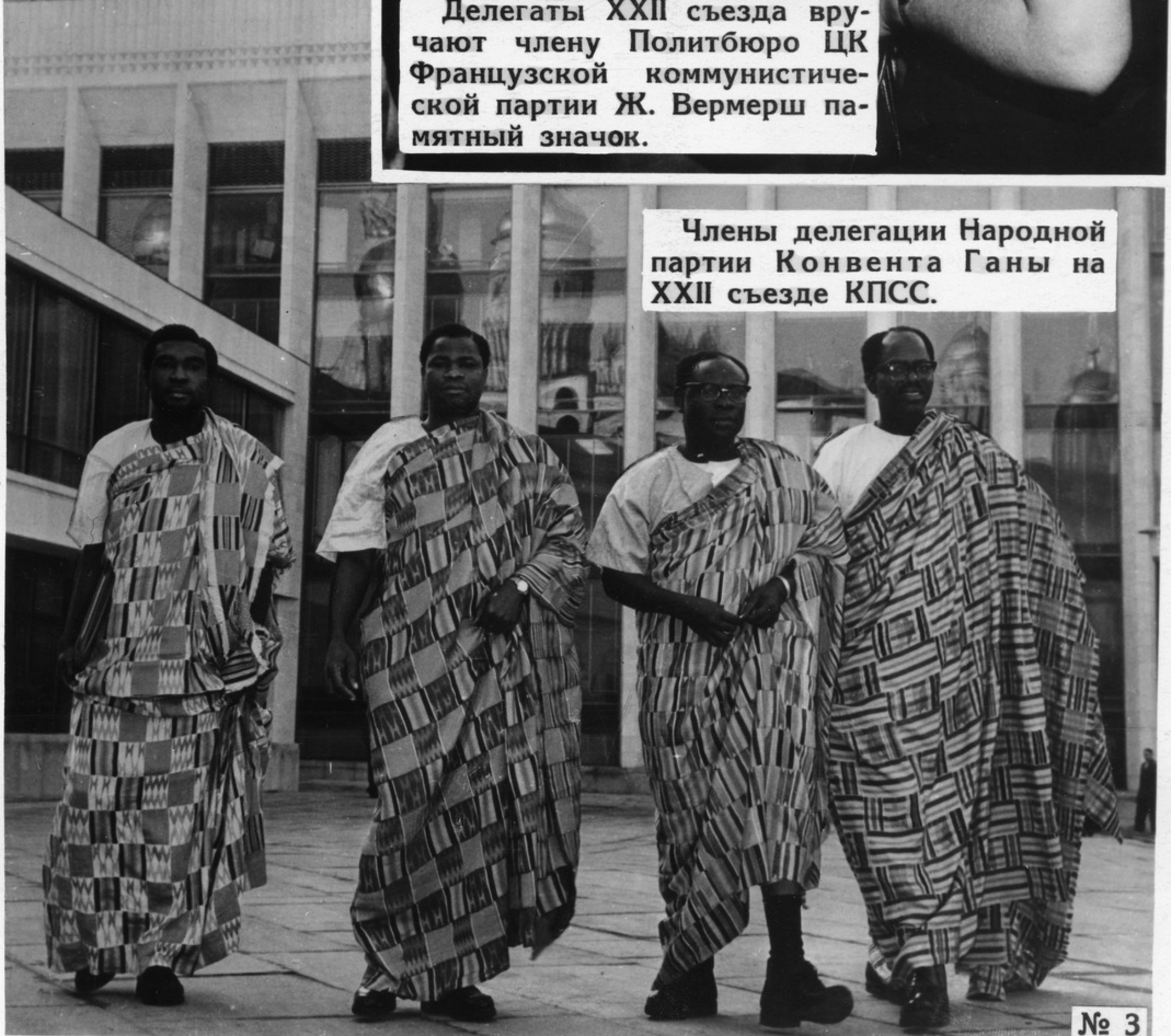
Члены делегации Народной партии Конвента Ганы на XXII съезде КПСС.