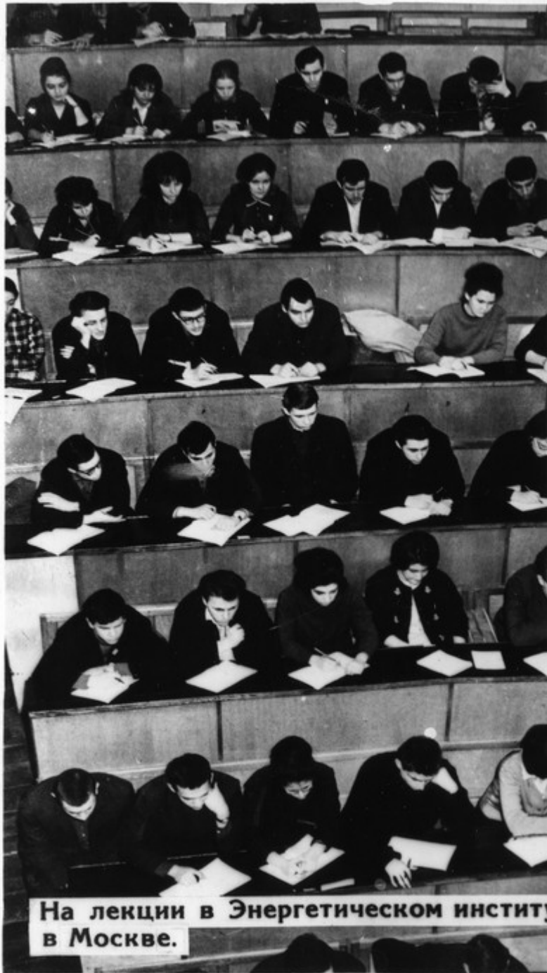
На лекции в Энергетическом институте в Москве.