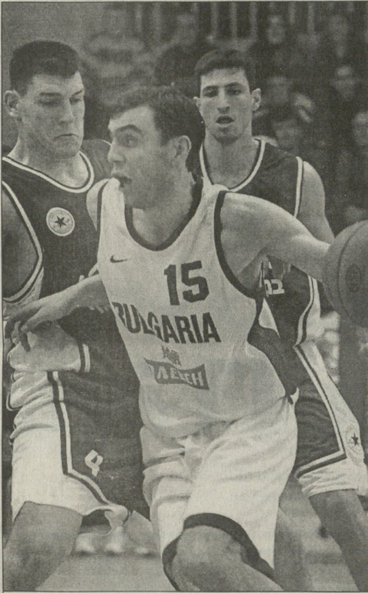
ტეოდორ სტაიკოვის შემჩრებელი ქართველთა შორის არაგინ იყო

ორიოდ თვის წინ იმედის სხვიით განათებული ქართული კალათბურთის მომავალი კვლავ ბურუსში მოიცვა. დიდი შანსია, უახლოესი ორი წელი ქართულმა კალათბურთმა ისევე სრულ იზოლაციაში გაატაროს. ანუ თუ საქართველოს ნაკრებმა ხვალ ბელარუსშიც ისევე ითამაშა, როგორც ბულგარეთში, ქართველები ევროპული კალათბურთის მზეს კიდევ კარგა ხანს ვერ იხილავენ.