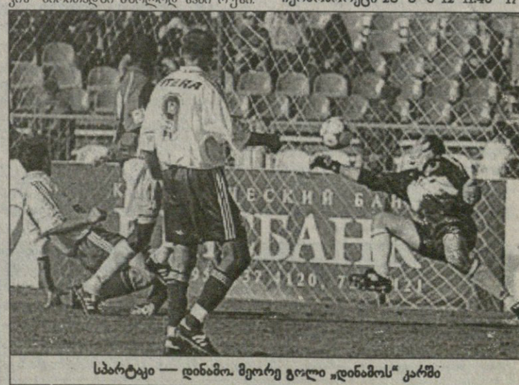
სპარტაკი — დინამო. მეორე გოლი „დინამოს“ კარში