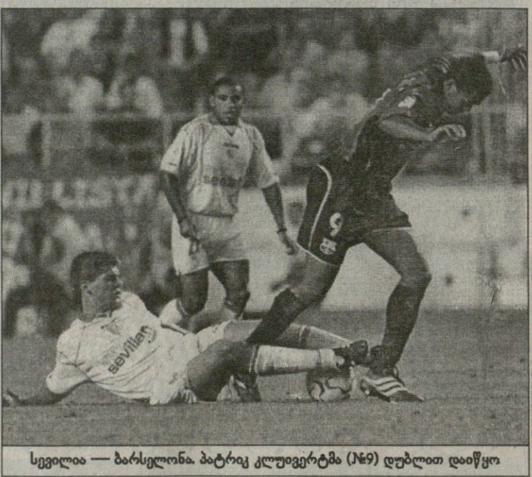
სევილია — ბარსელონა. პატრიკ კლუივერტმა (19) დუბლით დაიწყო

„ძალიან სასიამოვნოა, რომ გავიმარ-ტყვეო, ხოლო რაც შეეხება პირველ ადგილზე ყოფნას, ეს აშკარად ბოლო ტურის შემდეგ მიჩვენია“ — განაც-ხადა ლაკორნიელთა მწვინელმა ხა-ვიერ ირურტამ.