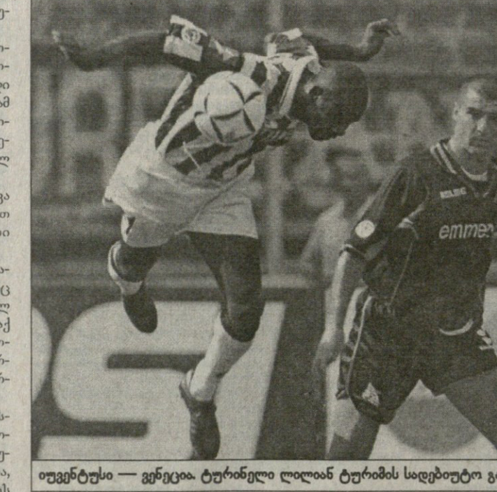
იუვენტუსი — ვენეცია. ტურინელი ლილიან ტურინის სადებიუტო გაფრენა