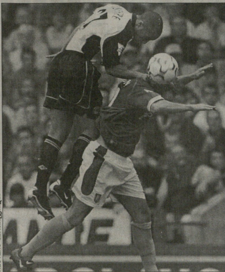
ასტონ ვილა — მანჩესტერი. სტუპარმა მკაცრად სილვესტრის ბოლ შერსონს ხერხემლი მოუსინჯა