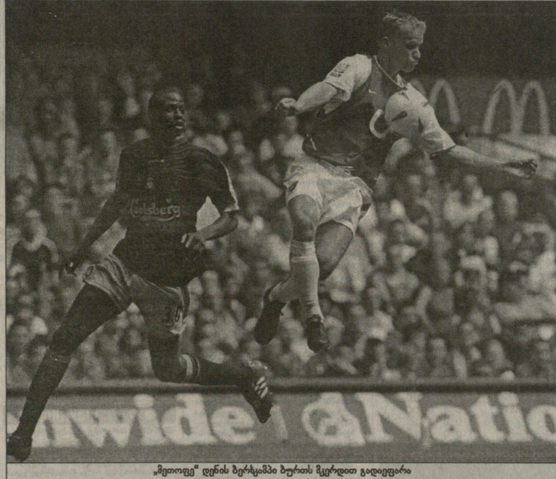
„მეთოფე“ დენის ბერესკამში ბურთს მკერდით გადაეფარა