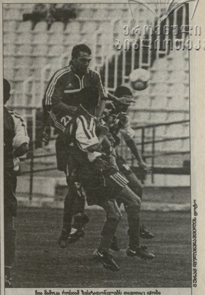
ჩია მამუკა რუსიამ ზესტაფონელებს თავითაც აჯობა

სტუმრად ფოთის „კოლხეთთან“ ჩაითვალათ 0:3 წაგება. ერთი მატჩის მიხედვით განსჯა, ალბათ, ცოტა უმართებულოა, თუმცა აქედანვე შეიძლება ვივარაუდოთ, რომ „მილანის“ უმთავრესი საზრუნავი ამ სეზონში უმაღლეს ლიგაში ადგილის შენარჩუნება იქნება.