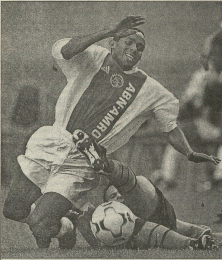
აიქსელ ვამბერტოს ეინდოვენენმა იიერიმა წიხლი მიაცოლა