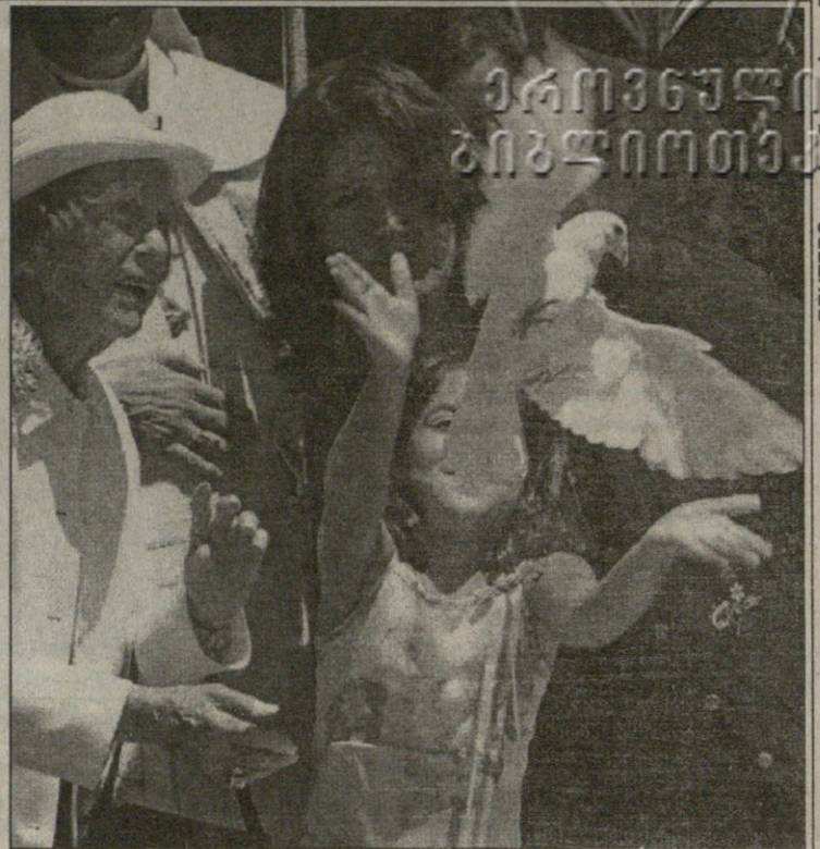
REUTERS ლოს ანჯელესიდან

ლოს ანჯელესში, ბრინჯულის უბანში, ტურელი წმინდა მარტინის კათოლიკური ეკლესიის ახლოს დაკრძალეს „ლოს ანჯელეს ლეიკერსის“ ლეგენდარული გამოცხადებული და კალათბურთის კომენტატორი ჩიკ ჰერნი, რომლის სიკვდილის ამბავიც გასულ კვირაში გაუწყეთ. ჩიკ ჰერნი 1960 წლიდან უძღვებოდა „ლეიკერსის“ საშინაო თამაშებს და გუნდის ერთ-ერთი სიმბოლო იყო. მწ წლისას სახლში ფეხი დაუცდა და თავის ტრავმა მიიღო, რამაც ტვინში სისხლის ჩაქცევა გამოიწვია. ჰერნის შვილთაშვილმა კაილა ნიუმენმა საფლავზე მტრედი აუშვა. „ლეიკერსის“ დიდი ვარსკვლავები კი გულამომჯდარნი იყვნენ და იცრემლებოდნენ. მეჯიკ ჯონსონი და მაიკლ კუპერი სხვა მრავალთან ერთად დაესწრენ ჰერნის დაკრძალვას.