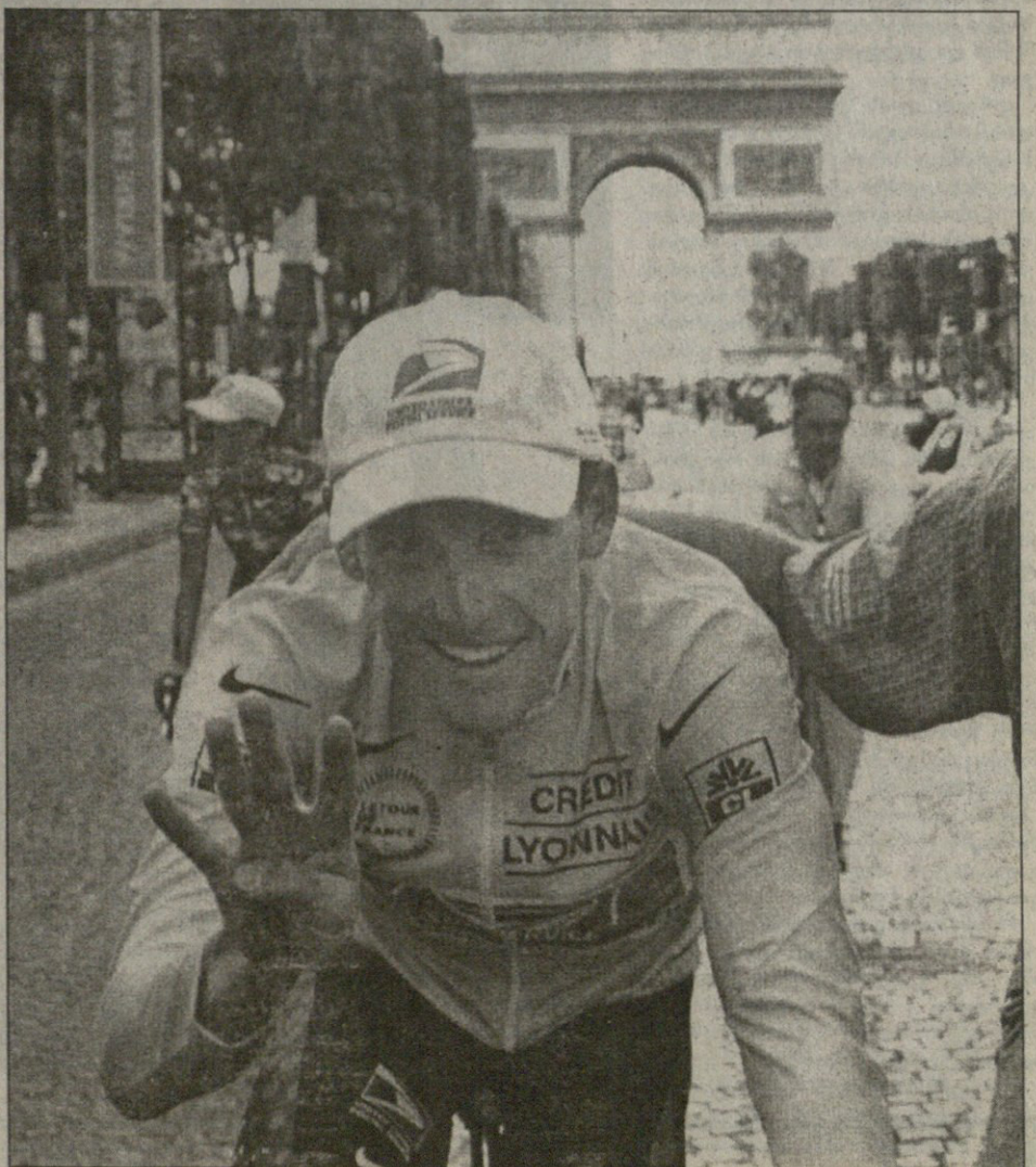
ლენს არმსტრონგი ტრიუმფალურ ფინიშს შეეგება

აი, ასეთ კაცთან შესახვედრად მიჰყვებოდნენ პელოტონს მამა-შვილი ლოიდები. ის, თავის ლურჯ-თეთრ მაისურიან თანაგუნდელებთან ერთად რიგით მეოთხე ტიტულის გზაზე იდგა. ის ლენს არმსტრონგი იყო: ტურის ან უკვე ოთხე ზის ტრიუმფატორი!