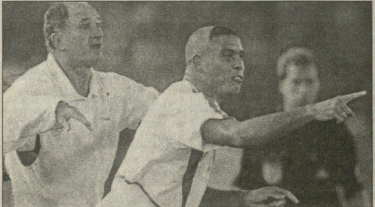
ლუიზ ფელიპე სკოლარიმ და რონალდომ ერთმანეთი დასიტყვეს

ბრაზილიელმა მესამედმა გამჩემპიონებელმა ლუიზ ფელიპე სკოლარიმ ადგილობრივ რადიოსთან ინტერვიუში პირი მთალო და თანამედროვეობის უნიჭიერებს თავდასხმელზე რასაც ფიქრობდა, ყველაფერი თქვა — სკოლარის თანამემამულე რონალდოზე მოგახსენებთ.