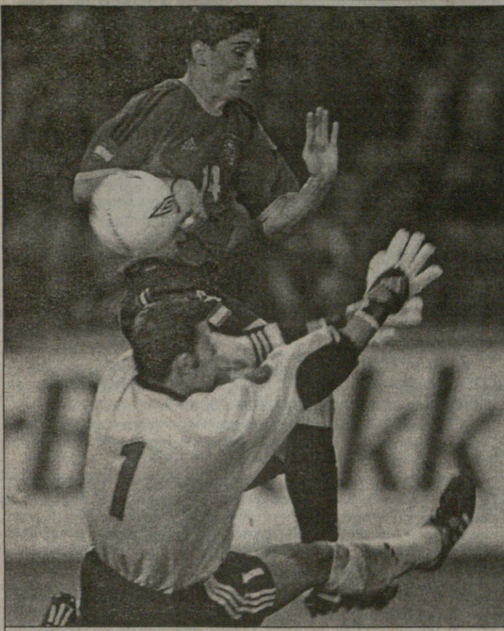
ფერნანდო ტორესმა ესპანეთის გამარჯვებისა გაიტანა