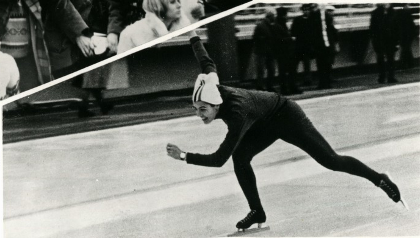
На ледяной дорожке — олимпийская чемпионка Людмила Титова.