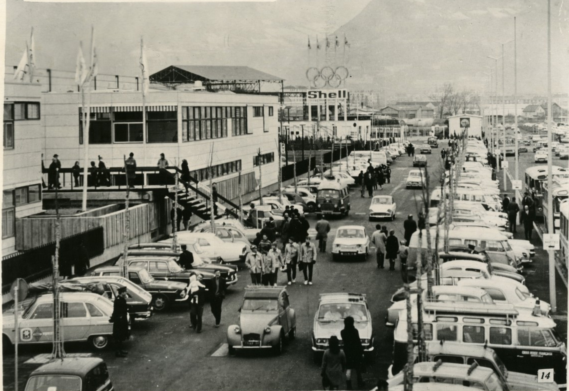
Гренобль. Близ Олимпийской деревни.