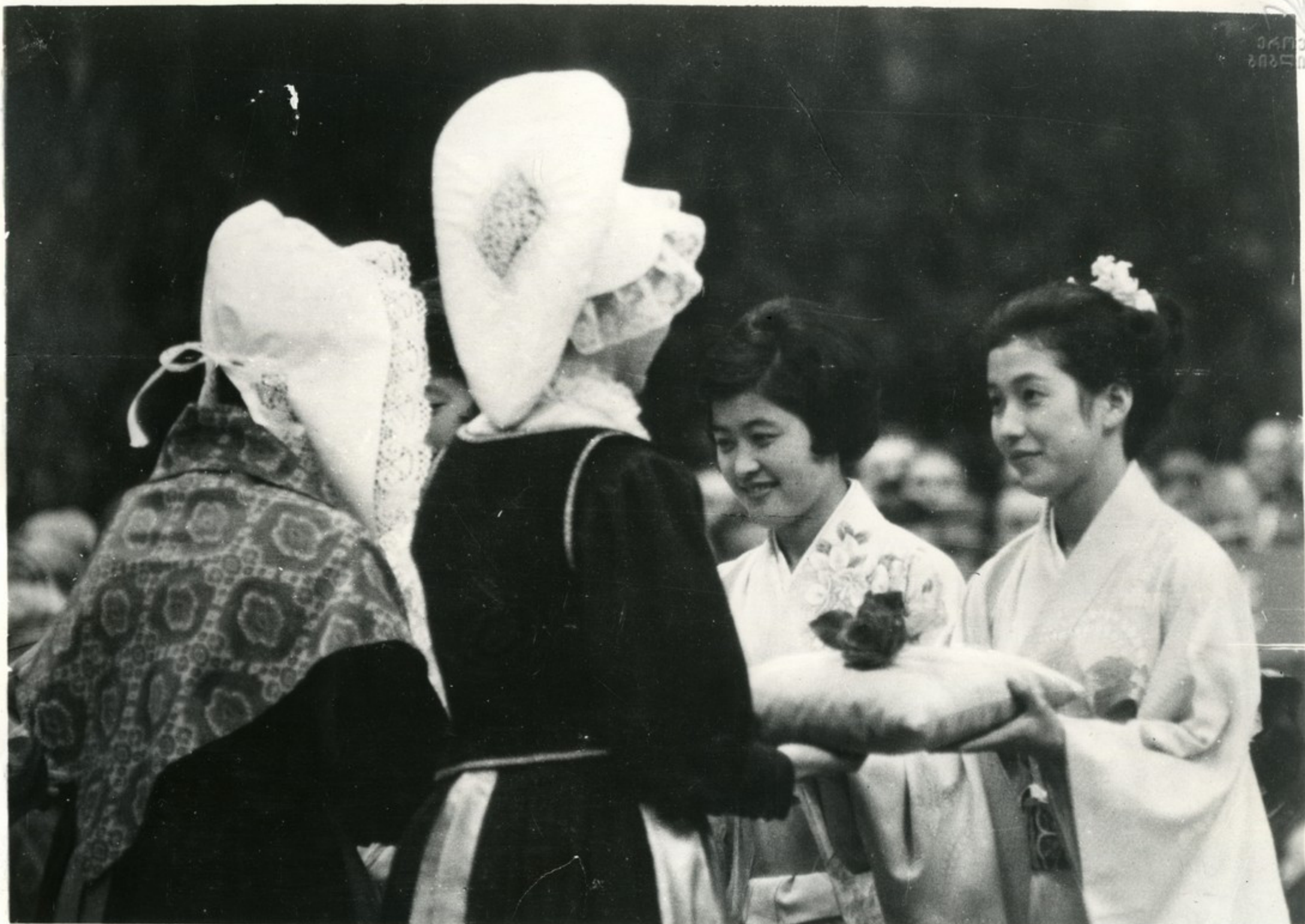
Церемония закрытия. Французские девушки вручают розы — эмблему Гренобля представительницам Японии, где будет проходить XI Белая Олимпиада.