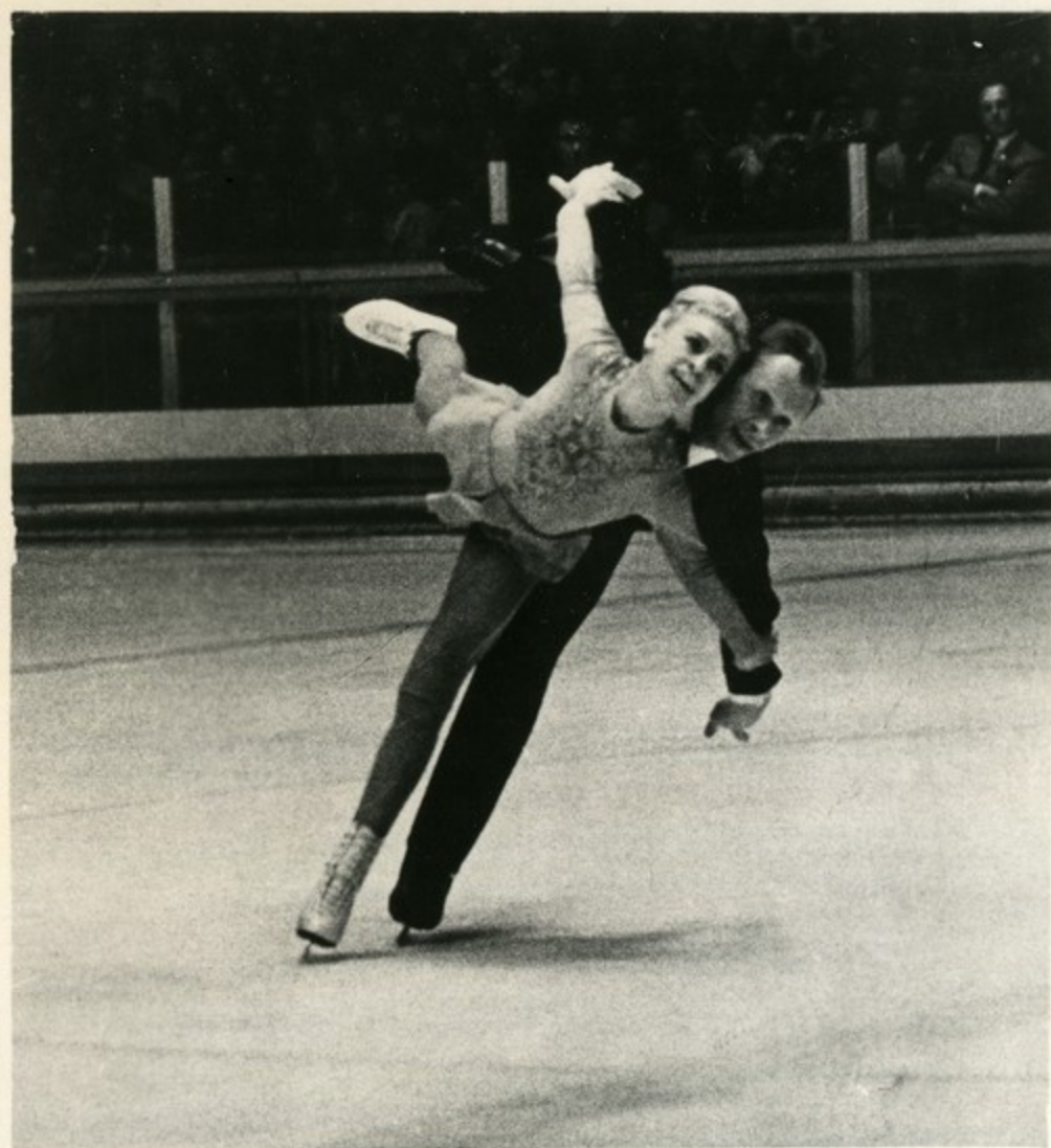
Второй раз подряд побеждает на Олимпийских играх прославленный дуэт — Людмила Белоусова и Олег Протопопов.