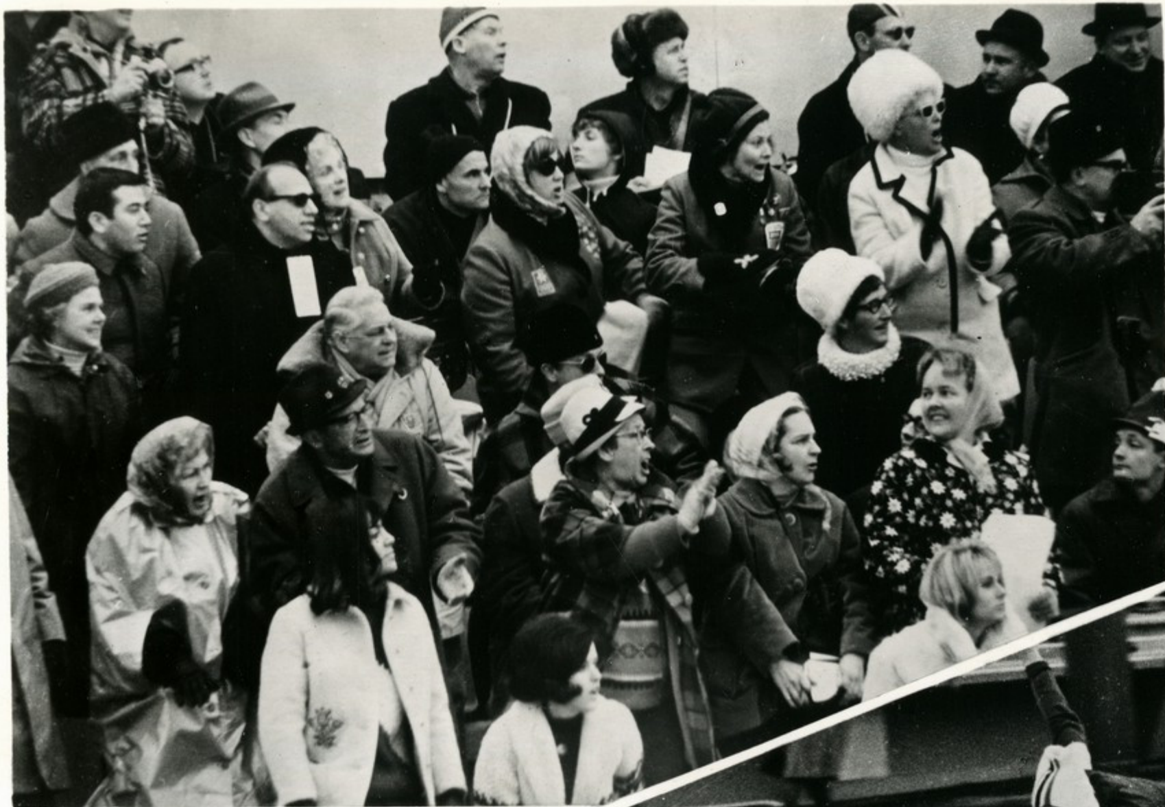
Гренобль. Зрители на трибунах наблюдают за соревнованиями конькобежцев.