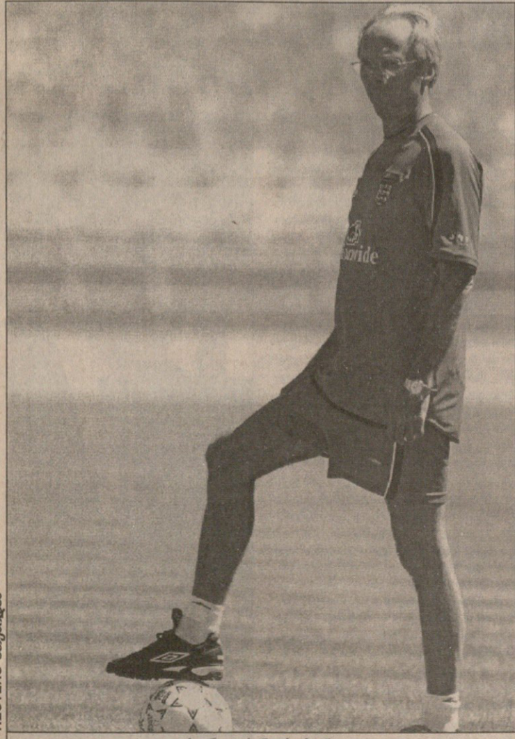
სვენ გორან ერიკსონი