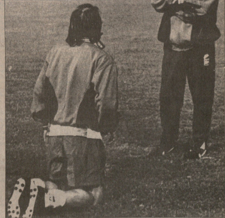
1997 წლის 9 სექტემბერი. თბილისი. ეროვნული. იტალიის წყრების მშინდელი მწვრთნელი და კაპიტანი: ჩეზარე და პაოლო მალდინები

კობა ინასარიძის ინტერვიუ პაოლო მალდინისთან