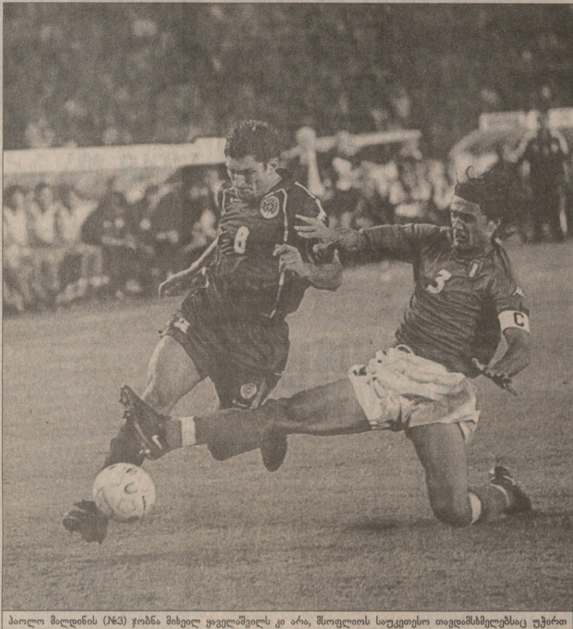
პაოლო მალდინის (№3) ჯობნა მიხეილ ყაველაშვილს კი არა, მსოფლიოს საუკეთესო თავდასხმელებსაც უჭირთ

— გამარჯობათ, სპორტული გაზეთი „სარბიელი“ გაწუხებთ. ინტერვიუ უნდა გთხოვოთ.