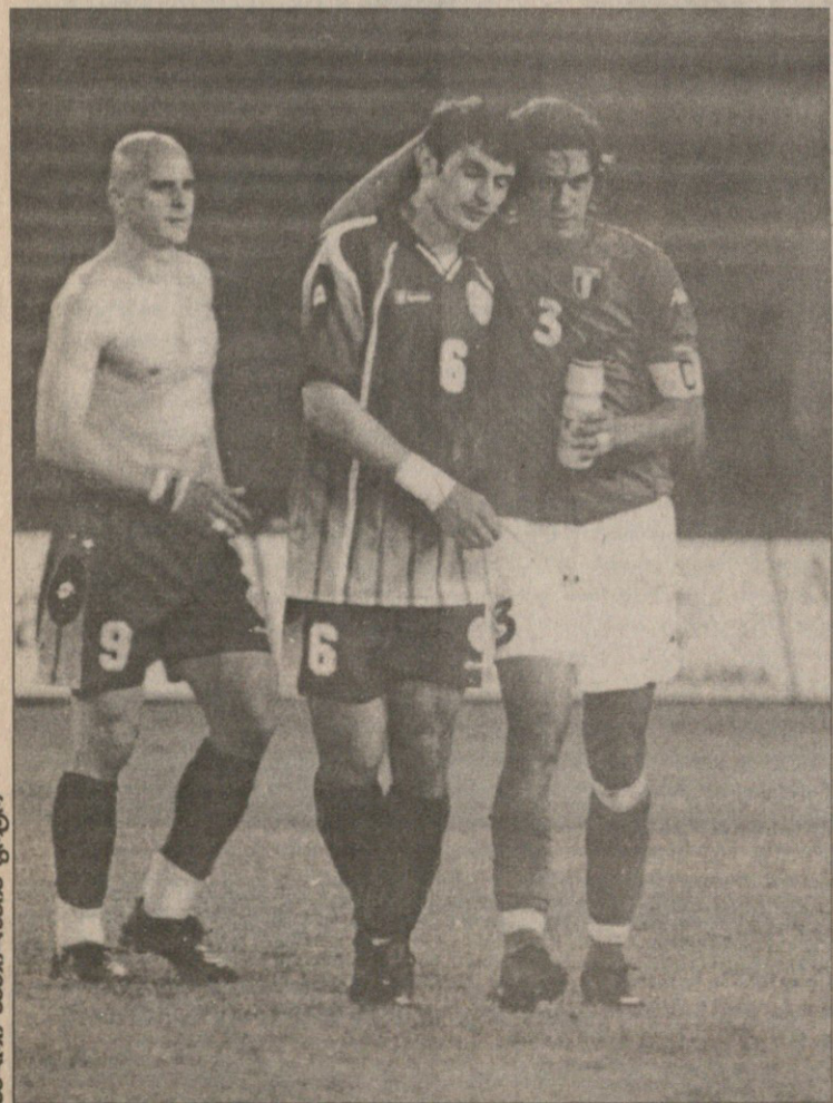
თანაგრძნობა: კახა კალაძე და პაოლო მალდინი