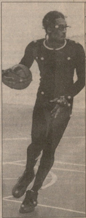
REUTERS ლოს ანჯელესიდან

საბაისოდ ახალი კომპიუტერული თამაში მზადდება. გმირები კვლავაც ენბიეი-ს კალათბურთელები იქნებიან და თამაშიც სომ ზუსტად ისეთი იქნება, ენბიეი-ში რომ გახურდება ხოლმე. შეიძლება ითქვას, რომ ამ ტელეთამაშს ნამდვილი თამაშისგან ვერ გამოთარჩევ. ყოველ კალათბურთელს თავისი ასლი ეყოლება ეკრანზე, მისი თამაშის მანერითა და ხერხებით. სწორედ საკუთარი ასლის გადაღებებზე ღვრის ოფლს „ლეიკერსის“ ლიდერი კობი ბრაიანტი.