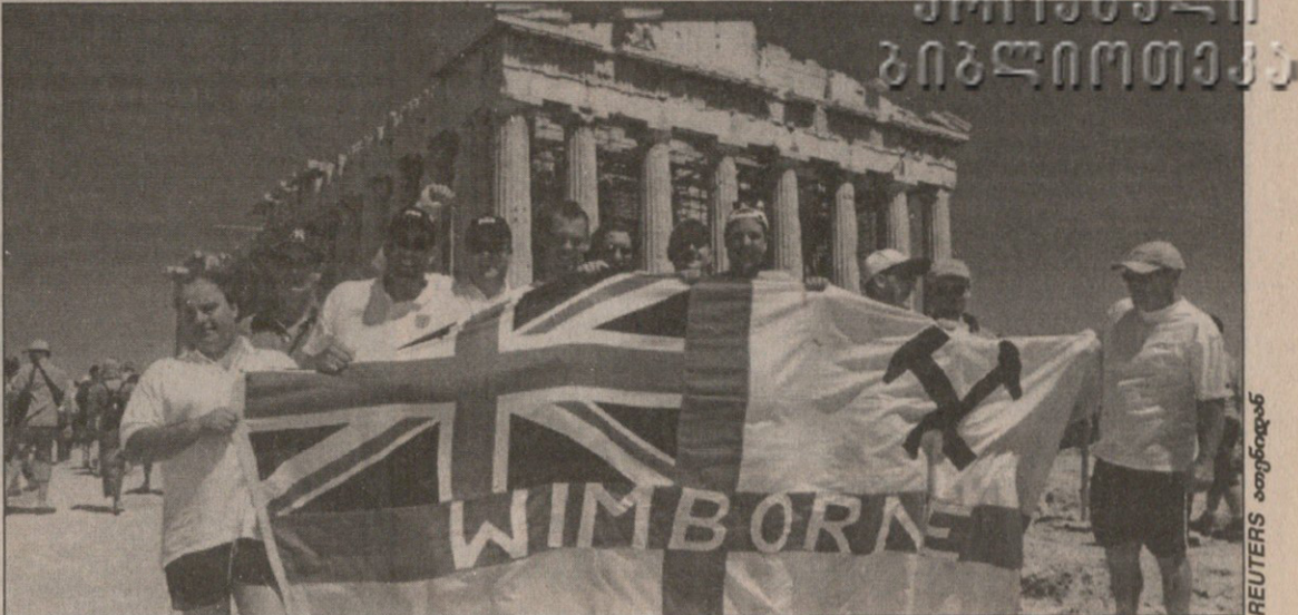
ინგლისელი ფანების დასახვედრად ბერძნული პოლიციაც მზადია