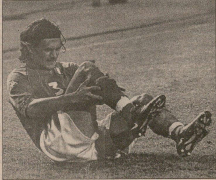
პაოლო მალდინიმ ჩვენს „ეროვნულზე“ მეორედ ითამაშა