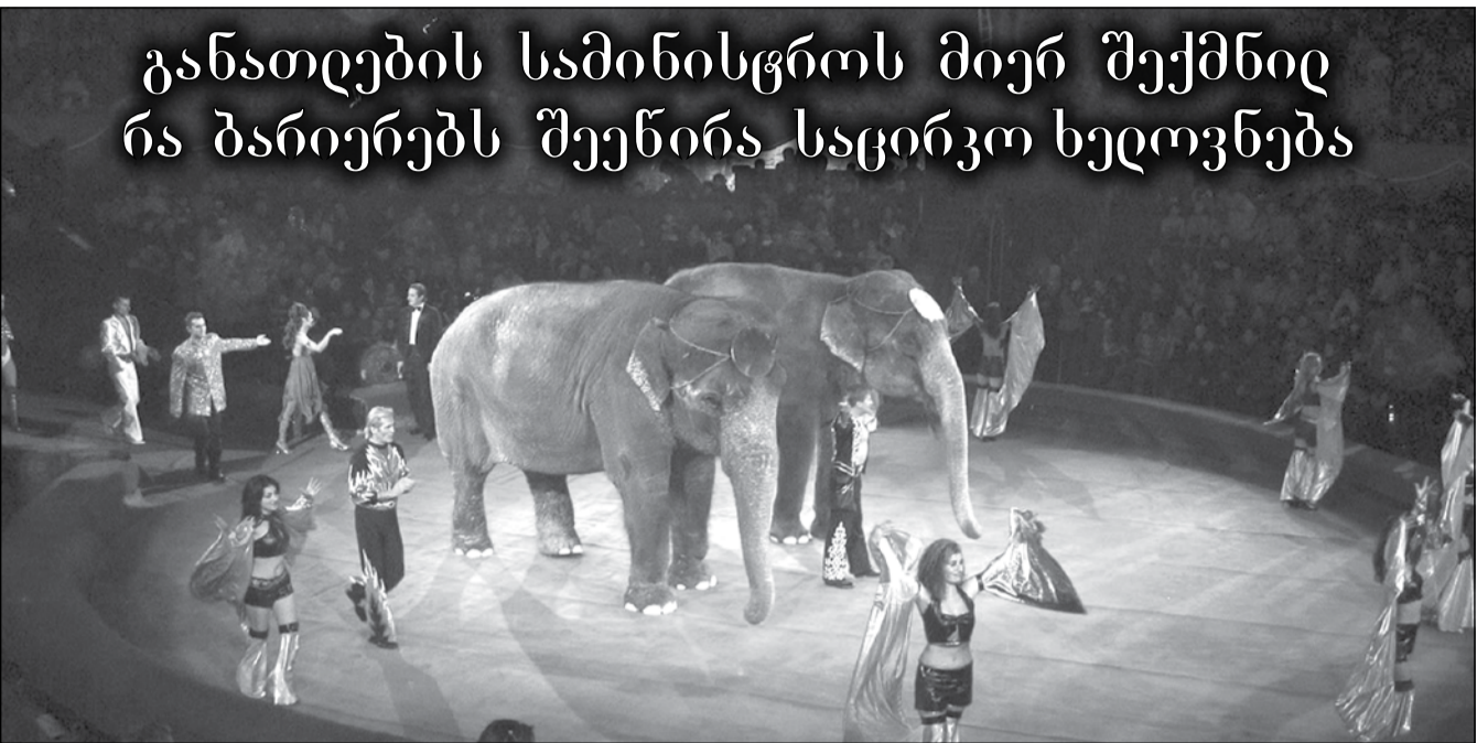
განათლების სამინისტროს მიერ შექმნილ ბარიერებს შეუწინააღმდეგავი საცირკო ხელოვნება

— იყო შემთხვევა, განათლების სამინისტრომ სწორედ საცირკო ნომრების ჩატარების ნებართვის გაცემისთვის გაათავისუფლა სკოლის დირექტორი... მხოლოდ დირექტორი ვერაფერს წყვეტს — კანონმდებლობით, საჯარო სკოლებში ღონისძიების ჩატარება ხდება შემდეგნაირად: ღონისძიების ორგანიზატორი შესაბამისი განცხადებით მიმართავს სკოლის დირექტორს, რომელიც ერთი თვის ვადაში შეისწავლის საკითხს და ამის შემდეგ ამ თხოვნას skype-ით უგზავნის განათლების სამინისტროს, რომელსაც საკითხის განსახილველად ასევე ერთი თვის ვადა აქვს. ამ ვადის გასვლის შემდეგ, თუ საჭიროდ ჩათვალა სამინისტრომ, თანხმობას აძლევს სკოლას, მაგრამ ამასობაში, გადის ორი თვე და ესეც არ არის საკმარისი — რადგან სასკოლო ფართები ეკონომიკის სამინისტროს ეკუთვნის, განათლების სამინისტროდან დადებითი პასუხის მიღების შემდეგ, სკოლის დირექტორი ეკონომიკის სამინისტროს მიმართავს თხოვნით ღონისძიებისთვის ფართის გამოყოფის თაობაზე, რასაც დამატებით ერთი თვე სჭირდება; სამინისტროდან დადებითი პასუხის მოსვლის შემდეგ კი, კიდევ რამდენიმე ბარიერია გადასალახი. როცა სკოლის