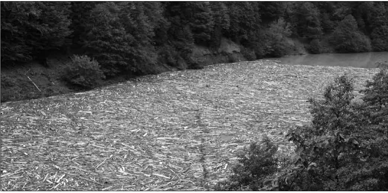
დასასრული მე-7 გვერდზე

— არ ვიცი, მაგრამ, წესით, უნდა იცოდეს! არასამთავრობო ორგანიზაციები, განსაკუთრებით კი „მწვანე ალტერნატივა“, რომელიც ყველაზე ბევრს ყვირის, ბევრჯერაა ნამყოფი ადგილზე და საინტერესოა, ერთხელ მაინც რატომ არ გააკეთა განცხადება? რა ხდება, ეს ხომ პირდაპირ მათ საქმიანობას ეხება?! სამწუხაროდ, „მწვანე ალტერნატივა“ და, ზოგადად, გარემოს დამცველები, გარემოს დაცვის გარდა, ყველაფერს აკეთებენ! რაც მთავარია, ჰიდროელექტროსადგურებიდან გამომდინარე ენერჯია ყველაზე სუფთაა, „მწვანე“ ენერჯიაა და სწორედ ამას ეწინააღმდეგებიან. ბევრი კითხვა ჩნდება, რატომ არ სურთ ხულონჯის პროექტის განხორციელება და არა მარტო ამ პროექტის. ისინი ნებისმიერი ჰესის მშენებლობას ეწინააღმდეგებიან, მნიშვნელობა არ აქვს, ნ-მეგავატია, მცირე ჰესი იქნება, თუ 700 მეგავატია სიმძლავრის, დიდი ჰესი.