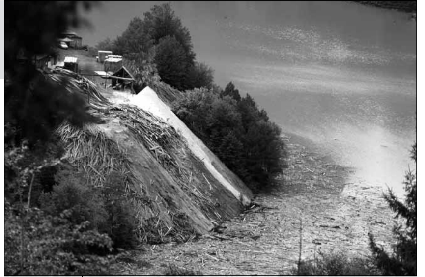
„ვერსია“ შეეცადა ამ საკითხზე ინფორმაცია მოეპოვებინა და როგორც გავარკვეით,

წყაროს დაუზუსტებელი ინფორმაციით, მესტიის შემოგარენსა და ხაიშში, დაახლოებით, 20-მდე უკანონო სამხერხაო მონყობილი, მათგან კი ლიცენზია მხოლოდ სამს შეიძლება ჰქონდეს. არაოფიციალური ინფორმაციით, ხე-ტყის უკანონო ბიზნესს საქართველოში ნაციონალური მოძრაობის გენერალური მდივანი ვანო მერაბიშვილი ლობივდა, თუმცა ამ ბიზნესში არც კახა ბენდუქიძის ინტერესებს გამოიყენებდნენ, რის გამოც მერაბიშვილისა და ბენდუქიძის ბიზნესინტერესები გადაიკვეთა. რამდენიმე წლის წინ, ამ ფაქტის გამო მაშინდელ ხელისუფლებაში აშკარა უთანხმოებაც იყო. „ვერსიის“ წყარო აცხადებს, რომ ეს საკითხი გამოძიების პრეროგატივაა და სიმართლის დადგენა სამართალდამცავი უწყებების კომპეტენციაში შედის, რადგან აშკარა კანონდარღვევასთან გვაქვს საქმე.