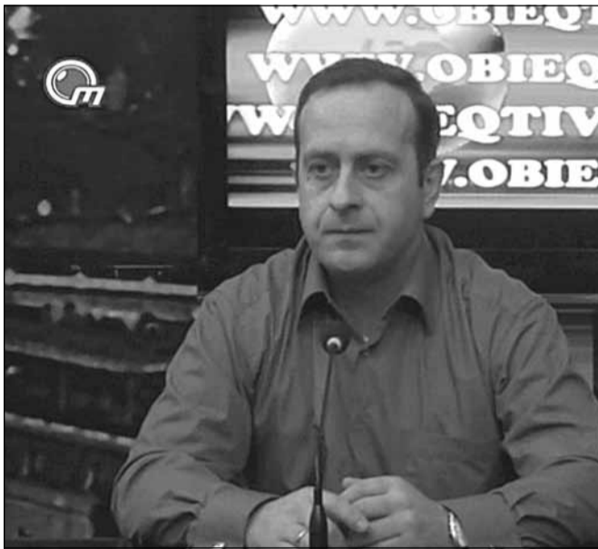
ის დასრულებას ჰპირდება. თქვენ რა მოლოდინი გაქვთ 27 ოქტომბრის შემდეგ?

— წინასაარჩევნოდ, ხელისუფლება და კოალიციის საპრეზიდენტო კანდიდატი საზოგადოებას კოჰაბიტაცი-