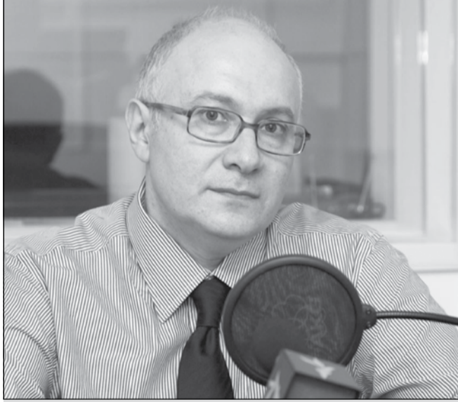
მაგვნი განაოქსი: „ნახავთ, მიშას დაიჭერენ“

შეიცვალა ხელისუფლება და ახლა ახალმა მოინდინა სხვების შენახვა. არჩევნების შემდეგ სახელისუფლებო რეჟიმამ ტელეპოლიგონზე გადაინაცვლა. იმთავითვე ცხადი იყო, რომ საზოგადოებრივი მაუწყებელი მტკიცედ იქნება დატანებული, რომ დღეს და ხვალ ბიძინა ივანიშვილს ალარ დასჭირდებოდა ის „მეცხრე არხი“, რომელიც არჩევნებამდე სჭირდებოდა.