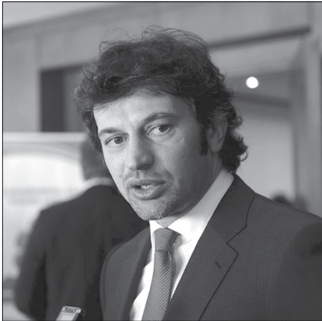
ქანა ქალაქი: „ზოგიერთი არასამთავრობო ორგანიზაციის ახირებას ჩვენი ქვეყნის ბედს, საქართველოს ენერგოგანვითარებასა და ენერგოდამოუკიდებლობას წამდვილად ვერ გადავაყოლებთ“

პავლე ქვეციანი გაიხსენა, ცხადია, კონკრეტული ჟურნალისტის კონტექსტში, მაგრამ თვითონ საბჭოთა ისტორიით დამძიმებული ტელევიზია – საველე რომ პავლე – საზოგადოებრივ მაუწყებლად ვერ იქცა, უკვე ფაქტია.