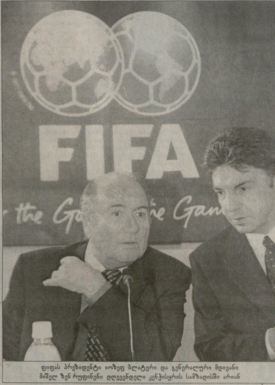
ფიფას პრეზიდენტი იოზეფ ბლატერი და გენერალური მდივანი მისელ ზენ რუფინენი დღევანდელი კენჭისყრის სამზადისში არიან

REUTERS ტოკიოდან დღეს ტოკიოში, ნაშუადღევს საქართველოს ნაკრების სამსოფლიოს ჩემპიონატო მეტოქეთა ვინაობა გაირკვევა. გაირკვევა ისიც, რამდენად უნდა იყოს ში მოხდება ჩვენი ეროვნული გუნდი — ან ხუთს დაეუბრისპირდებით, ან — ოთხს. ყოველივე წილისყრაზე დამოკიდებულია.