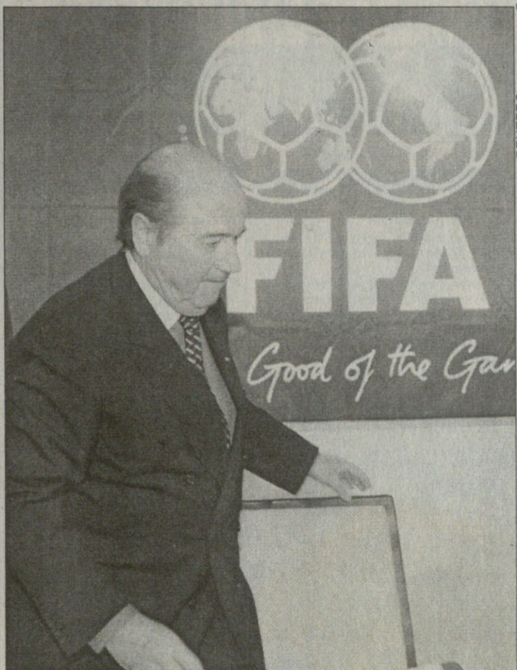
ისტორიაში უდიდეს კენჭისყრას ფიფას პრეზიდენტი იოზეფ ბლატერი უხელმძღვანელებს

ამერიკულ გუნდს მოუწევს არა 16, არამედ 18 მატჩის გამართვა. ფიფას გენერალური მდივნის, მიშელ ზენ-რუფინენის აზრით, კონმებოლში გარკვეული სიმძლეობა მოსალოდნელია. კერძოდ, შესარჩევი შეჯიბრება ჯამში 90 შეხვედრას მოიცავს, ხოლო, ენაიდან, სამხრეთ ამერიკელი წამყვანი მოთამაშეების უმეტესობა ევროპულ კლუბებში გამოდის, შესაძლოა მათი მიმოსვლის სირთულეები წარმოიშვას. „შეჯიბრების დაწყებისთვის ჩვენ უკვე შეჯერებული კალენდარი გვაქვს, მაგრამ პრობლემებს მაინც ველოთ“. — ბრძანა მან. ყველაზე ჩახლართული სისტემა კონკაფს აქვს. ამ კონფედერაციაში 35 ქვეყანაა გაერთიანებული, რომელთათვისაც მხოლოდ სამი ადგილი გახლავთ გამოყოფილი. ჯერ გაიმართება ჯგუფური ტურნირისა და პლეი-ოფის ერთობლივი ტურნირი, შემდეგ კი შეიქმნება ექვსგუნდიანი ჯგუფი, რომელიც სამ საუკეთესოს გამოავლენს.