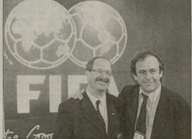
ფიფას ფინანსური დირექტორი ურს ლინსი (მარცხნივ) და მიშელ ბლატინი კენჭისყრას ჩინებულ ხასიათზე ხვდებიან

2002 წლის მსოფლიოს ჩემპიონატის კენჭისყრას შეჯიბრების 69-წლიან ისტორიაში უდიდესს — რომელშიც 195 ქვეყანა მონაწილეობს, დღეს მილიონობით ტელემაყურებელი იხილავს. იგი იაპონიის დედაქალაქის „საერთაშორისო ფორუმში“ გაიმართება და ახალი საუკუნის პირველ უდიდეს საფეხბურთო შეჯიბრებას დაუდებს სათავეს. ამასთანავე, იგი სათავეს დაუდებს პირველ ჩემპიონატს, რომელსაც ორი მასპინძელი ეყოლება. ფიფას 203 წევრი ჰყავს. მათგან მხოლოდ ჩრდილო კორეა, ავღანეთი, ნიგერია, გვინეა ბისაუ და პაპუა ახალი გვინეა დარჩნენ განზე მსოფლიოს ჩემპიონის საფრანგეთი და მასპინძლები, იაპონია და კორეა შესარჩევ ეტაპში არ მონაწილეობენ. ისინი საქმეში პირდაპირ ფინალურ სტადიაზე ჩაერთვებიან, რაც იმას ნიშნავს, რომ დღევანდელი, საათნახევრიან პროცედურაში 195 ქვეყანას ვიხილავთ. შესარჩევ ეტაპზე 752 შეხვედრა გაიმართება — ცხადია, შეიძლება რაღაც შეიცვალოს — რომელთა შედეგად გაირკვევა იმ 29 ნაკრების ვინაობა, საფრანგეთთან და მასპინძლე-