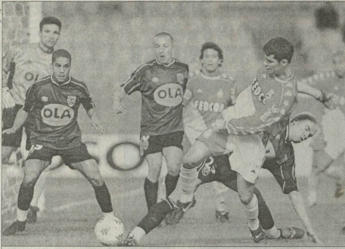
მონაკო — ლანსი 2:0. ამ არეულობას „ლანსის“ კართან გოლი არ მოჰყოლია

„მონაკოს“ ახლა 39 ქულა აქვს და ექვსი ქულით უსწრებს მეორე ადგილზე მყოფ „პარი სენ-ჟერმენს“. პარიზელებმა თავის მხრივ „პარი სენ-ჟერმენს“ მინიმალური ანგარიშით „რენს“ მოუგეს. ამბიციური „რენისთვის“ უკანასკნელ ტურა მატჩში ეს პირველი დამარცხება იყო. გოლი შეხვედრის მეორე წუთზე გავიდა. დაახლოებით ოცი მეტრის მანძილიდან ლორან რობერმა საჯარიმო დარტყმა შეასრულა. ბუ-