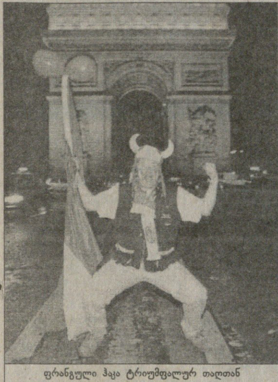
ფრანგული ჰაჰა ტრიუმფალურ თაღთან

„ახალ ზელანდიასთან“ „მამლებს“ გამარჯვებას მთელი საფრანგეთი გამოეხმაურა. მორაგებებს ეს დიდი წარმატება რესპუბლიკის პრეზიდენტმა ჟაკ შირაკმა, პრემიერ-მინისტრმა ლიონელ ჟოსპენმა და ახალგაზრდობისა და სპორტის მინისტრმა მარი-ჟოზე ბიუფემა მიულოცეს. კვირას თეიქენში გამართული მატჩის დასრულებისთანავე ბატონ შირაკს ფრანგთა ნაკრების კაპიტან რაფაელ იბანესისთვის დაურეკავს და საქებარი სიტყვები არ დაუშურებია მისი და მისი თანაგუნდელების მიმართ. როგორც ელისეს სასახლის პრესსამსახური აცხადებს, საფრანგეთის