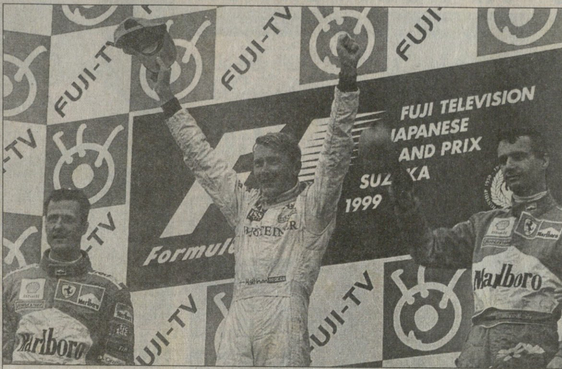
სუტუკა 1999 — ორგზის ჩემპიონი მიკა ჰაკინენი, მიხაელ შუმახერი (მარცხნივ) და ედი ირვინი