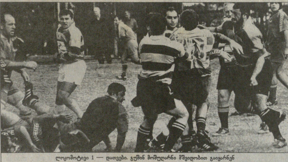
ლოკომოტივი 1 — დათვები. გუშინ მომუდარნი მშვიდობით გაიყარნენ