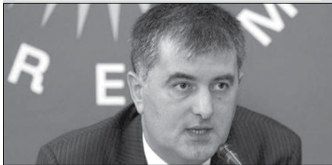
მთავრობამ „სა“ პეპატივის სამკურნალო მედიკამენტების შესყიდვა გადაწყვიტა

სასჯელალსრულების მინისტრის სოზარ სუბარის განცხადებით, ტენდერში მონაწილე კომპანიები ვალდებული იქნებიან, C პეპატივის სამკურნალო ინექცია ბაზარზე 10 ათასი მოქალაქისთვის იგივე ფასად გაიტანონ, რა ფასადაც 2 ათასი პაციენტის მკურნალობა მოხდება.