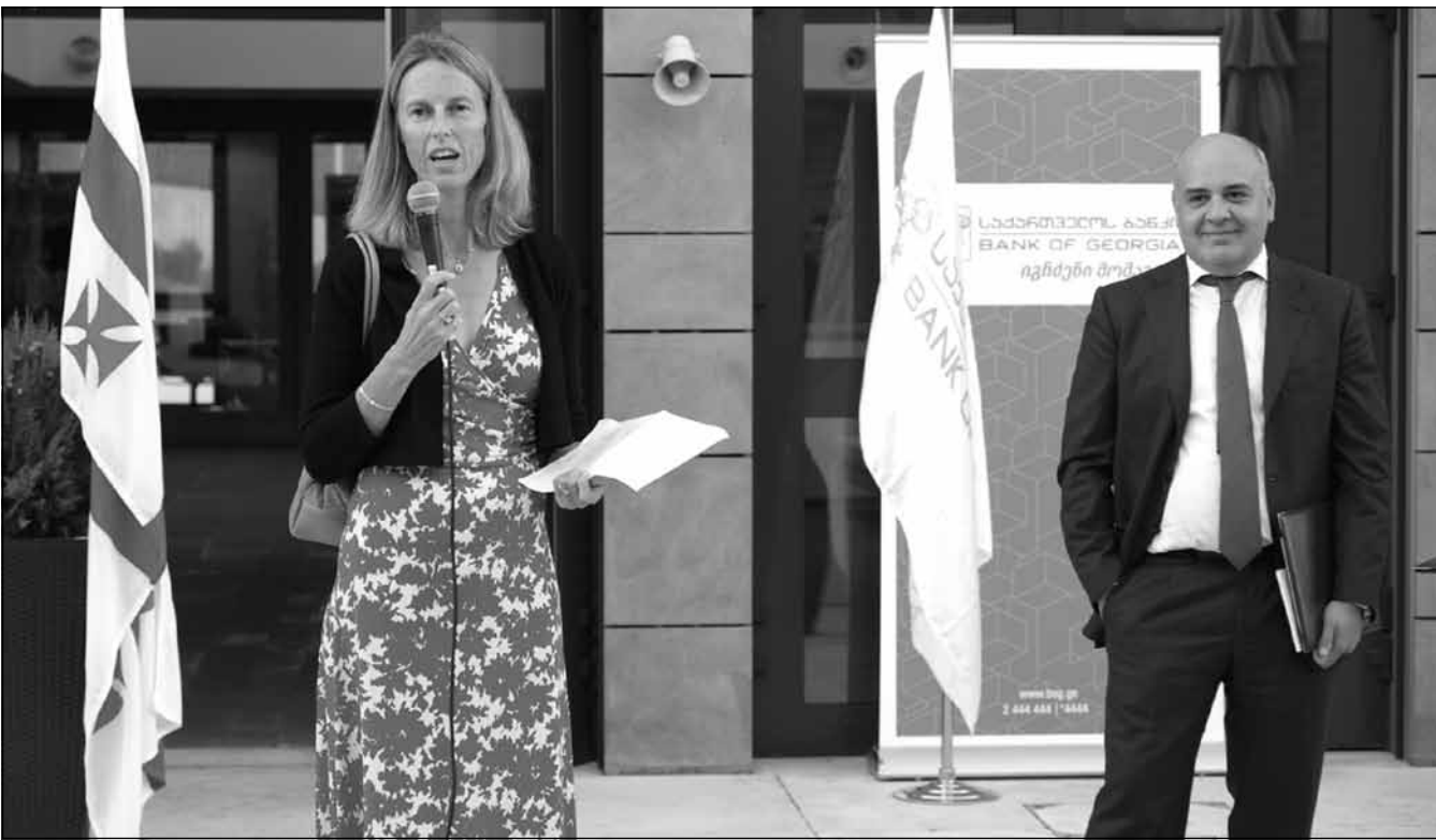
ბანკი Chevening-ის სტიპენდიების პროგრამის პარტნიორი გახდა!

საგანგებო ღონისძიებას, რომელიც დიდი ბრიტანეთის საელჩოში ჩატარდა, ჩივნიგის კურსდამთავრებულები, სამოქალაქო საზოგადოებისა და ბიზნესსწრეების წარმომადგენლები ესწრებოდნენ. „მოხარული ვარ, ვუმასპინძლო წარმატებულ სტუდენტებს, რომლებიც ცოტა ხანში გაემგზავრებიან დიდ ბრიტანეთში სწავლის გასაგრძელებლად.“