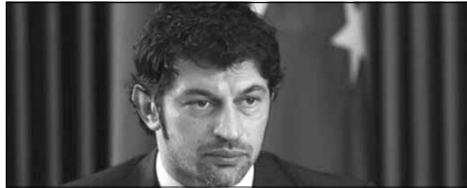
ენერგეტიკის მინისტრო ივანე სპირაძის განცხადებით, ენერგეტიკის მინისტრი კახა კალაძე ენერგოსექტორში უკვე მომუშავე და ასევე, პოტენციურ ინვესტორებს შეხვდა. მინისტრმა ინვესტორებს „საქართველოში ელექტროსადგურების მშენებლობის ტექნიკურ ეკონომიკური შესწავლის, მშენებლობის, ფლობის და ოპერირების შესახებ ინტერესთა გამოხატვის წესის დამტკიცების შესახებ“ მთავრობის დადგენილებაში განხორციელებული ცვლილებები გააცნო. ენერგეტიკის სამინისტროს ინფორმაციით, ახალი რეგულაციების მიხედვით, სამინისტრო ინვესტორებთან ურთიერთობის ახალ ეტაპზე გადადის და მათ მოქნილ წესებს სთავაზობს, რაც ენერგეტიკაში საინვესტიციო გარემოს გააუმჯობესებს და დამატებითი ინვესტიციების მოზიდვას შეუწყობს ხელს. კონკრეტულად — შემცირდა სამშენებლო გარანტიის მოცულობა, რომელიც ინვესტორს სამინისტროსთვის მემორანდუმის გაფორმებამდე უნდა წარედგინა და ორსაფეხურიანი სისტემა ამოქმედდა.

სოფლის მეურნეობის მინისტრის, შალვა ფიფას ინიციატივით, „შეღავათიანი აგროკრედიტის პროექტს“ უკვე მეოთხე და მეხუთე კომპონენტზეც დაემატა. მეოთხე კომპონენტი, ანუ შეღავათიანი აგროლიზინგი, სოფლის მეურნეობის პროდუქციის დამატებითი ღირებულების შემქმნელი საწარმოებისა და დანადგარების განვითარებას ეხება. შეღავათიანი აგროლიზინგით ის საწარმოები ისარგებლებენ, რომლებიც სასოფლო-სამეურნეო პროდუქციას ქმნიან (თანამედროვე ფერმები, სასაბურთო მეურნეობები და სხვა), ეწევიან სასოფლო-სამეურნეო პროდუქციის ნებისმიერი სახით გადამამუშავებას (შენახვა, დაფასოება, გადამამუშავება), ან აწარმოებენ სასოფლო-სამეურნეო პროდუქციის შესაფუთ მასალებს. მეხუთე კომპონენტის ფარგლებში, შეღავათიანი სესხები ღვინის მწარმოებელი კომპანიებისათვის გაიცემა. ესაა 15-თვიანი სესხი 12-დან 15%-მდე, რომლის 9%-ს სახელმწიფო დაფარავს.