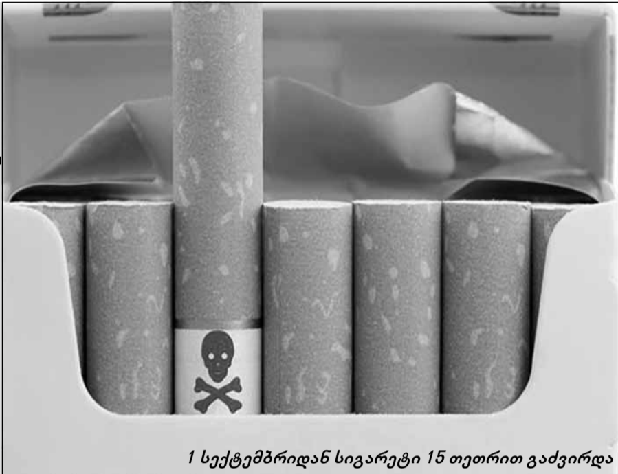
1 სექტემბრიდან სიგარეტი 15 თეთრით გაძვირდა

რაცომ აძვირებს ხელისუფლება სიგარეტს, მიაღწევს თუ არა ამ პროდუქტის მინიმალური ფასი სამ დარს და რა რეკომენდაციების გათვალისწინება მოუწევს მთავრობას?