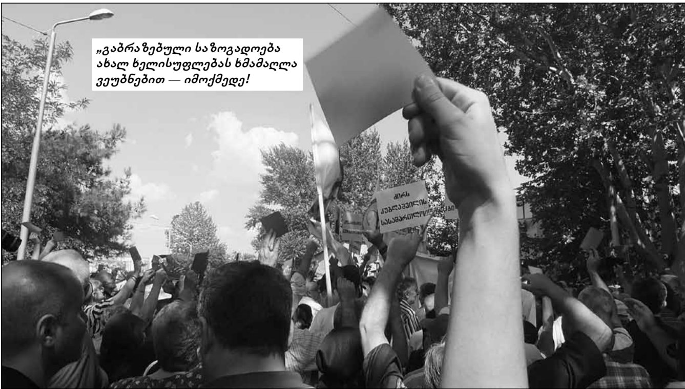
„გაბრაზებული საზოგადოება ახალ ხელისუფლებას წმამლად ვუუბნებით — იმოქმედე!“