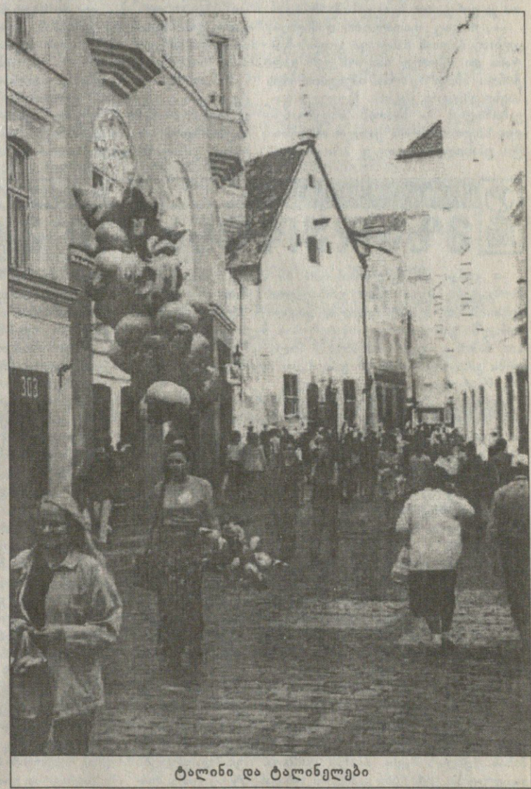
ტალინი და ტალინელები

მეც მაქვს პატარა საცხოვრობი. ამით ვარჩნით გუნდს. ცოტა გვიჭირს, მაგრამ საქმეს ხელს არ გაუშვებთ. პო, საშაკ გვიდგას გვერდში. მასაც აქვს პატარა ბიზნესი. ესტონეთმა, მოგეხსენებათ, ერთ-ერთმა პირველმა დააღწია თავი დიდ მძურ ოჯახს, სსრკ რომ ერქვა. დააღწია და ამით ახლა მხოლოდ სიკეთეს იმკის. პო, ბატონო, ჩვენ რომ ყველაფერი საქართველოდან გავზიდეთ, მაშინ ესტონელები პირიქით მოიქცნენ, საკუთარიც შეინარჩუნეს და სხვისგანაც გამოიღრდნენ. გენბათ, ფერად ლითონებთან დაკავშირებული ამბები გაისხენით. ტალინში ადრეც გახლდით და ამის თქმა თამამად შემიძლია — შენდება და მშენდება ძველთაძველი დედაქალაქი. ცხოვრების დონეს იკითხავთ, ალბათ. ეკონომისტი არ გახლავართ, მაგრამ უბრალოდ არითმეტიკას მოვიშველიებ. მინიმალური ხელფასი აქ 2500 კრონი ყოფილა, რაც დაახლოებით 180 ამერიკულ დოლარს უტოლდება, მინიმალური პენსია 1400 დაუგვიანებელი კრონია (დოლარებში თავად გადაიყვანეთ), კვების პროდუქტებისა და პირველადი მოხმარების საგნებზე ფასები დაახლოებით ისეთივეა, როგორც ჩვენთან. უმუშევრები და მუქთამჭამლები, როგორც ყველგან, აქაც მოიძებნებიან. ოღონდ ნუ შეადარებთ... იუსტ კაცობაში ქუთაისი — ტალინი — ქუთაისი