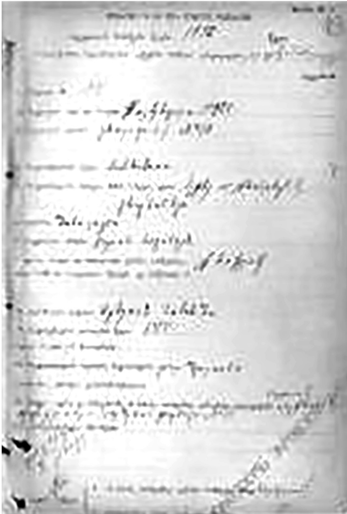
სურ. №4. პეტრე ალექსანდრეს ძე გრუზინსკის გარდაცვალების ცნობა, სადაც მისი ასაკი შეცდომით არის მითითებული – 68 წელი, ნაცვლად 65 წლისა.