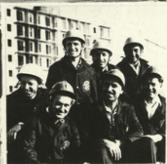
მშენებელთა გვიგარის ხელმძღვანელი სოფილისკვაი შრომის გვიგარის შ. შორე-ბაშა ციკიკვი რიგში გარკვენიან მუიკე-თაიის გვიგარის მშენებთან ერთად.