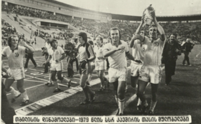
თბილისის დინამოელები—1979 წლის სსრ კავშირის თანის მუღობელები