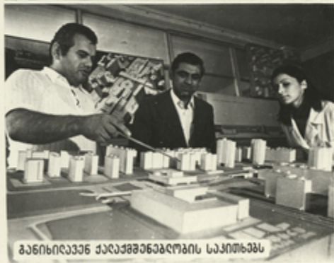
ბანისიკავს ქალაქმშენებლობის საკითხებს