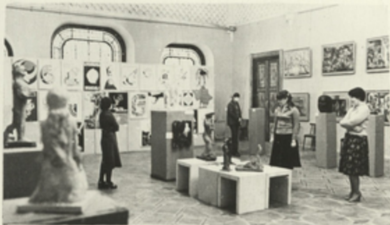
თბილისის სახელმწიფო სახსარგვრო აკადემიის საგამოწავლო დარბაზი