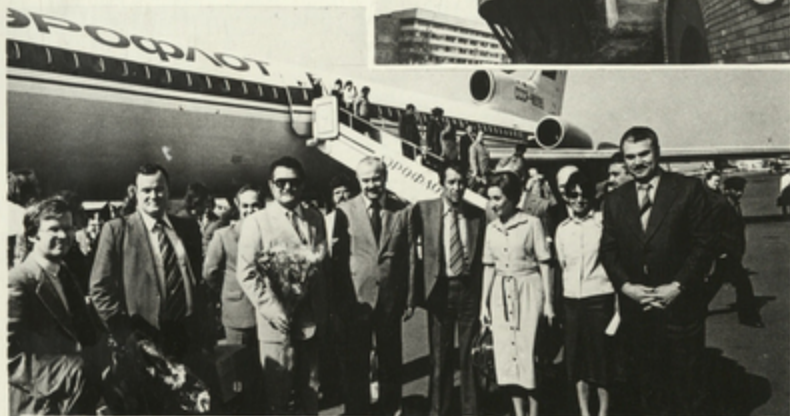
შახარა თბილისის აეროპორტში დაფრთხილებული ქალაქის ნაწიის (საჟანგბათი) დელეგაციისთან