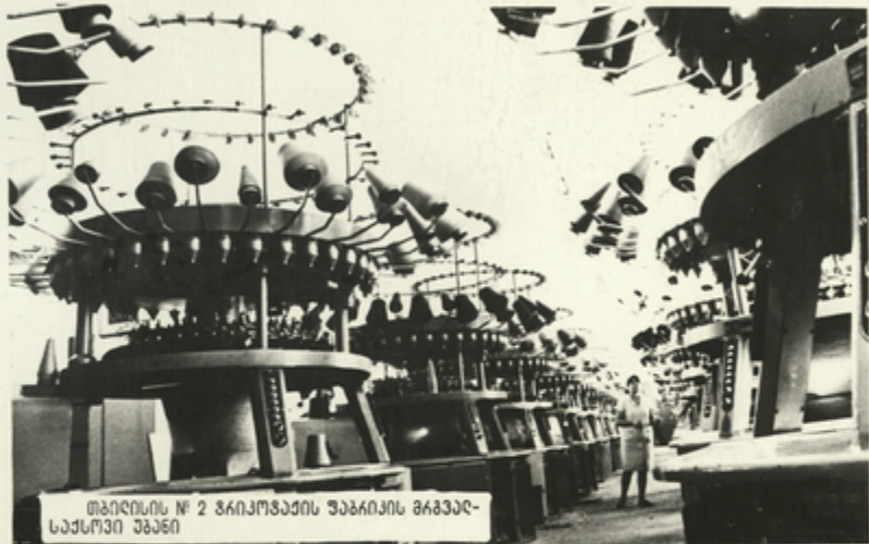
თბილისის № 2 ტექსტილური ფაბრიკის მანქანის მუშაკი

თბილისის გუბათა ქლასი ყოველთვის იღბა ჩვენი ქვეყნის გმირ- გელთა პირველ რიგებში. იყო გვერი თაოსნოვის ნიხითაჲსოვი. რა- გლებიხ გკაჲიოდ გემოხაგავენ ახლებურ. კომუნისტურ ღამოქიღებ- ლებან, შრომისადმი. საზოგადოების ნინაჲ გლგოში ამოხანებინაღმი.