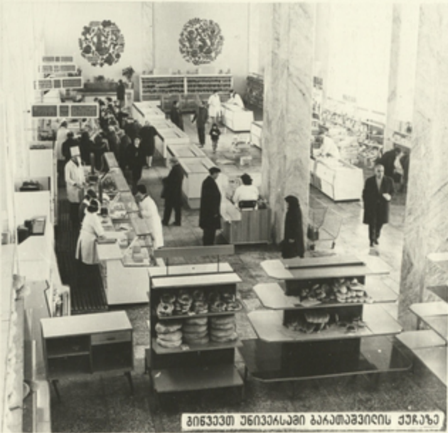
მინავთ უნივერსალი ბარათაშვილის ქარაზა

უარყოფილება რესპუბლიკის დღეაქალაქის მომსახურების სფერო. მთავარი ყურადღება ეთმობა ვაჭრობის საწარმოების, საზოგადოებრივი კვების, საყოფაცხოვრებო მომსახურების, მუშაობის განუხრავლ გეუფჯობასებს, მათი მაგარიული ბაზის განვითარებას.