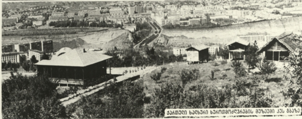
ქართული ხალხური ხელოვნების მუზეუმი ქუჩა გავაზა

რესპუბლიკის დღაქალაქის მუზეუ- მებსა და საგზაგზრო გალერეებში დასუ- ლია ქართული კულტურის საგანძური.