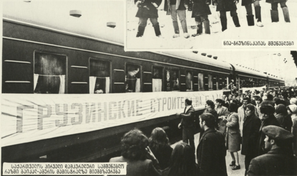
საქართველოს პირველი რამკვაილური საშენებლო კაზმი ბაიკალ-აშურის მგზისგარდაღე მიმგზავიკაბე