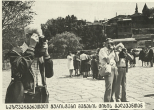
საზოგადოებრივი მედიის ცენტრის მუშაკები მუშაობენ ტურისტების გასართობის მიზნით

ქვეყნის ერთ ერთი უღაგაზუსი ქალაქი—თბილისი ათასობით ჭურისგს იზიდავს. მნახველს აოცხას თანამედროვე არქიტექტურული ანსამბლები. ქველი ხუროთმოძღვრების ძეგლები.