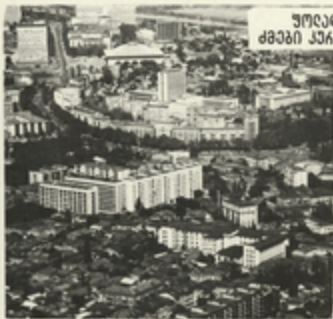
ზოლდთაჯსავსხვლო ქაჩნის მონინავენი- ძვანი კავანიძეანი.