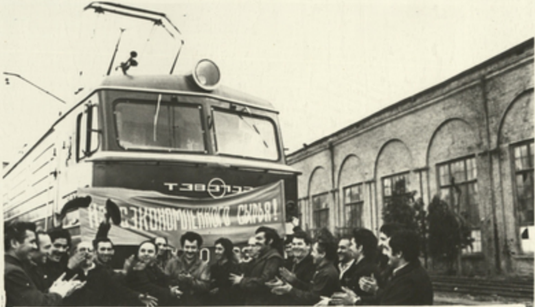
თბილისის საწარმოო ბაზრითაგა „აღმავალბეზანის“ მუხავი აუტიღავენ დაზოგიდი ნე- ღაელითა ღა მასლით აშენებელ ქვებელს