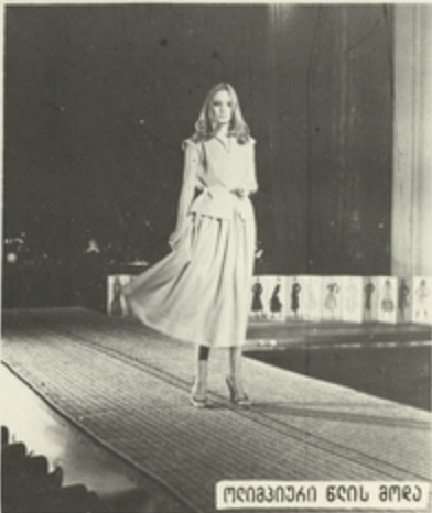
ოლიმპიური წლის მოდა

უარყოფილება რესპუბლიკის დღეაქალაქის მომსახურების სფერო. მთავარი ყურადღება ეთმობა ვაჭრობის საწარმოების, საზოგადოებრივი კვების, საყოფაცხოვრებო მომსახურების, მუშაობის განუხრავლ გეუფჯობასებს, მათი მაგარიული ბაზის განვითარებას.