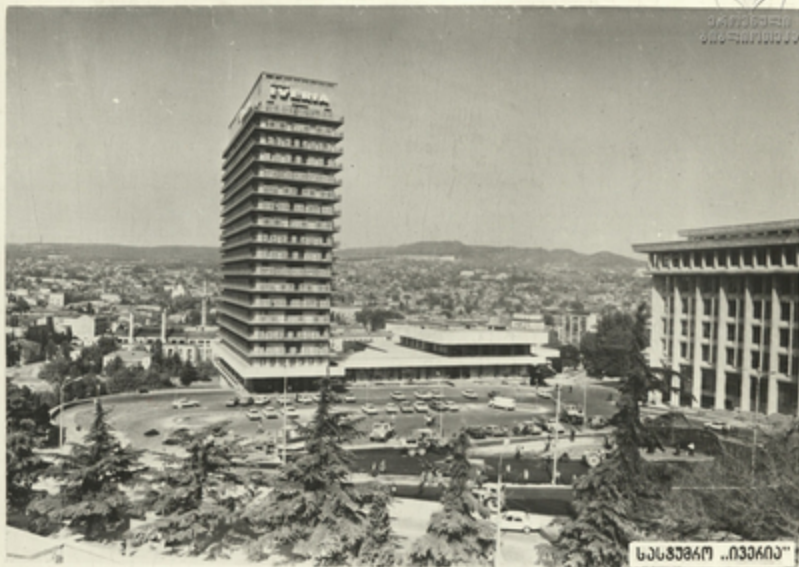
საზოგადოებრივი მედიის ცენტრი „ივერია“