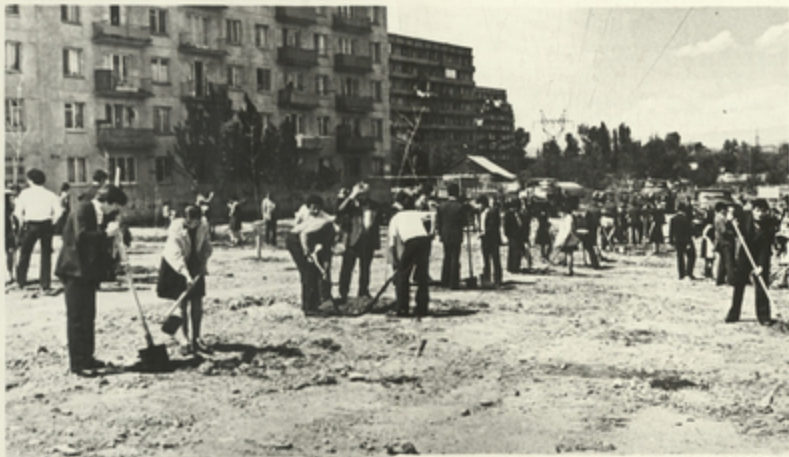
ქირაოს რიონში აგებანან სპორტულია ხეივანს

გაღებულ თბილისი სანიტარულ კომუნალური კულტურის, გრო- მისა და ყოფა-მხოვრების ქალაქად—ეს ჩვენი რესპუბლიკის ყველა მხოვრების ღირსების საქმეა.