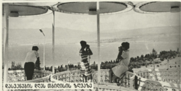
დასვენების დღას თბილისის ზღვაზე