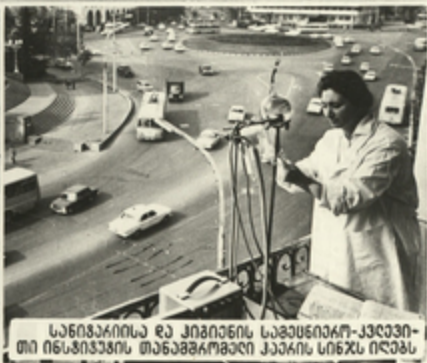
სანიტარისა და კომუნის საბუნდარო-კვარცი- თი ინსტიტუტის თანამხარობელი ქარის სინჯს იღებს