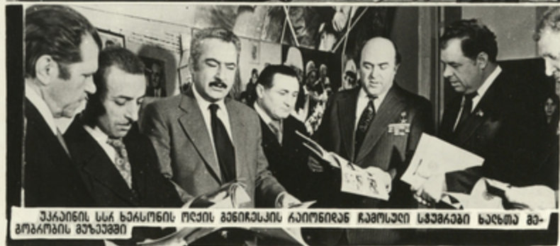
აკაიანის სსკ ხაასონის ოქვის ბენიჩაჟის რეიონიდან ჩამოსული სტუმრები ხელთან გე- გორკოვის მუხებში