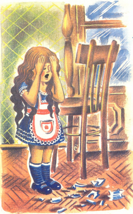
მხატვარი ვახა ქარსული