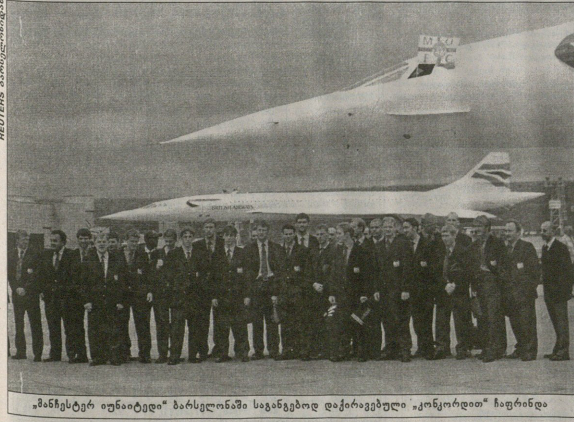
„მანჩესტერ იუნაიტედი“ ბარსელონაში საგანგებოდ დაქირავებული „კონკორდი“ ჩაფრინდა

კბეთს მიუბთ ამიერიდან გაბმიც იმუმაეუმს კოეფიციენტების შესაძლო ცვლილებები ადგილზე დააზუსტეთ