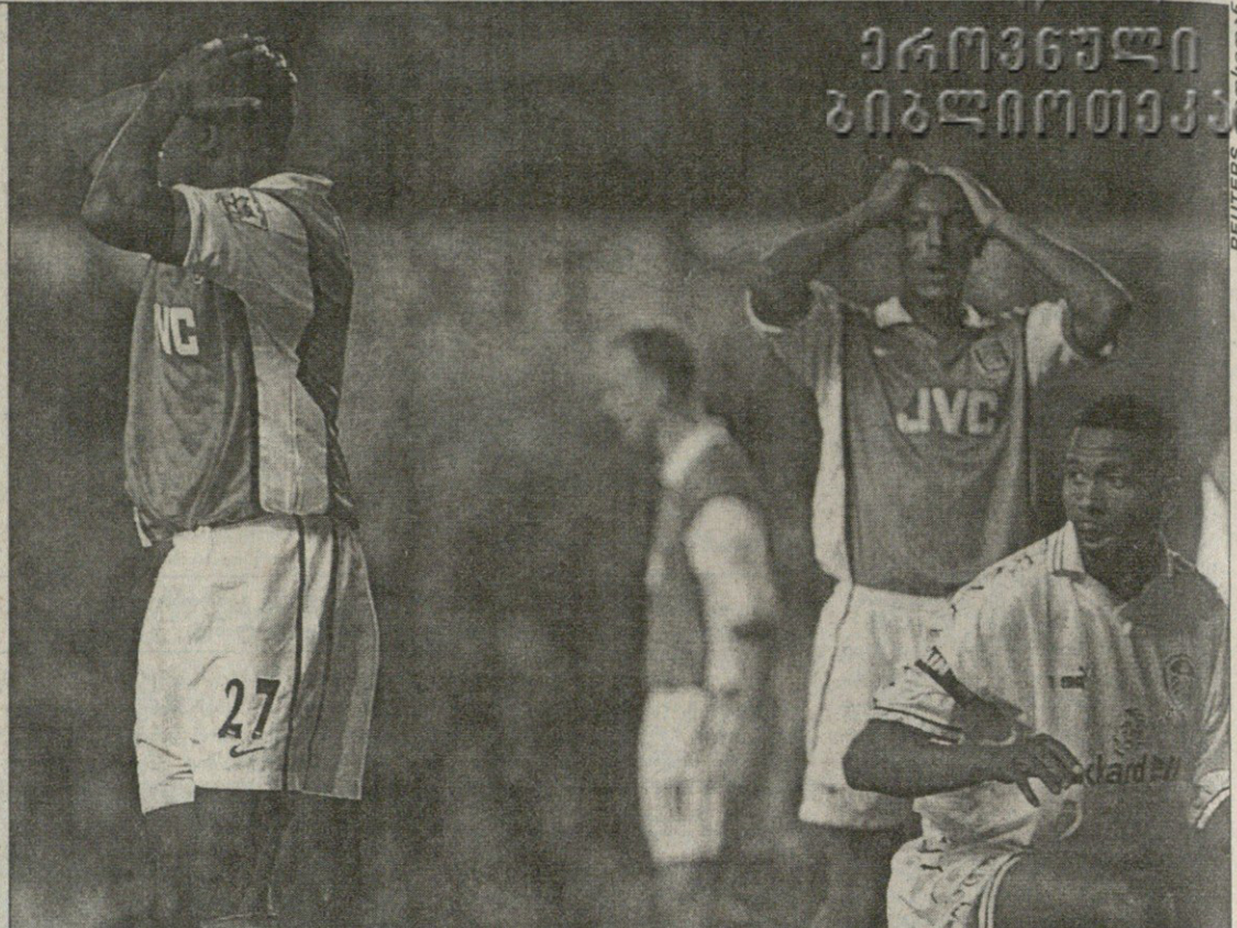
ლიდსი — არსენალი. ლონდონელმა ფეხბურთელებმა დიავარამ (მარტხენი) და ანელკამ თავები ხელი წაიშინეს. შესაძლოა მათ ინგლისის ჩემპიონის ტიტული გაუშვეს ხელიდან