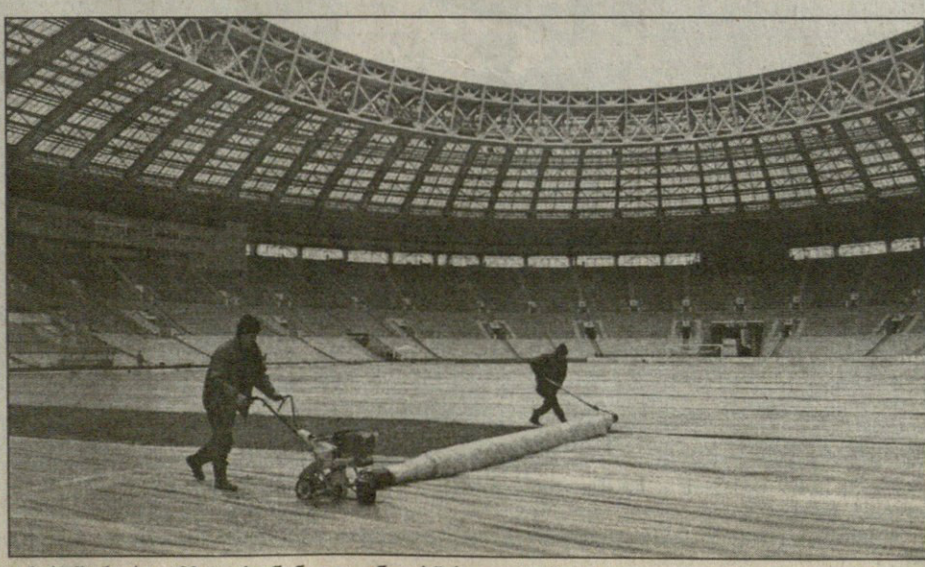
დიდი მატჩის წინ ასე ამზადებდნენ „ლუჟნიკის“ სტადიონს