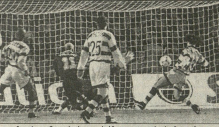
მეოთხედფინალი. ბორდო - პარმა 2:1. ვილტორდის ამ გოლმა ფრანგები 2:0 დააწინაურა, თუმცა ეს მათი ბოლო წარმატება გამოდგა