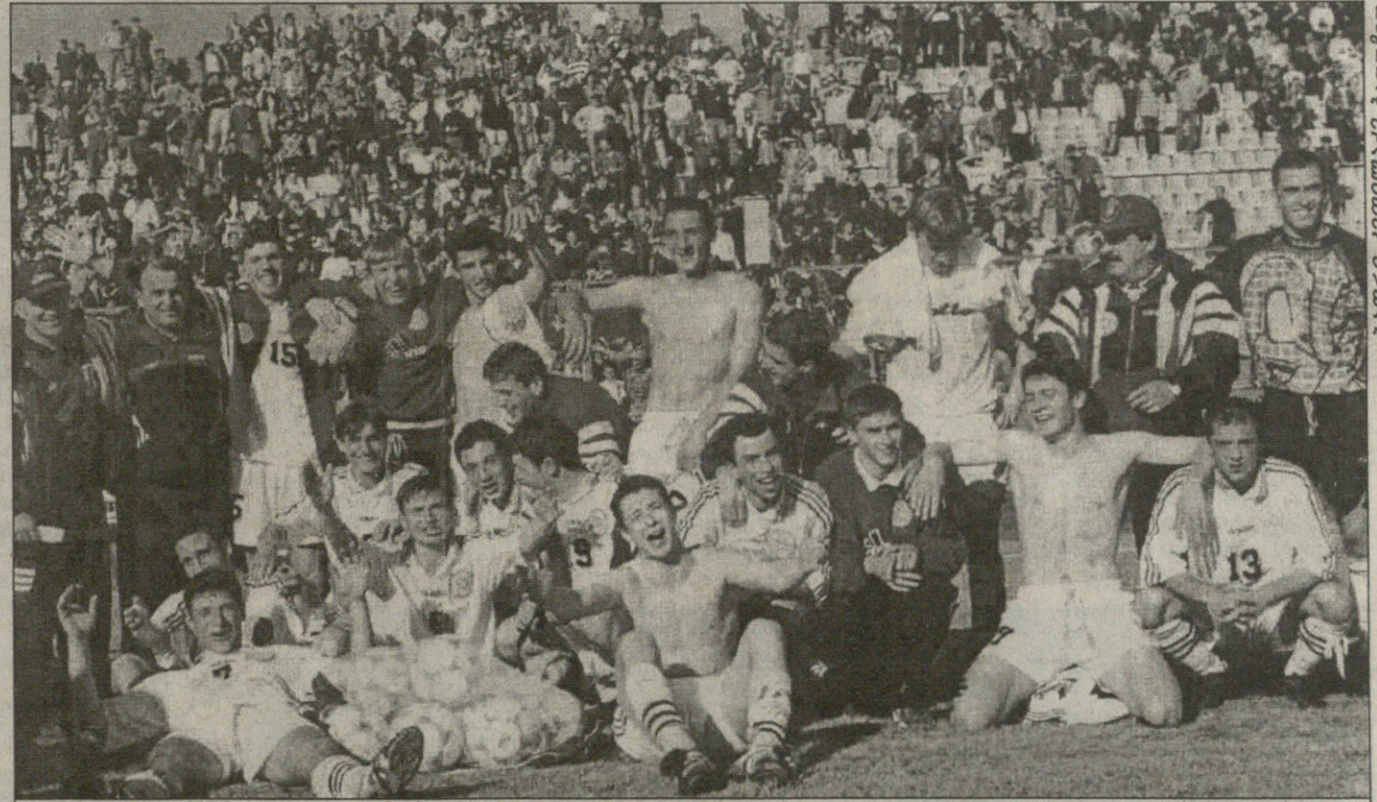
გუშინ ბათუმიში: საქართველოს თრამეტწლამდელთა ნაკრები ჩეხთა 2:1 ძღვეით ევროპის ჩემპიონატის ფინალის მონაწილეა