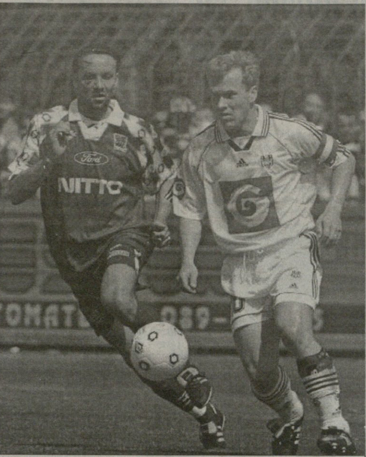
გენკი — ანდერლექტი 2:5. მარცხის მიუხედავად დელბროგის (მარცხნივ) აგენკი ალბათ მაინც გაჩემპიონდება