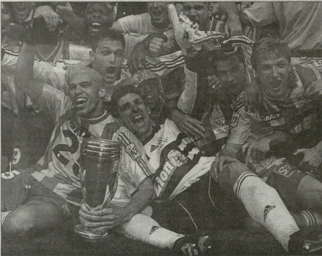
გახარებული ლანსელები ლიგის თასით