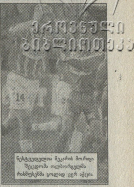
ნესტვედელთა მეკარის მორიგი შეცდომა ოლბორგელმა რასსტუნმა გოლად ვერ აქცია.

... ამ ბოლო ექვს თვეში დანიამი ორჯერ მომიწია ჩასვლამ და ნაკრებისათვის კლუბის ხუთი-ექვსი თამაშიც ვნახე. ამიტომაც ვამლევ თავს უფლებას, ჩემი თვალით დანახული დანიის ფეხბურთი ზოგადად შევაფასო. შარშანწინ დანიის სუპერლიგაში ათი