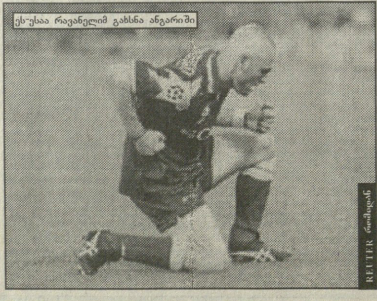
ეს-უსაა რავანელიმ გახსნა ანგარიში