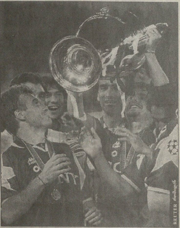
გუშინ „იუვენტუსმა“ მეორედ მოიპოვა ჩემპიონთა თასი იბილეთ მეორე გვერდი

26 მაისს, საქართველოს თასის VI გათამაშების ფინალში ერთმანეთს ხვდებიან: დინამო — ბათუმი