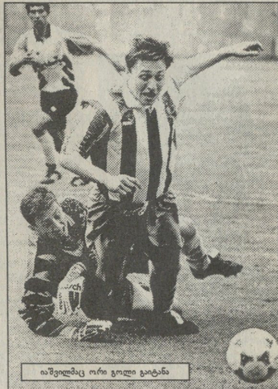
იაშვილმაც ორი გოლი გაიტანა

ბადრი კმთილიაძის ფოტოები წინა მატჩებთან შედარებით, კარგად გამოიყურებოდა ყიზილაშვილი, მან პენალტაც გაანერხა, რომელიც დემეტრაძემ უსუსტად დაარტყა. სტუმრებმა მხოლოდ ერთხელ შეუქმნეს სიფათი ჭანტურას — კაციაშვილმა წინ გამოხულ შეკარგა თავით ბურთი თავზე კი გადაატარა, მაგრამ ააცლია. მეორე ნახევარში შემოსულმა კერეკვაძემ და კიკნაძემ თამაში გამოაცოცხლეს. „დინამომ“ კიდევ სამი გოლი შეაგლო და თამაშიც დასრულდა ლოკალურად ანუ ჩემპიონის რანგში დასრულდა. მამუბა კვანტალიანი