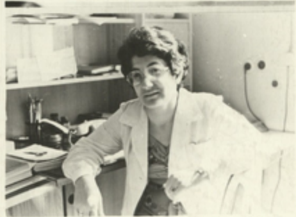
უკრესი გეხნიერული თანაგებებელი, ზეისინის გეხნიერებათა კაბინეტში ჯ. კარგაიკეთმა.