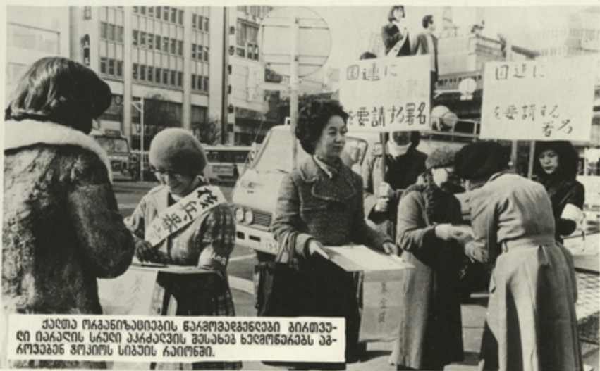
ქალთა ორგანიზაციების წარმომადგენლები გიტყვადი იარაღის სრული აკრძალვის შესახებ ხელშეწყობის აგრძელებას მოქმედების სიგნის ჩაიღონ.