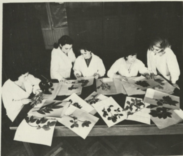
თბილისის ჯეის ინსტიტუტის კარგაიკეთმა კაბინეტში იმეზუპს კარგაიკეთმა.