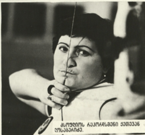
მსოფლიოს ჩემპიონი ქეთევან ლოსაბერიძე.