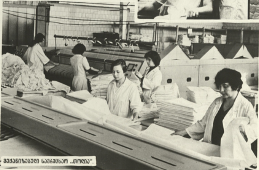
გეგმეობრივი საბრუნო „თოლი“.