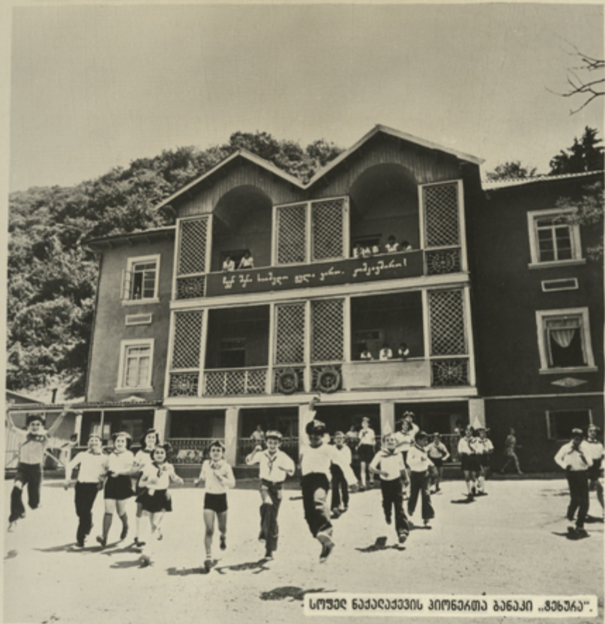
სოფელ ნაქალაქების პიონერთა ბანაკი „განჯა“.

გაერთიანებული ერების ორგანიზაციამ გავშვის სპორტივოსტო წლად გამოაცხადა 1979 წლი. ამ გადაწყვეტილების მთავარი მიზანია მსოფლიო საზოგადოებრიობის ყურადღება მივაპყროს თანამედროვე ბის უმნიშვნელოვანეს პრობლემას—გავშვთა სისოცხლისა და ჯანმრთე- ლობის ღაცვას.