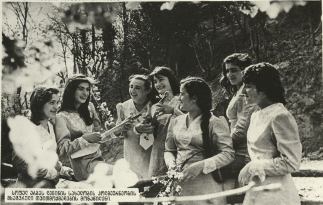
სოფელ ვაკის დანიის სახელობის კოლხეაწროვის მხავარი თვითმავარების მონაწილანი.

სახელმწიფო ანოცხილავს ღონისძიებათა უარყო სისჯავებს, როგელის იხავს ქალ- თა შრომასა და ჯანმრთელოვას, ხელს უწყობს მათი მავარილური და სულიერი მით- ხონილავების დეკავყოფილავს.