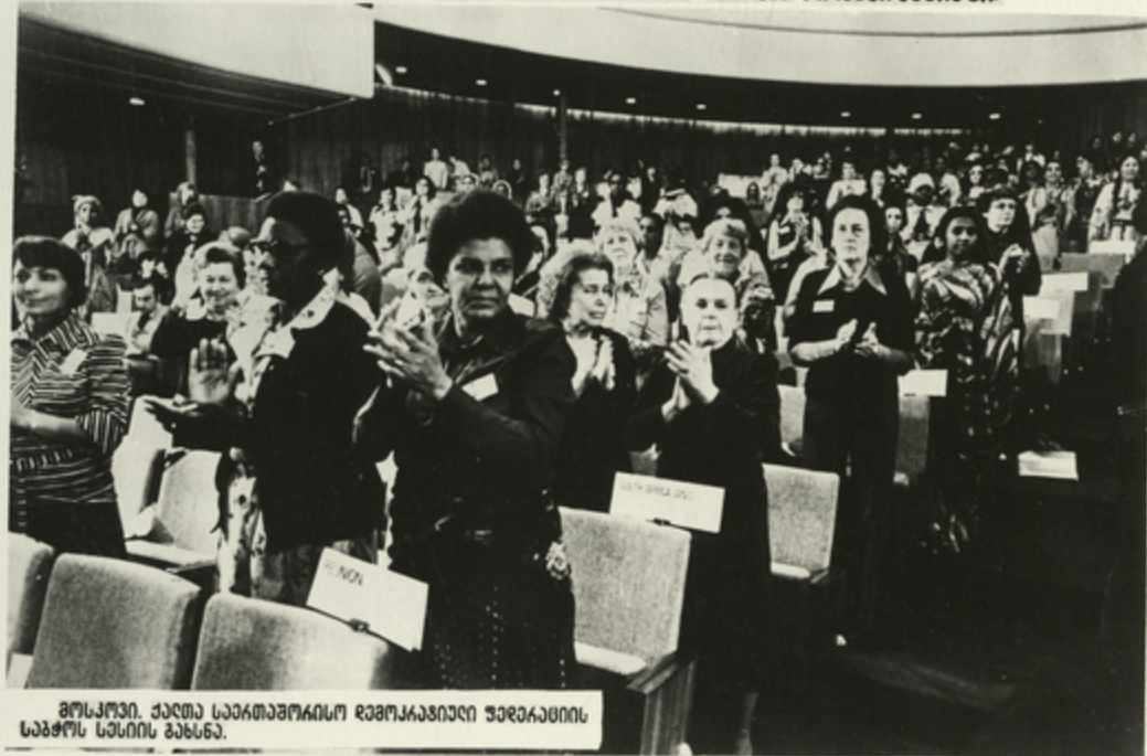
მოსკოვი. ქალთა სავითარებისო დემოკრატიული ფედერაციის საბჭოს სესიის განხილვა.