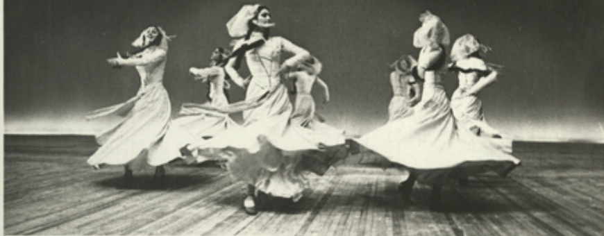
ბაგოლის მუჟიკის სახელმწიფო ანსამბლის „სალხინოს“ მომეჯავე ქალთა გჯუჟი.

უარნარას თუ მუსიკაში. ლიგარაგურასა თუ თეატრში. ხელოვნების შესანიშნავი საფაროს ყველა სფეროში ჩვენი თანამედროვე ქალები ნიჭიერ. გრავალმხრივ ხელოვნებად გვეუღინებინან.