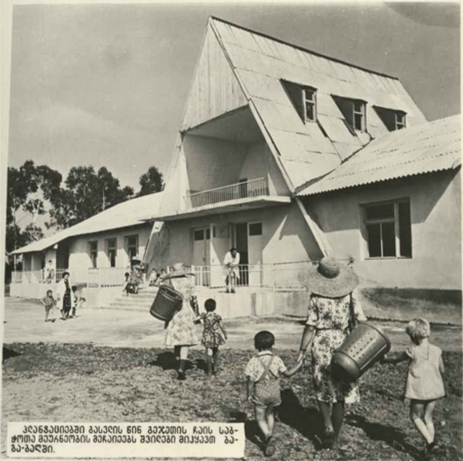
ვლანტინეაფი ბასაღის წინ ბაჯუღის ჩაღის სან- ჭოტა მუარანოღის მარაღივანს შვიღვანი მიქვავთ ბა- ბა-ბაღვი.

სსრ კავშირის ახალი ძირითადი კანონი თვალსაჩინოდ მოწმობს, რომ ქალაქისათვის ზრუნვა სოციალისტური საზოგადოების სანაღმნი- ფო პოლიტიკაა. უხილოვანი კანონია.