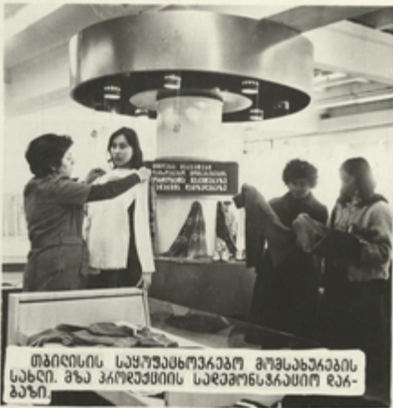
თბილისის საყრუაზროვარებო მუშახარების სახლი. შუა პროდუქციის სარეპონსკრამიტო რეა- განი.

მეცნიერულ-გეგმეობრივი პროგრამის რისი ამსახვეებს ქაღალდის უკრძოვას და აუზარტოვებს მისი საქმიანობის სწავროს.