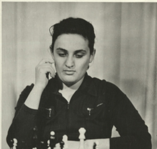
მსოფლიო ჩემპიონი ჭარაქში მინი ჩიბარდანიძე.

საბჭოთა ქალები ექ- ვირალ მონაწილეობენ ქვეყნის სპორტულ ცხოვ- რებაში. მათმა ოსტაგო- ბამ საქვეყნო აღიარება მოიპოვეს.