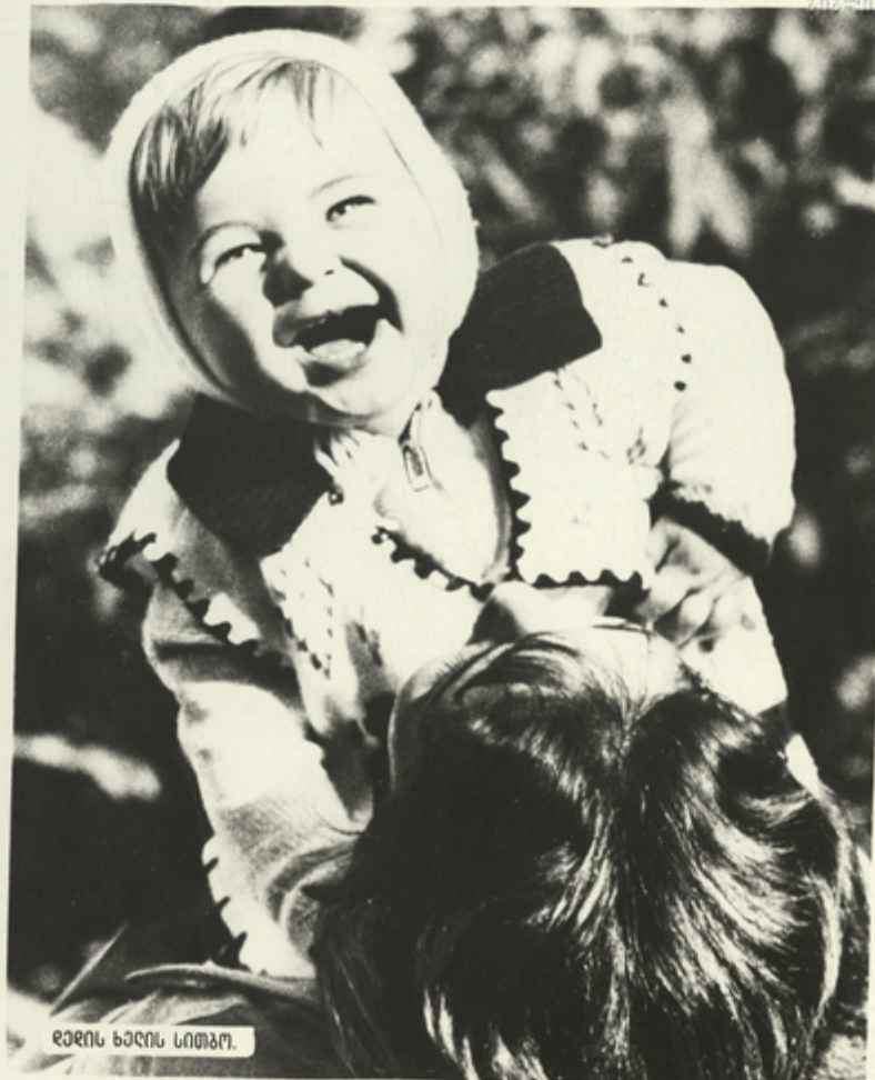
ღელის ხალის სიტყვა.