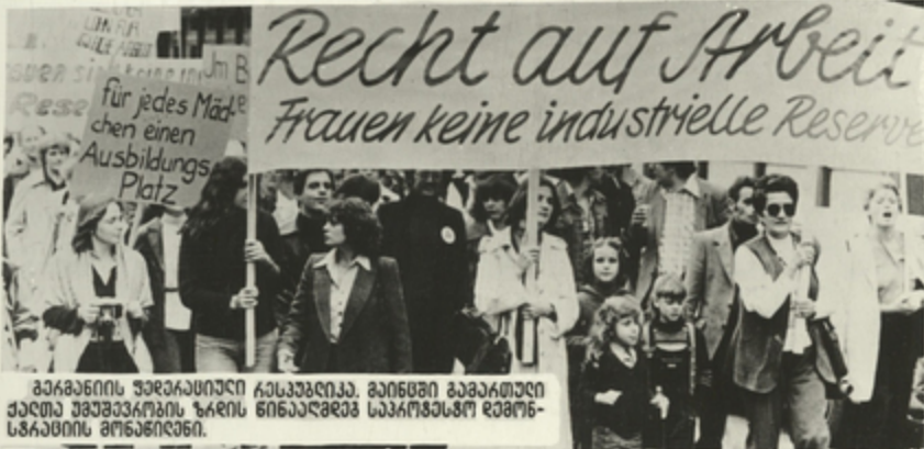
გარდასული წლებისათვის კანკაბელია, გინდში გარდასული ქალთა მუშაობისთვის ზრის ნინაღმდეგ საკრძანებო დემონსტრაციის მონაწილე.

საერთაშორისო მშრომელთა კავშირთა ფედერაცია