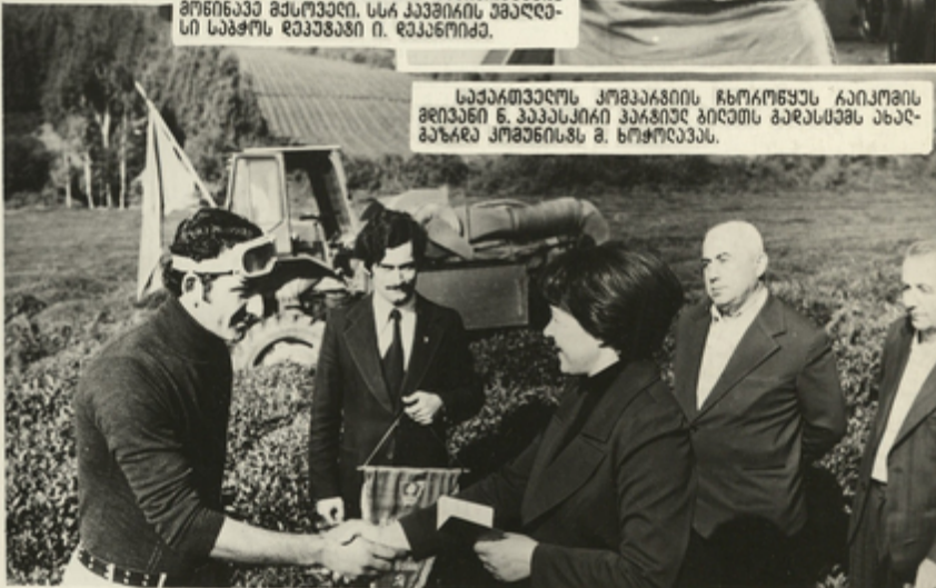
საქართველოს კოგეაგირის ჩოროწყეს რეკოგირი ბიღანი ნ. კეკესკირი ვაკიღელ გიღთს ბაღესთეს ახალ-ბაზრელ კოგენისს მ. ნოჭოღეას.