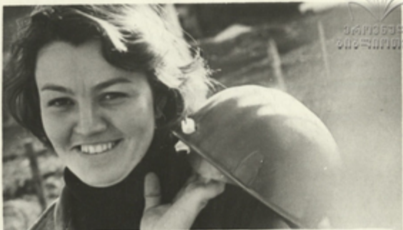
ჭიათურის მანგანუმის საბთაბარემო კომპინატის დანიინის სა- ხალუმის მალარტოსამმარტოვალის მონინაბა მვლის ხალმქალაბალი თ. დაბაბა.

გეგმარულ-გეგმი- კური პროგრამის აგუ- ბუქებს ქალთა შრო- მის და აუარტომებს მათი საქმიანობის სწავროს.