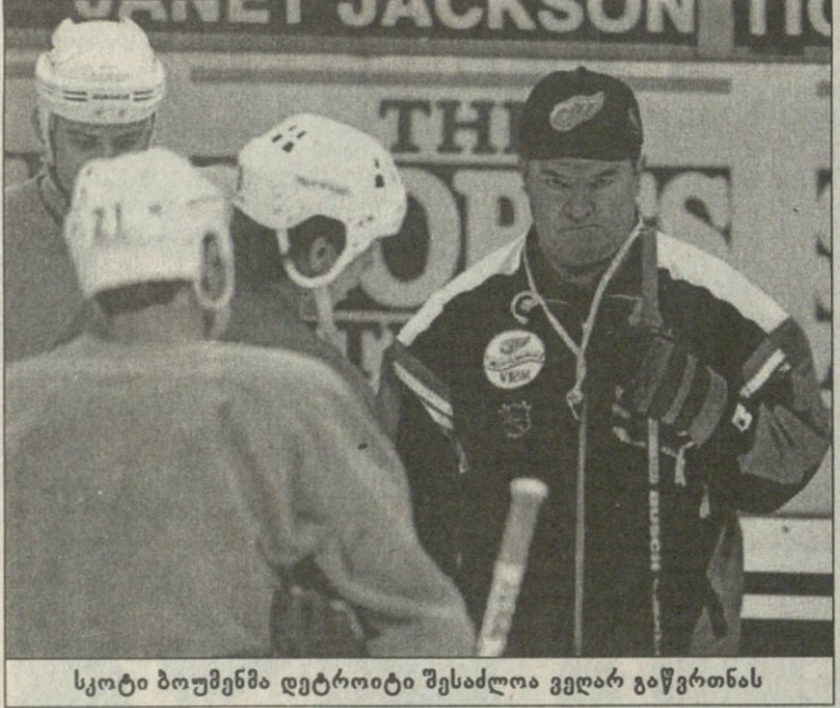
სკოტი ბოუმენმა დეტროიტი შესაძლოა ველარ გაწვრთნას

ფინიში — ოტავეა 1:4, 0:1, 0:2, 1:1 0:1 დაკელი 9'06 (1); 0:2 ბონკი 23'47 (1); 0:3 გარდინერი 25'53 (1); 0:4 არვედსონი 40'12 (1); 1:4 რენკი 49'14 (1). საკმარე მოულოდნელი ორ-ორი გამარჯვების შემდეგ ფლორიდა და ოტავეა ოტავეა ფილადელფიასთან ერთად ინაწილებენ ლიდერობას.