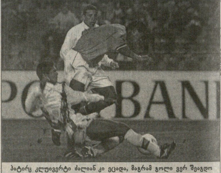
პატრიკ კლუივერტი ძალიან კი ეცადა, მაგრამ გოლი ვერ შეაგლო

პრინციპში, გვაქვს საიმისო საბაბი, რომ კმაყოფილები ვიყოთ — თქვა შეხვედრის შემდეგ პოლანდიის ნაკრების კაპიტანმა, ფრანკ დე ბურმა — პირველ ტიამში კარგად დაიწყეთ, ოღონდ მერე დაუდევრობა მოგვერია. სამაგიეროდ, შესვენების შემდეგ ვითამაშეთ კარგად, თუმცა ზოგადად უკეთესად შეგვიძლია.