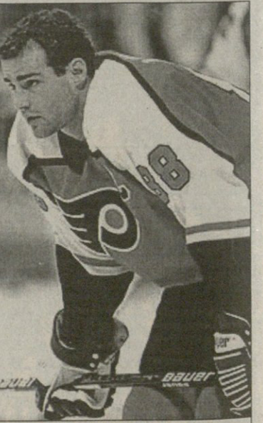
ერიკ ლინდროსისგან წელსაც სასწაულებს ვლიან

ვატულ კლუბში, როგორც ნიუ ჯერსია, თავის გამოჩენა გაუჭირდება. თანაც, მას სერიოზული კონკურენტები ჰყავს: საგამოფრეო მატჩებში გამოჩენილი ალექს ტანგეი, მილან პიიდევი, კრის დრუი (ყველა — კოლორადო), დანიელ ბრიდი (ფინიში), მარკუს ნილსონი (ფლორიდა), მაიკ მანელიუკი (ფილადელფია), დანიელ კლირი (ჩიკაგო), პეტერ ნორდსტრომი