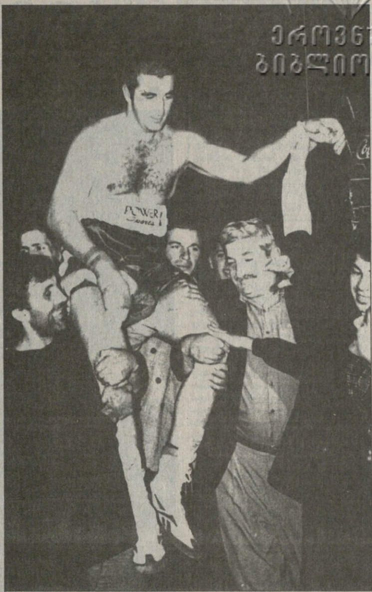
პირველები ვინ აიტაცებდნენ ხელში გიორგის? რა თქმა უნდა, ვარიანტები!

ერთი ეს მითხარი, კანდელაკთან კრივობის ამბავი როდის გაიგე და რამდენად მოულოდნელი იყო შენთვის?