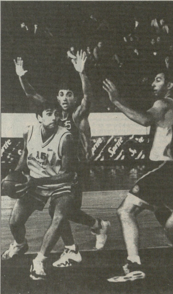
ვითელი ჩუბინიძე ჩხეიძისა (15) და მაჭარაძის ხაფანგში