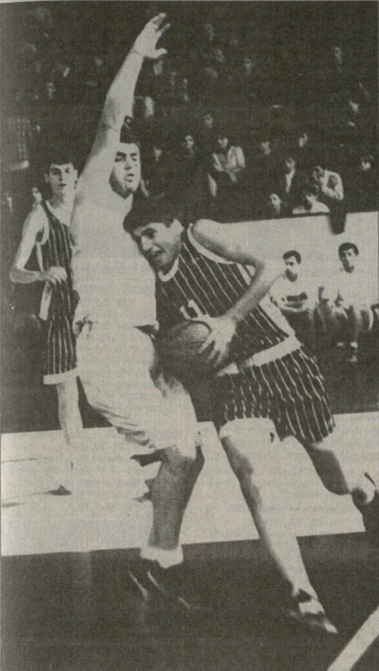
სტუდენტური ჯახი: მარჯომიწვილი (ბურთით) ნაცვლიშვილის წინააღმდეგ