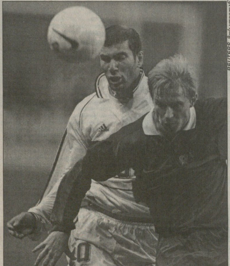
„პარი სენ ჟერმენის“ ნახევარმცველმა იგორ იანოვსკიმ ზიდანს ზიდანს (№10) წინიდანაც მოუარა, უკინიდანაც, მაგრამ ვერაფერს გახდა

იური ციბანიოვი მოსკოვიდან საინფორმაციო ანალიტიკური ბიურო „გამა“ საგანგებოდ სარბიელისთვის