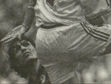
ზიდანს ჭეგრჭერობით საფრანგეთში გოლი არ გაუტანია. რა მოხდება დღეს?