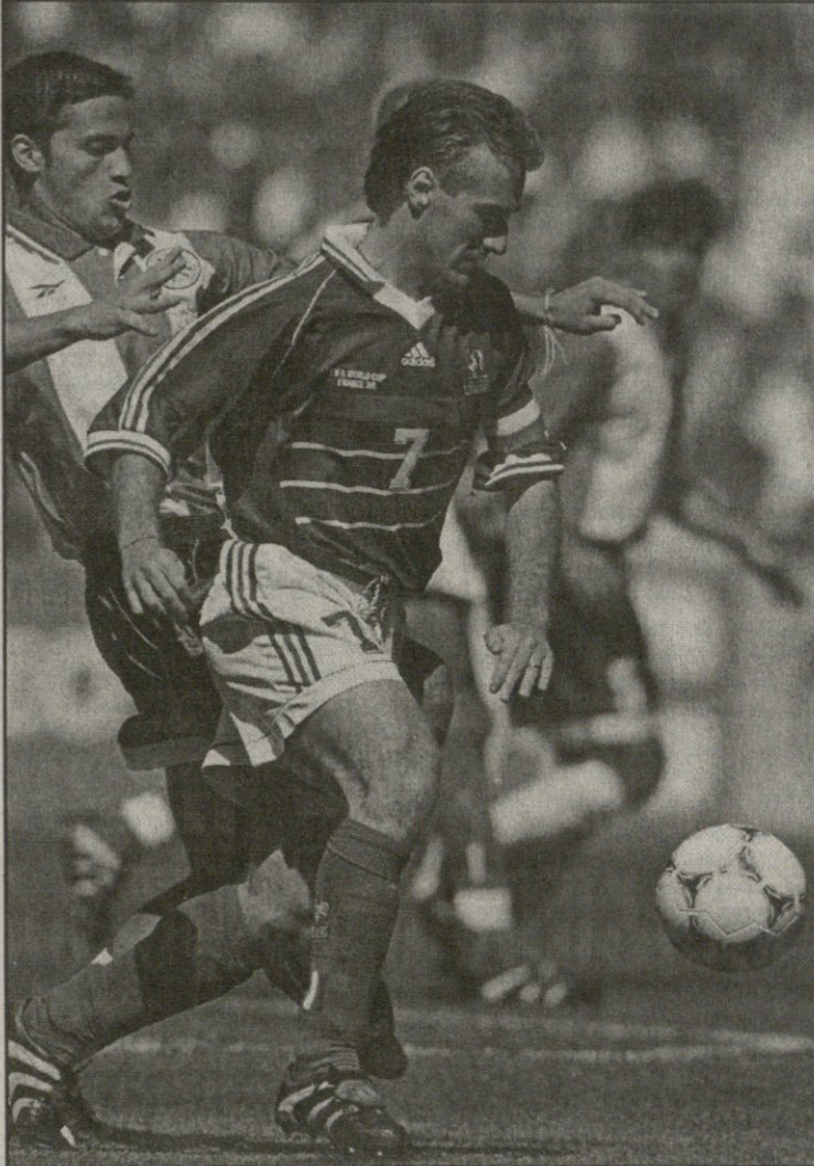
დიდი დეშამპის მსოფლიოს თასი უკვე სათავისოდ შეუგულეობია