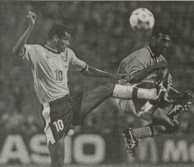
რივალდო წინა შეხვედრებში მეტოქეებს შიშის ზარს სცემდა