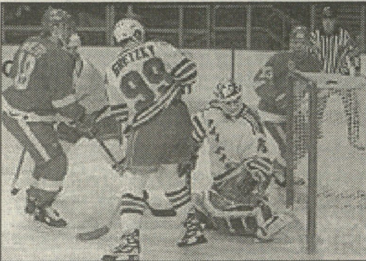
რეინჯერსი — დეტროიტი. კირკ მოლტბის (მარცხნივ) პირველი გოლი

შაიბები: სავარი 1 (0:1), სუნდსტრომი 0(2), დეიგლი 13 (1:2), სილინჯერი 16 (2:2), ბრინდამორი 31 (3:2), გრეცკი 19 (3:3), კლიტი 12 (4:3), გრეცკი 20 (4:4), პოდინი 9 (5:4)