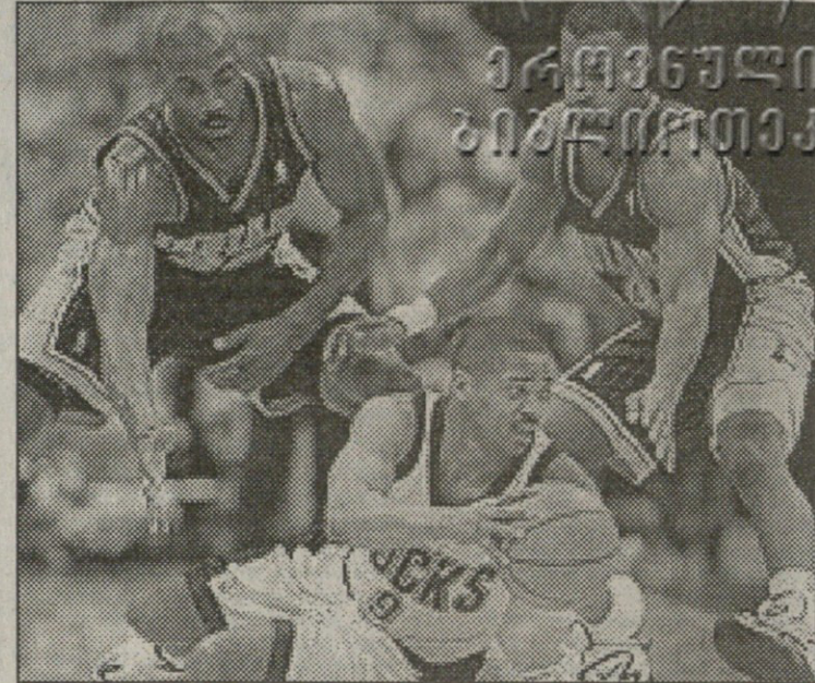
მილუოკი — ინდიანა. მილუოკელი გრინი ალყაში მოუშვედევით

ორვე გუნდი კბლებით იბრძვის პლეი ოფის საგზურის მოსაპოვებლად და ეს შეხვედრაც დამაბუღლად წარიმართა. ვა-