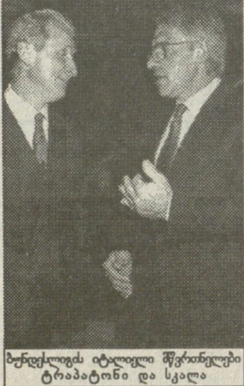
ბუნდესლიგის იტალიელი მწვრთნელები ტრაპატონი და სკალა

ვტყობა, ბუნდესლიგაში უცხოელი მწვრთნელების მომარაგებამ ადვილად ჩვენი კოლეგები „შპორტ-ბილიდინგს“ „მბოროლად ასე ცუდები არიან გერმანელი მწვრთნელები, რომ მშობლიურ კლუბებში აღარ იწვევენ.“ — წუხან ჟურნალისტები. ბუნდესლიგა გერმანელი მწვრთნელების ნაკლებობას ნამდვილად არ განიცდის, მაგრამ ფაქტია: ჩემპიონ მიუნხენის „ბაიერნს“ იტალიელი ჯოვანი ტრაპატონი წვრთნის, ჩემპიონთა თასის გამარჯვებულ ლორტმუნდის „ბორუსიას“ — მისი თანამშაბეული ნეოლი სკალა, უფასო თასის მფლობელი „შალკე 04“-ს კი — ჰოლანდიელი ჰუბს სტევენსა. ისეთი ძლიერ კლუბებს, როგორც ლევერკუზენის „ბაიერი“ და „შტუტგარტა“, გერმანელი მწვრთნელები რომ შემოიჩინა, ნამდვილად შემთხვევითობაა, რადგან ორივე კლუბის თავკაცობას უცხოელის, კერძოდ, სკალას ვადამობრება სურდა. ბუნდესლიგაში მობიზებზე, იტალიელი მაღალ ანაზღაურების თხოვნის. შტუტგარტელთა მენეჯერმა მანფრედ შვეერმა