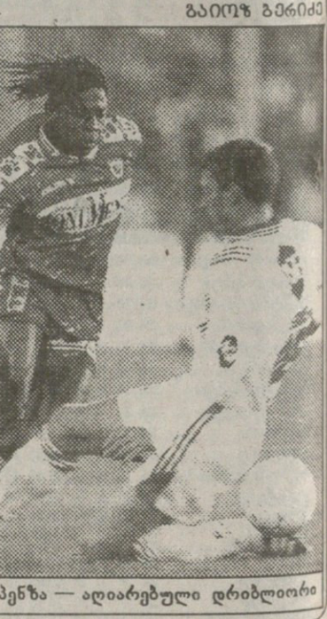
ლოკონდა მენზები — აღიარებული დრიბლიორი

ლოკონდა მენზები ბელგიის გაურკვეველმა საფეხბურთო კანონებმა და გაქნილმა ადვოკატმა უნდოდა მისონმა მისცა. მისონი ის კაცია, ბოსმანს რომ იცავდა როველუკურ პრეცედენტებზე ფეხბურთელების გაათავისუფლება და კლუბების გულსწყობა რომ მოყვა.