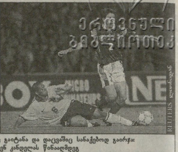
რობერტო კარლოსმა ულამაზესი გოლიც გაიტანა და დაცვაშიც სანაქებოდ გაირჯა: რობერტო კარლოსი და ვინსენ კანდელას წინააღმდეგ