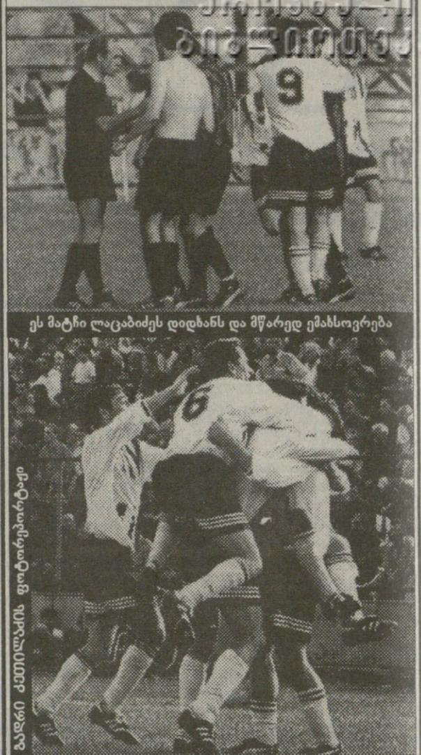
ეს მატჩი ლატვიის დინამოს და მწარედ ემასსოვრება