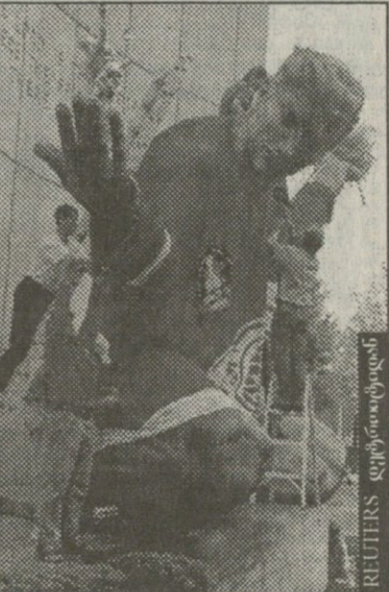
დეტროიტის მცხოვრებელ ემეიც ალარ ეპარებათ თავისიანების წარმატებაში და ქალაქში მდგარ ძველს „დეტროიტის სული“ წითელფრთიანთა მისიური ჩამოატყვეს