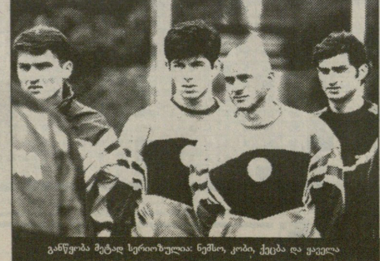
განწყობა მეტად სერიოზულია: ნემსო, კობი, ქეცბა და ყაველა