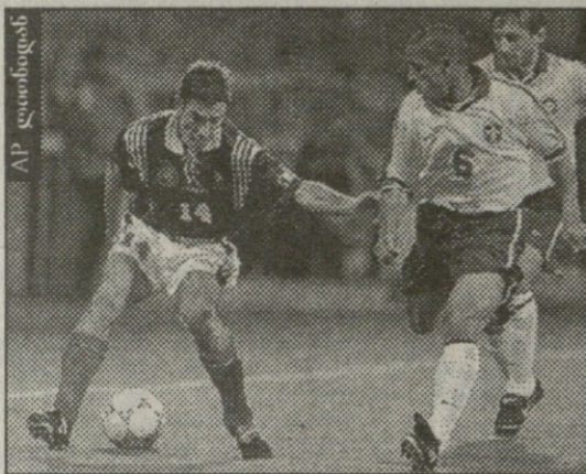
რობერტო კარლოსმა ულამაზესი გოლიც გაიტანა და დაცვაშიც სანაქებოდ გაირჯა: რობერტო კარლოსი და ვინსენ კანდელას წინააღმდეგ

ბრეზილიმ აღნიშნა, რომ საქართველოს ფეხბურთის მდგომარეობა არაა სასიამოვნო. მან აღნიშნა, რომ საქართველოს ფეხბურთის მდგომარეობა არაა სასიამოვნო. მან აღნიშნა, რომ საქართველოს ფეხბურთის მდგომარეობა არაა სასიამოვნო.