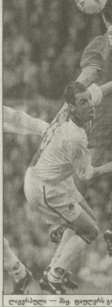
ლივერპული — სსე. ფაულერის გოლის გატანაში ხელი გვრ შეუშალეს