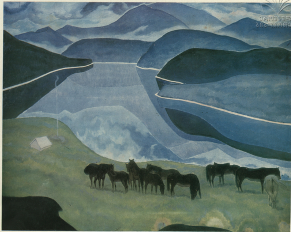
Ն. Բ. ՄԽԱՉԱՏՐՅԱՆ «ՍՈՒՆԻ ԳՐԻՍՏ»