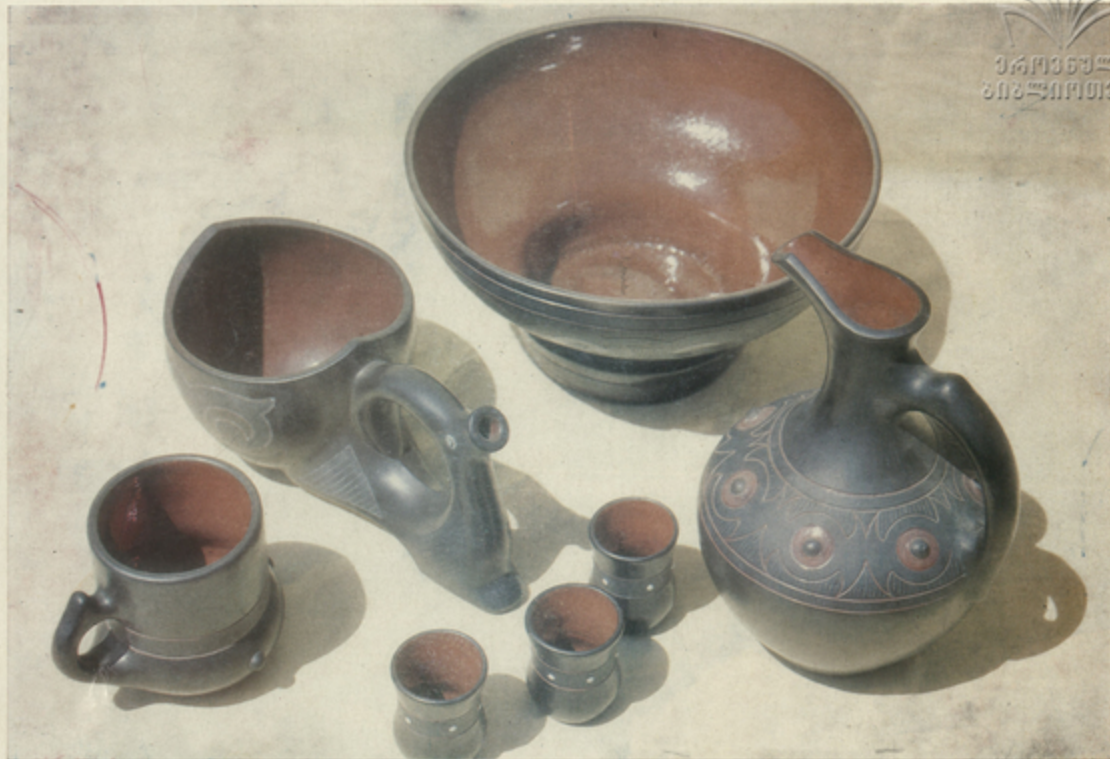
პ. ბ. ნიშნავაძის მიერ დამზადებული