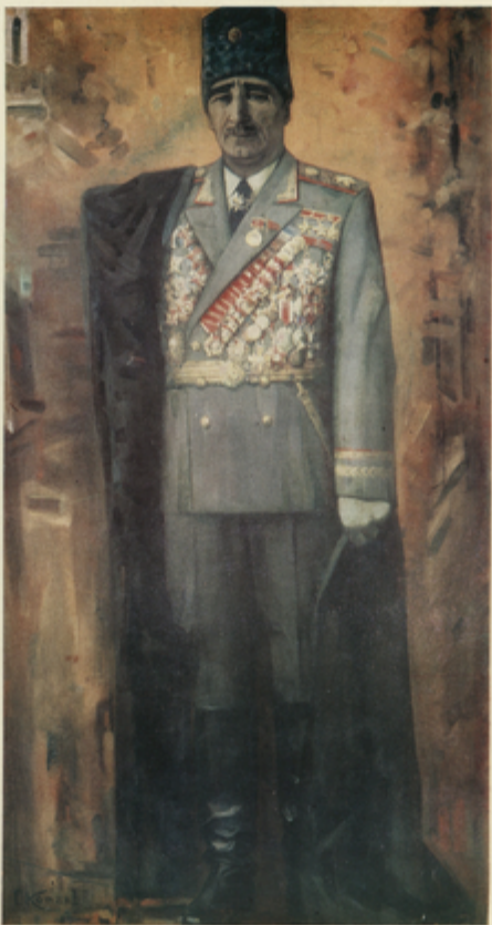
Հ. Խ. ԽԱՏՅԱՆ - «ԳՆՆՈՒ ԽՈՒՄԻՆԻՍՏԻ» ԽՈՒՄԻՆԻՍՏԻ Գ. Ս. «ԽՈՒՄԻՆԻՍՏԻ»