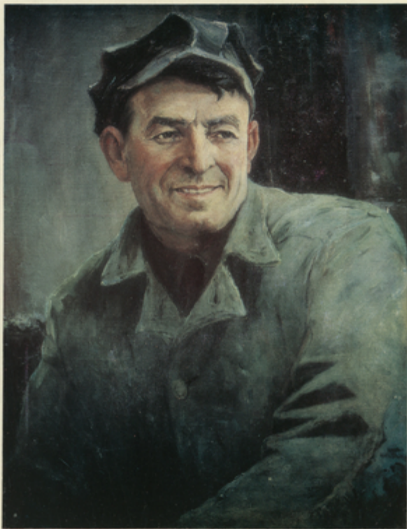
Լ. Կ. ԿՆՆԻՆԿՆԻ «ԳՆՆԱԳ ԿՆՆԱՐ»