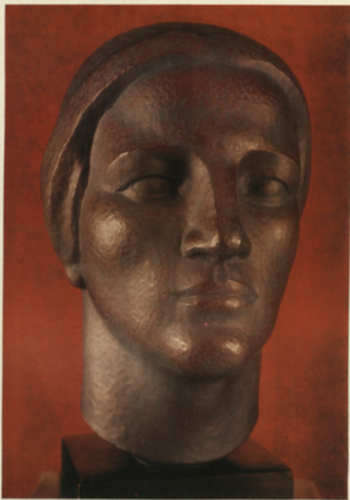
Հ. Խաչատրյան «Մարտի զոհուհի» Յուսկանյան Պ. «Մարտի զոհուհի»