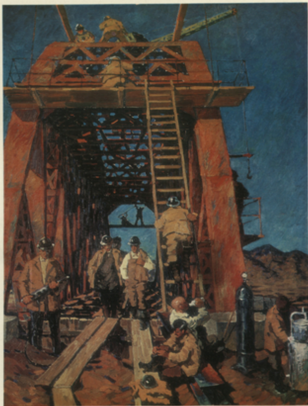
Մ. Նիկոնիսի «Գործը» Լադիսլավ Ս. Ստոյան.