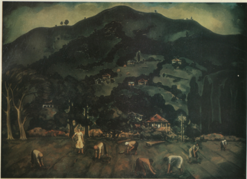
ქ. «სოფელი» «სოფელი»