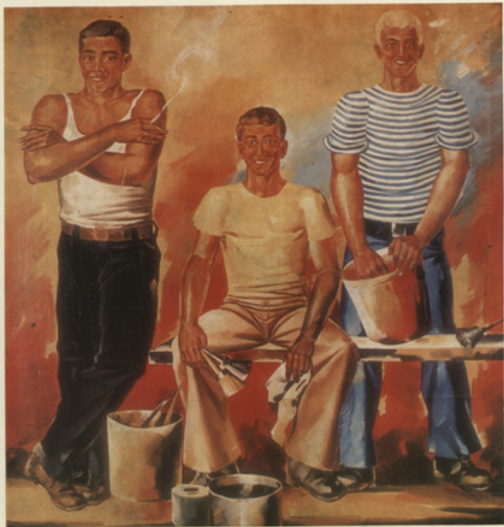
«ՄԱՍՊԱՐ» Կարտինգ Է. Կարտինգ