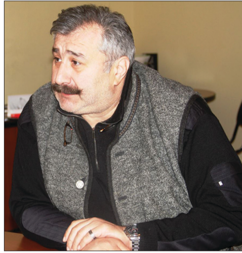
დაზარალებულ მოსახლეობას გარკვეული დახმარება გაუნია, გვესაუბრეთ ამის შესახებ.

განახლებულმა ინფრასტრუქტურულმა სამსახურმა ბოლო პერიოდში საკმაოდ დიდი მუშაობა გასწია. დავასრულეთ სტიქიის შედეგების ლიკვიდაციის სამუშაოები. მოგესწინებთ, გამგებობამ 11 ახალი სახლი აუშენა ბენეფიციარებს, ვისი საცხოვრისიც გამოუსადეგარი იყო შემდეგი ექსპლუატაციისათვის და ძირითადად აქცენტი გაკეთდა სოციალურად დაუცველ, შეჭირვებულ ფენებზე, მრავალშვილიან ოჯახებზე. სამუშაოები ახლახან დასრულდა და მიმდინარეობს მიღება-ჩაბარება. შენობების გარკვეულ ნაწილს სახურავები შეუკეთდა, ეს პროექტიც შეიძლება დასრულებულად ჩაითვალოს. უახლოეს პერიოდში გვეგმავთ ქალაქის ცენტრში არსებული ორი დიდი მოედნის რეაბილიტაციას.