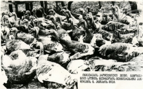
მხრავანს კარინიისი ხით, მარინო- ვისი სტრინს მარინოვების მისინარეღახის კარინის & კარინის მთა

საქართველომ ძალადებინა და კერძოაზიის მოსახლეობის უკიდვარი და კვახებით მოხარავების საკითხს ნარავა- ბით წყვავან სავსიანიწავლი საჭოთა მარინოვების მ- ბაკვი. ისინი მისინარ-მეუკიდვარი და კონსკვამრ-მ- მინიწამრთ მისინარე კვირმარეღახის იწინებან.