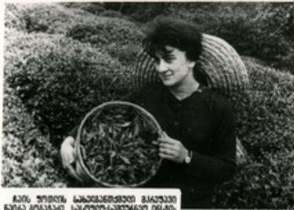
ჩინის უზონის სანჯიანდონის მკვლევარი დავით ბრეზანო სანჯიანდონის სანჯიანდონის მკვლევარის დახმარებით მკვლევარ დავით ბრეზანო სანჯიანდონის მკვლევარის დახმარებით მკვლევარის დახმარებით

ჩინ-საქართველოს ნახევანი კვლევა- ჩინი ჩინური სანჯიანდონის 97 კვლევას აწარმოებს. ამ კვლევას მოყ- ვანის ამოცანებია დამუშავებული ანა- სტორი ჩინისა და სანჯიანდონის კვლე- ვების საკვანძო სახეობის კვლევითი ინსტიტუტის კვლევითი შიდა კვლევითი კონსტრუქტორის ჩინის ვალდებულებ- ითი დივიზიონის დახმარებით, რომელიც დახმარებით დაიწყო ნახევანში.