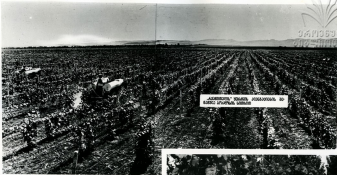
„ჯანთბოთის“ ყვარლის კარგაბიძგის მ- ხარეა სურსის სობის

ყვარლის უსოფით ჯიბიდან, კოშეღის ჩვენს ანკაბ- ღიკაში ხაკოზს. მისინიკაბა საბარევეღო ნაკოშინსა- თვის 50 საკკეთესო მუარჩიუნს. ზაკთოგის მნიშვნეღმუ- ნი ნანიღი მანკუთვნიღია ლვინისა და მუბკანუაღის ჯი- შეღისათვის. სოზის ყვარენი ბაკაბენის საბჭოთა მუარ- ნეოგებს მოყავთ.