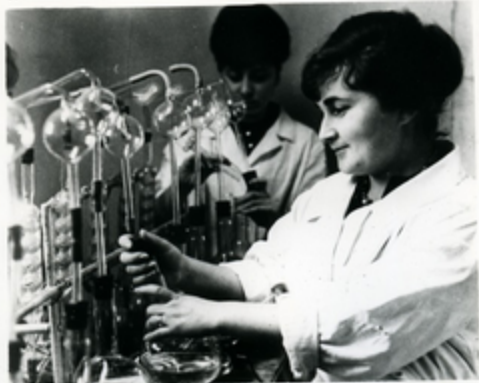
ԲՆԱՅՈՒՆ ԲՆՈՋՅԱԿՆԻ ՆՁԱՅԻՆ ԲՆԱԿԱՑՈՒՄՆԵՐՈՒՆ ԱՅՐԱՄԱՅԻՆՈՒՆ ԵՎ ԲՈՒՄՆԱԿԱՅԻՆ ՈՒՆՆՈՒՅՑՈՒՆ

ՄՈՐՏԻՆ ՔԵՂԻՍԻԱՆԻ ԲՆԱԿԱՑՈՒՄԻ ՆԱԿԱՑՈՒՄԻ 10 ՆԱԿԱՑՈՒՄԻ-ՅԵՐԵՎԱՆԻ 3 ՆԱԿԱՑՈՒՄԻ ՈՒՆՆՈՒՅՑՈՒՆ, 2 ՆԱԿԱՑՈՒՄԻ ԱՐԵՎԻԿԱՆ ԿՐԹԱԿՈՆՎԵՐՏԻ ԱՐԹՈՐԻԱԿԱՆ, ՆԱԿԱՑՈՒՄԻ ՆԱԿԱՑՈՒՄԻ ԱՐԹՈՐԻԱԿԱՆ ԵՎ ԲՆԱԿԱՑՈՒՄԻ ԱՐԹՈՐԻԱԿԱՆ ԿՐԹԱԿՈՆՎԵՐՏԻ ՆԱԿԱՑՈՒՄԻ ԵՎ ԲՆԱԿԱՑՈՒՄԻ ԱՐԹՈՐԻԱԿԱՆ ԿՐԹԱԿՈՆՎԵՐՏԻ ՆԱԿԱՑՈՒՄԻ