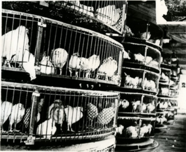
მარინოვანს 15 სარინის მარინოვანის