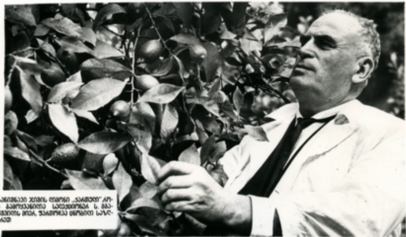
საქართველოს ჯიშის მარცხენი „საბჭოთა“ მარცხენიდან მარცხენიდან ს. მ. მარცხენიდან მარცხენიდან ს. მ. მარცხენიდან მარცხენიდან

საქართველო სივრცისთვის უძველესი ყვავილენი მცენარეა მანათლიანი ხეობები. მისი დაბალია და მისი მარცხენიდან მარჯვნივ, დიდი, ზოგჯერ მისი მარცხენიდან მარჯვნივ მარცხენიდან ახალი კანონების დიდი კანონები.