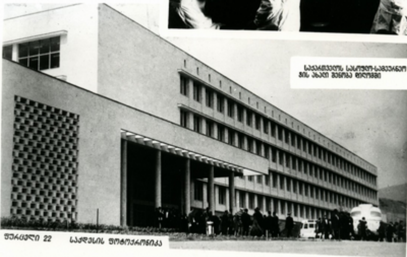
საქართველოს სასოფლო-სამეურნეო ინსტიტუ- ტის 6-ე სპეციალიზაციის ინჟინერი