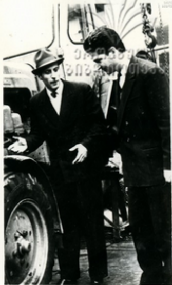
ՅԵՍՈՒՆԻՄԻՆ ԵՎ ՅՐԵՆՅԱՅՅՈՒՄԱ ՅԿՐՅՈՒՄ ՅՐՈՒՎՅՈՒՑՆԱՅՅՈՒՆ ՈՒՅԵՎ ՅԱՅՏԻՄՈՒ «ՅՅՎԱՅՆՈՒ» 20 ՅԿՐՅԱՆ ՆԱՅՅԱՆՆԵՆ ՅՅԿՐՅԱՅՅԱ ՆԱՅՅՅԿՐԱ