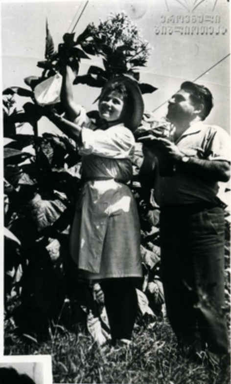
Գյուղատնտեսության լաբորատորիայի փորձարկումներ