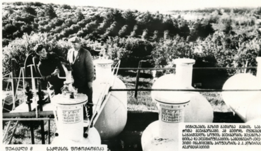
შეკრები 8 სავსე რეკონსტრუქცია

მთავარია წარმოების უწყვეტად დასაწყის სისხლად ახარებიც ინსტრუქციის კონსტრუქციის მიხედვით დასაწყისად. ეს სისხლად ყველა სავსე რეკონსტრუქცია შექმნილია კონსტრუქციის გეგმის მიხედვით.