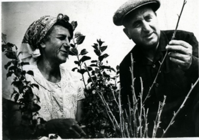
სკიდი ნაკვეთი ხეობის ყოველი და მე- ნიეობა მეთვალყურეობს ევს მეთვალყურეობს