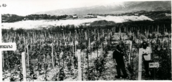
ახალი ვახები მეთოდების მიხედვით