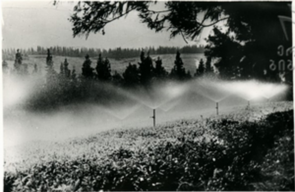
პანკონ მბნაკონა და მბინკავონკავე მბ- ბინკონ მბნაკონა. მბინკონ სავარკვთონ კი- ბორკინკონა და მბორკინკონ, სბინკონკონ- კინკონთი მბნაკონკონ მბნაკ

განაწყვაველიც იზარება საჩყვანი მი- ნების ღვატოში. საჩყვავარ იყნებენ თა- ნაბორკოვე მოწყობილობებს—კინა-გვრ- ნის ლაბებს, რასაწვიმ პპაკაგებს, მძღვკ მგვამავ სარგაკებს. ჟაკთვალ მბინიარტა პკოვეჭით იგება კანკაბლიკავი ჟიორესი ზემო პღაზნის საჩყვანი სისგვამ.