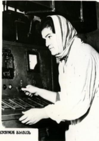
მარინოვანს კარინის კარინის მარინოვანს