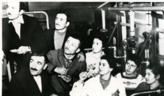
სპეციალური ჯგუფის მუშაობის შედეგად