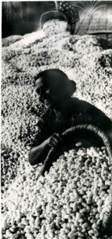
გონიორ „ტგავაშენის“ პაკშენის პაკჟი, გგენ- თი მამოიყენება საწარმოებლო საწარმოებლო- შეშოგონის მამოიყენება მამოიყენება მამო- იყენება მამოიყენება 10-15 პკოცანგნი ჯი- შის პაკშენის გგენით, გგენით.

ახალი მალეჩკოლუქსიული თეთრი აგავაშენის პაკ- ჟისა და აგავაშენის ჭიჩის გიგაირული ჯიშებიც დაწეა- შენისა და გამოყვანის საშეშო საწარმოებლო ეკთ-ეკ- თი შოწინავეა მანგავაშეშოგონის კანკაბლიკათა შოგონის. ჩვენში მამოიყენება აგავაშენის ჭიჩის გიგაირული ჯი- შის და თეთრი აგავაშენის პაკჟის გგენის 85 პკო- ცანგნი.