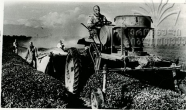
ჩანს სპეციალური მანქანების — შემწილი

მეჩინომეზი ხელით შრომა მანქანებზე შესვლას. ჩანს დასამუშავებელ შემწილია მანქანების კომპლექსი. მსოფ- ლიოში პირველი ჩანს სპეციალური მანქანის „საქართველოს“ შემწილათვის დაკრძალ შემწილათა და კონსტრუქტორათა ჯგუფს ვაკუ. შ. ი. კაკაბაძის ხელმძღვანელობით დაწინა- კი პირველი დასამუშავის წოდება მიანიჭა.