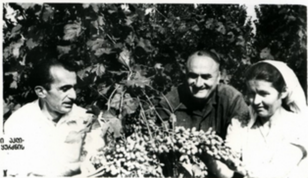
პაკთბოთის საბჭოთა მუარეოგაღი კუთ- მუარეაღი მუარეაღი სოზის ყვარენი ჯიბი., 33333667

ყვარლის უსოფით ჯიბიდან, კოშეღის ჩვენს ანკაბ- ღიკაში ხაკოზს. მისინიკაბა საბარევეღო ნაკოშინსა- თვის 50 საკკეთესო მუარჩიუნს. ზაკთოგის მნიშვნეღმუ- ნი ნანიღი მანკუთვნიღია ლვინისა და მუბკანუაღის ჯი- შეღისათვის. სოზის ყვარენი ბაკაბენის საბჭოთა მუარ- ნეოგებს მოყავთ.