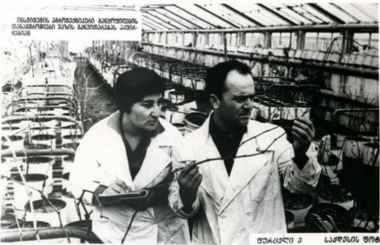
მეცნიერის კამპანიაში მებაღეობის მეთოდების დასაქმების კამპანიაში