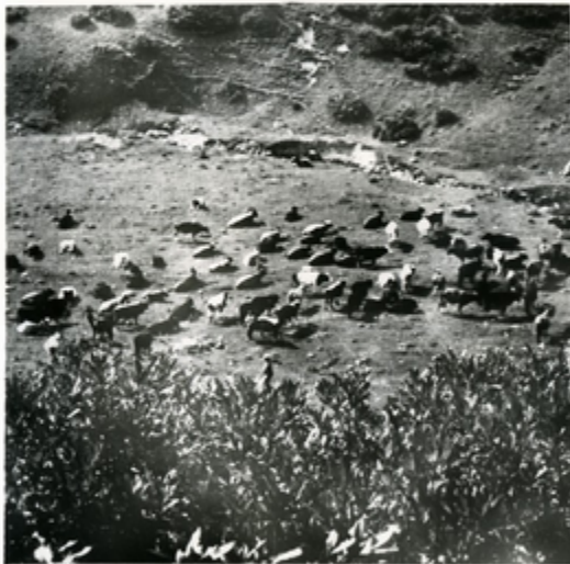
სპეციალური ჯგუფის მუშაობის შედეგად