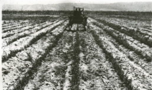
საქართველოს საბუნებისმეტყველო მეცნიერებათა აკადემიის საბუნებისმეტყველო მეცნიერებათა განყოფილება