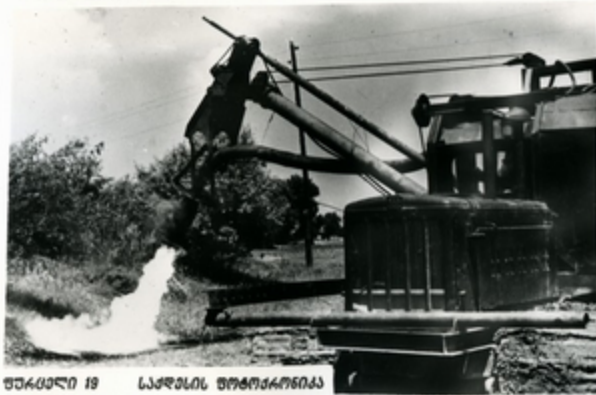
მბინკონი 18 სკრესის მომკარგონკი