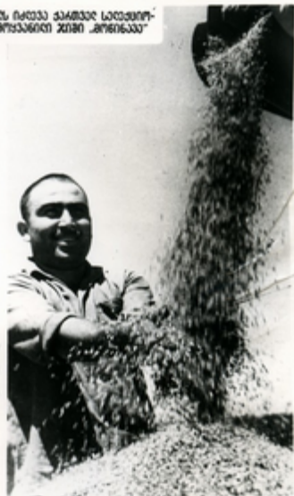
საგზის მონაპოვს იკვებენ ბავშვებს სოფლის მხარეებში მონაპოვს იკვებენ ბავშვებს

დატვირთი მესხიკაები ღირ მუშაობას აგაჩაგუნ თავთავი- ნი მარაგობაში კელეჩაგის ხაჩისის გაუგებრებაშია- ვის. თვითმად გენეტიკა-კლიმატიკა ზონისთვის კავშირ- დობაშია კონკრეტული ჯიშის.