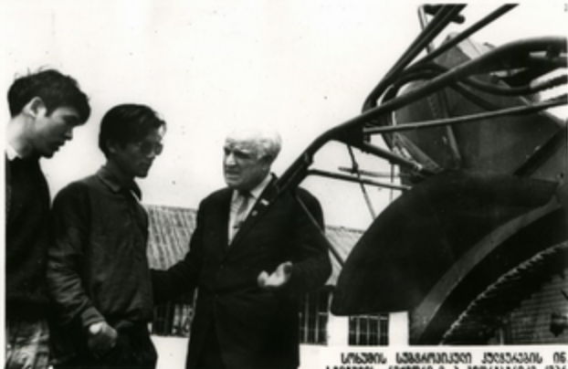
მონიტორინგის დასრულების შემდეგ

საბაგრაჟო კონტროლის ინსტიტუტის მე- შიფტის მუშაკი მონიტორინგის დასრულების შემდეგ მონიტორინგის დასრულების შემდეგ მონიტორინგის დასრულების შემდეგ