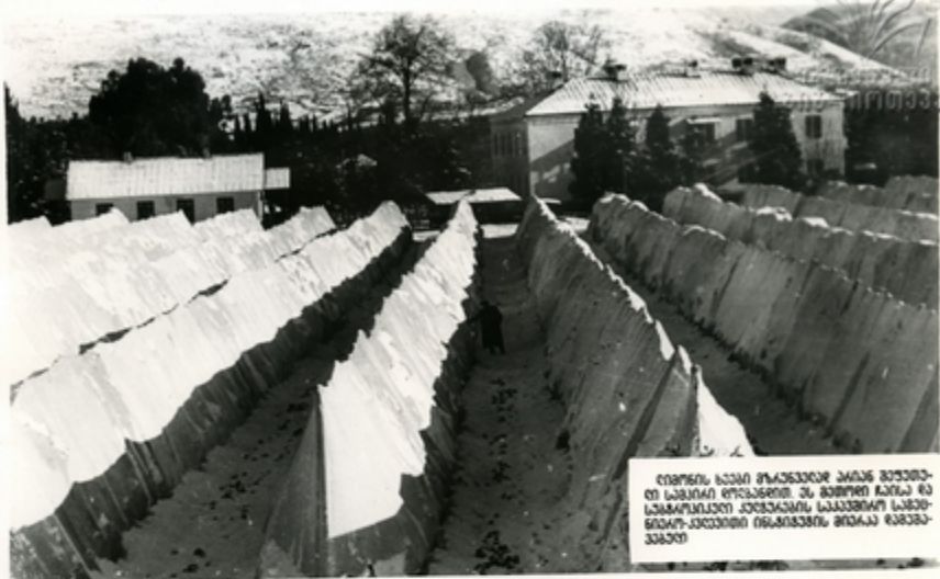
ღობრის სავსე მრავალპიჯი პიჯი შექმნილი საზღვარულ რეკონსტრუქციას და შემოქმედების და სავსე რეკონსტრუქციას, სავსე რეკონსტრუქციას და სავსე რეკონსტრუქციას

მთავარია წარმოების უწყვეტად დასაწყის სისხლად ახარებიც ინსტრუქციის კონსტრუქციის მიხედვით დასაწყისად. ეს სისხლად ყველა სავსე რეკონსტრუქცია შექმნილია კონსტრუქციის გეგმის მიხედვით.