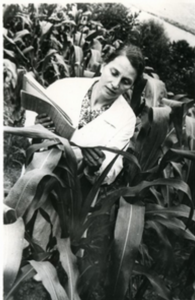
ՅԱԿՈՎ Ա. Ց. ԿԱՅԱՆՅՅՈՒՆ ԳՐԱ ԲԱՐՄԱՅԱՆՈՒՄ ԼՈՒՍՏԵՐՆ ԲԱՆՅԱՅՆԱԳՐՈՒՄԻ ՉՆՈՒ ԵՄԻՆՈՒՄ ԵՒՆ ԲՄԵՆՅԱՆՆԵՐ ԵՐԵՎԱՆԻ ՆԱԳՐՈՒՄ ԶԻ- ՅԱՆՈՒՄԻՆ

ԶԻՄՈՒՆ ԳՐԱՅԻՆՆԵՐ ՆԱԽԱՅԵՐԻՄ ՆԱԽԱՅԵՐԻ ԸՆԴՈՒՄՆԵՐԻՆ ԶԱԲԵՐՈՒ-ՅԻՄՈՒՄՆԵՐԻՆ ԵՐԵՎ ԼՈՒՍՏԵՐՆ ԵՆԱԳՐՈՒՄՆԵՐ ԶԻՅՈՒՄ ԶՈՒՄԵՎԱՆ ԶԻՅՈՒ- ՄԵ ԿՈՄՊՆԵՆ ՆԻՐՈՒՄԵՆ, ԵՐԵՎԱՆ