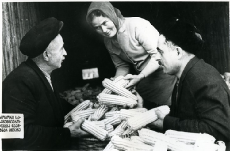
ԲԱՅՅԱԿԱՆՆԵՐ ՆԻՐՈՒՄԵՆ ԸՆՈՒՄԸՎԱ, ԸՆՈՒՄԸՎԱ ՆԱ- ՅԱԿՍՅԱՆՆԵՐ, ԶԻՆԱՄՈՒՄՆԱԳՐՈՒՄՆԵՐԻՆ, ՆԱԽԱՅԵՐԻՄ- ՅԻՄՈՒՄՆԵՐԻՆ ՈՒՍՏԵՐՆԵՐԻՆ, ԵՐԵՎԱՆԻ ԵՆԱԳՐՈՒՄԸՎԱՆ ԸՆՈՒ- ՄՆԵՐԻՆ, ԿՐՈՒՄԸ, ԿՐՈՒՄԸ ԵՐԵՎԱՆԻ 500 ՍՈՒՄԸՎԱ ԶԵՎԱՆԸ ԶՆՆԻՆ ԵՎ 25 ՍՈՒՄԸՎԱ ԶՆՆԱՆԸ: