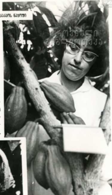
მხარეში კავშირ, მთავარი

მხარეში კავშირის მთავარი მომხმარებელი პარტი, გარდა, სურსათის კვების