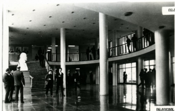
ინსტიტუტი, პლასტიკური ინჟინერინგი

საქართველოს შრომის წითელი დრო- შის ორგანიზაციის სასოფლო-სამეურ- ნეო ინსტიტუტის 6 უკუდგენი 8.000 სადავსი 14 სპეციალიზაცია ვეუდებ. სოფლის მეურნეობის მეცნიერებათა ემ კვანისთვის 50 კათარა დიე კვლე- მებირა და სამეცნიერო-კვლევით მე- შობებს ეწევა.