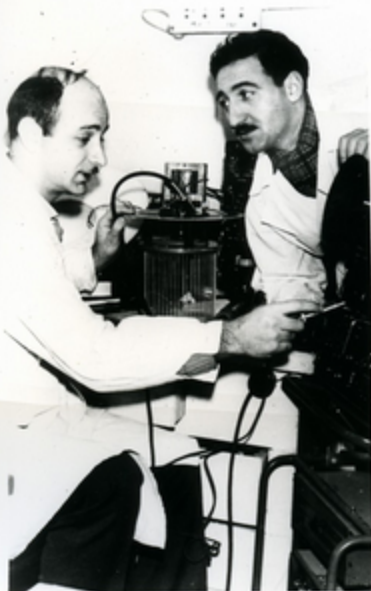
Քիմիայի ինժեներները օրգանական սինթեզի լաբորատորիայում