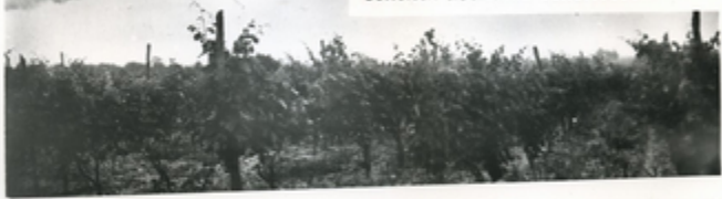
„სამეცნიერო კამპანიაში“—მეცნიერის და მებაღეობა

მეცნიერება—საქართველოს სოფლის მეურნეობის უმაღლესი დარგია. ვახის დაშავების მოქმედებები წესები, მართვის მეთოდები საშუალებად შექმნილმა მეცნიერმა მეთოდებმა შესძლებს. საქართველოს მებაღეობა-მევენახეობის და მელქინეობის სამეცნიერო-კვლევითი ინსტიტუტის კამპანიაში იხილეთ ინტერვიუ ნაგებია ნაგებია.