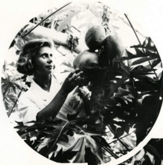
მხარე, ხე-კანკილე საბჭოთა კავშირის მშენიანებაში აკადემიის მთავარი მომხმარებელი პარტი, გარდა, სურსათის კვების