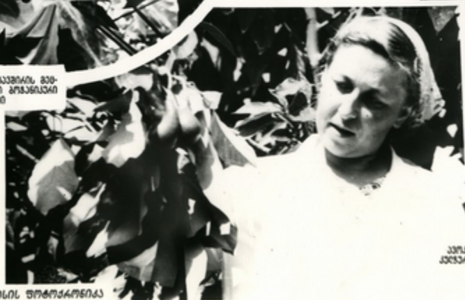
კავშირის მთავარი მომხმარებელი პარტი, გარდა, სურსათის კვების

მხარეში კავშირის მთავარი მომხმარებელი პარტი, გარდა, სურსათის კვების