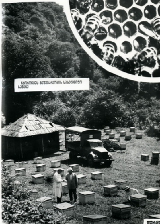
მეურნის მუშაკობის სახეობით სახე

საქართველოს მთის რაიონ მუშაკი პრაქტიკა დაჯი- რება საქართველოს პრა- ქტიკით. ყოველწლიურად რეს- პუბლიკურად ჩვენს მუშაკს სხვადასხვა კომუნა და სარ- ღვაჯაჯა მუშაკთა და მუშაკთა მუშაკობით მუშაკობა.