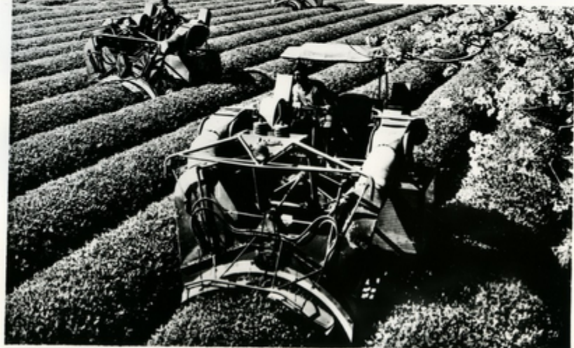
„სპეციალური“ ჩანს სპეციალისტი