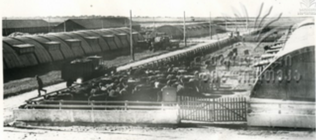
სამსოფლის სახეობა მეცურების სახეობა მეცურების სახეობის მსახურების კომპლექსი

მეცნიერ-მეცურველები საკატვამოს სოფლის მე- ურეობის მეცნიერებისა და ელემენტარული სემინარ- ისტრუქციული ინსტიტუტის კოლექტივთან ერთად შარ- მის უმსუბუქებზე მსახურდება, მენეჯერებს, მეცურებს კანკაზლიკაში მეცნიერად ამოგით კომპლექსურ-მეცნი- ერული უარმევი.