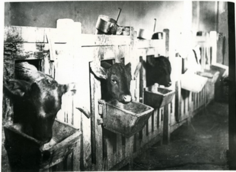
სამსოფლის სახეობის სახეობის კომპლექსი სამსოფლის სახეობის მსახურების კომპლექსი