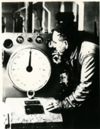
ՅԱՅՏԻՄԻՆ ՃԱՅՅՈՒՆ 1500 ՆԱԽԻՆ ՅԵՄԻՆ-ԻՆ ԶԱՎԱՑՈՒՆ ՈՒՐՈՇՈՒՄ «ՆԱՍՏՐՈՎՅԱՆՈՒՆ» ԿՈՆՍՏՐԱԿՏԻ ՅԱՅՏԻՄՆԱՆ ԼԱՅՈՒՆՏԵՐԻՆ

ՅՎԵՆԻՅԱ ՆԱՏՆԱՅԻՆՆԵՆ ՅԱՔԱՆՈՒՄԱ. ՅԵՃԵՈՒՐ-ՅՈՒՆՆԱՐՈՒՄԱ. ՅՎՅԵՆԱՅԵՄԱ. ՅԵՃԱԼՈՒՄԱ. ՅԵՍԻՑԿԱՆԱՄԱ. ՅՅԱՄՆՅԵՄՈՒՆ ԵՎ ՅԵՍԽՈՎՅԵՆԱՄԱ ՅԿՐՅԱՆ. ՆԱՅԵՍՈՒԿՐԱՎ-ՅՅԵՆՅՈՒՄ ՈՆՏՅՈՒՑՅԱՅՈՒՆ ԵՎ ՆԱՍՏՐՈՎ-ՆԱՅԵՅԿՆԵՄ ՅՎԵՆԻՍԻՆ ՅՈՒԿՐՈՒՄԱ ՅՐՈՒՎՅՈՒՑՆԱՅՅԱ ՅՎՅԵՆՆԵՆ ՅՈՒՆԻՐ ԿՈՅՈՒ ՅՎԵՆԱՆՈՒ, ԿՐՅԵՐՅՅԱՅ ՅԵՍՏՆԱՐՆԵՆ ԵՆԻՐՈՒ ՅԿՐՅԱ ՅՈՆԵՐՅԱՅՆԱ ԵՎ ՅՅԿՅԵՅՈՒՆ.