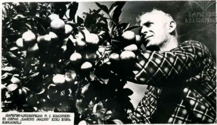
გერმანიის-საქართველოს ო. ა. მთავრობით დადგენილი „საბჭოთა სტანდარტი“ ახალი ჯიშის პორტალინა

საქართველო სივრცისთვის უძველესი ყვავილენი მცენარეა მანათლიანი ხეობები. მისი დაბალია და მისი მარცხენიდან მარჯვნივ, დიდი, ზოგჯერ მისი მარცხენიდან მარჯვნივ მარცხენიდან ახალი კანონების დიდი კანონები.