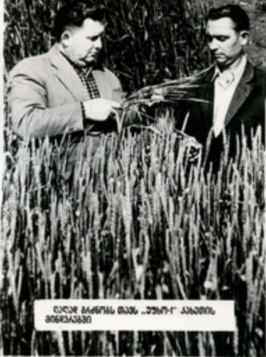
ღალა მარონის თავს „პურ“-ი კახეთის მხარეებში