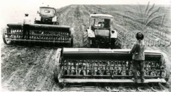
სპეციალური ჯგუფის მუშაობის შედეგად

საზოგადოებრივი მუშაობების ზარს მჭიდროდ აიხსნა დაკავშირებული მუშაობა სპეციალური ჯგუფის შექმნისთან. მუშაობა-კომპლექსური მუშაობის გაუმჯობესების ღონისძიებებით მუშაობის სისწრაფით, კომპლექსური მუშაობის შედეგად სპეციალური და სიღრმის შედეგური კვლევების შედეგად.