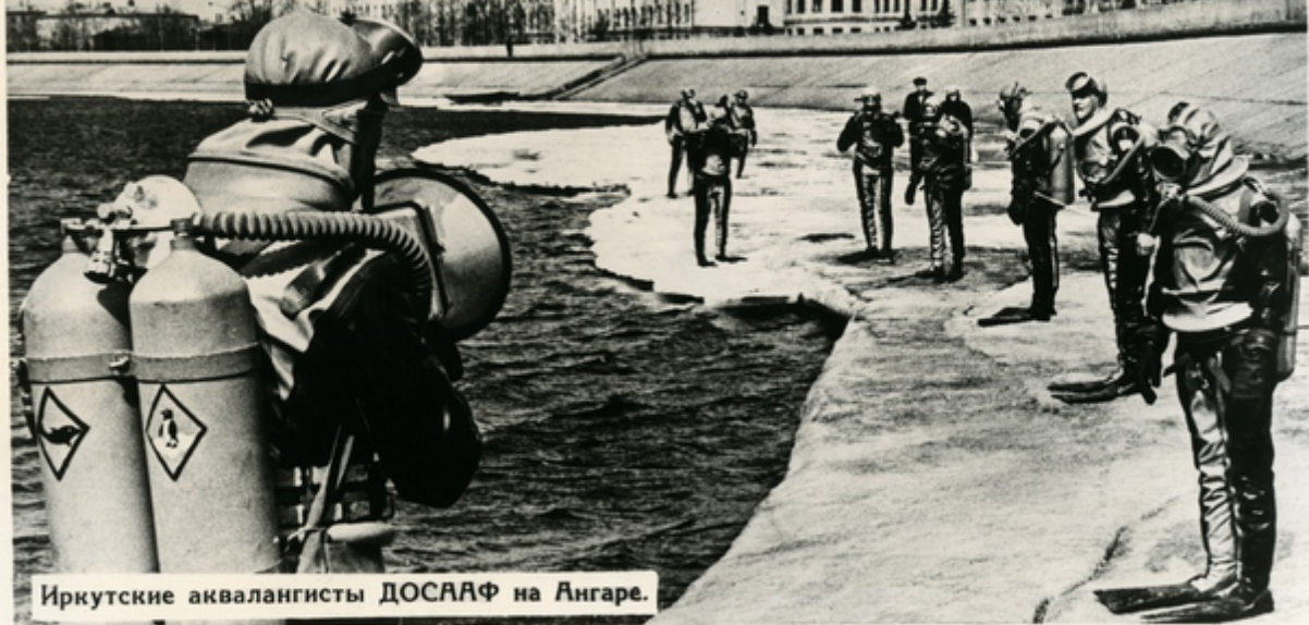
Иркутские аквалангисты ДОСААФ на Ангаре.

Военно - Морской Флот привлекает юношей суровой романтикой моря. Наиболее мужественные из них при подготовке к морской службе занимаются подводным спортом.