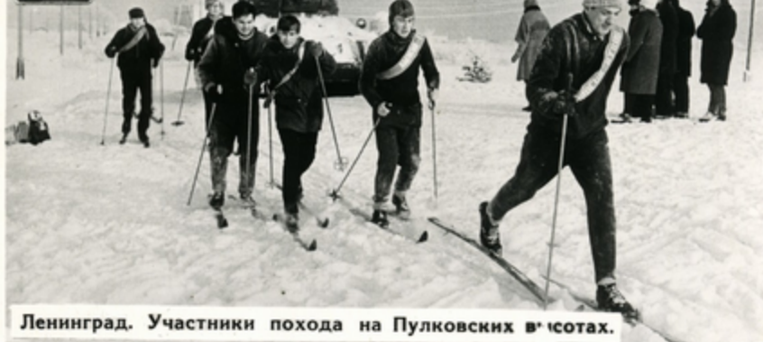
Ленинград. Участники похода на Пулковских высотах.