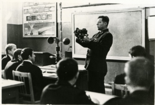
Занятия по метеорологии.

За успехи в воспитании молодежи школа юных космонавтов имени Ю. Гагарина при Оренбургском высшем авиационном училище летчиков награждена Красным Знаменем ЦК ВЛКСМ.