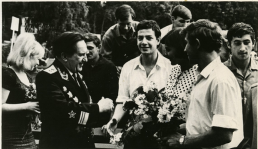
Призывников напутствует ветеран.

На решение этих задач направлена деятельность школ, военкоматов, предприятий, организаций ДОСААФ и спортивных обществ.