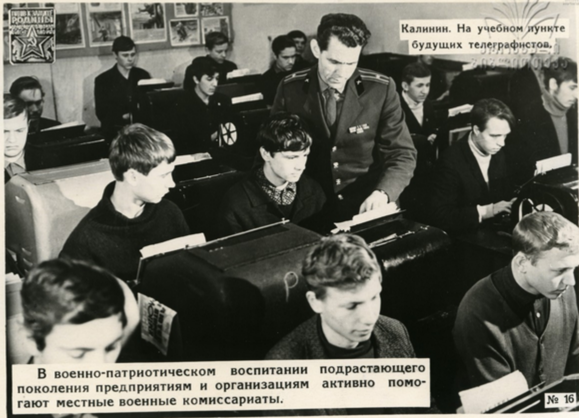
Калинин. На учебном пункте будущих телеграфистов.

В военно-патриотическом воспитании подрастающего поколения предприятиям и организациям активно помогают местные военные комиссариаты.