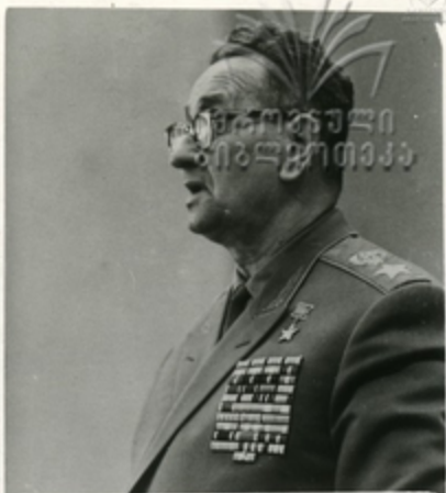
С докладом о новом законе выступает министр обороны СССР Маршал Советского Союза депутат А. А. Гречко.

В современных условиях новый Закон о всеобщей воинской обязанности полностью отвечает интересам советского народа и является новым свидетельством заботы нашей партии, ее Центрального Комитета о претворении в жизнь ленинских заветов о защите социалистического Отечества.