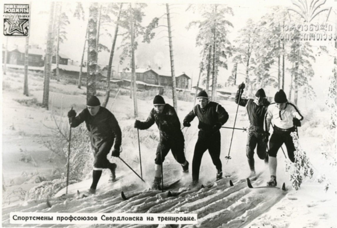
Спортсмены профсоюзов Свердловска на тренировке.

Большинство юношей любят лыжный спорт. Умение хорошо владеть лыжами—ценное качество будущих воинов.