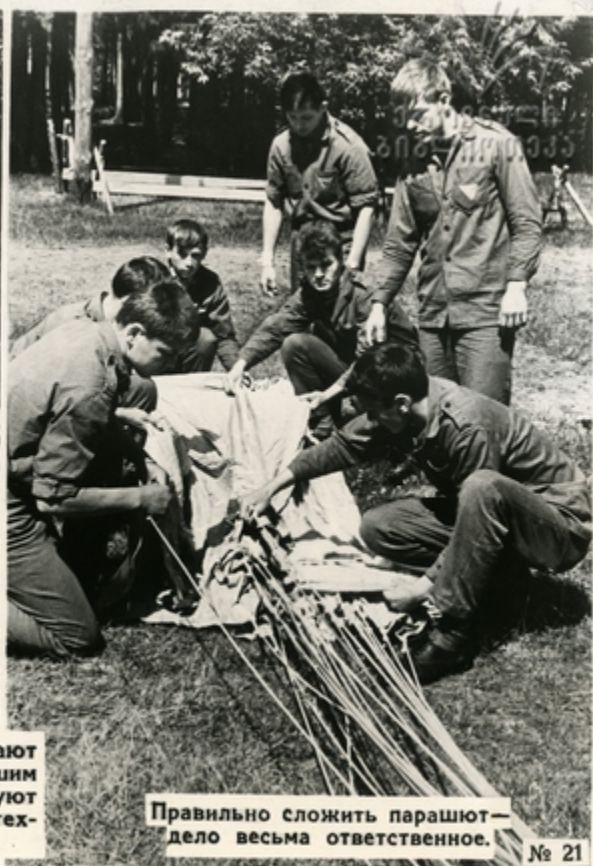
Правильно сложить парашют—дело весьма ответственное.

Многие будущие защитники Родины выезжают в военно-спортивные лагеря, где изучают с большим интересом оружие и боевую технику, участвуют в военных играх, сдают нормативы спортивно-технического комплекса.