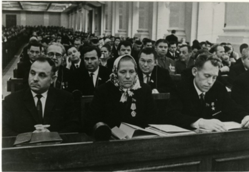
Москва. Третья сессия Верховного Совета седьмого созыва. В зале заседаний.

В современных условиях новый Закон о всеобщей воинской обязанности полностью отвечает интересам советского народа и является новым свидетельством заботы нашей партии, ее Центрального Комитета о претворении в жизнь ленинских заветов о защите социалистического Отечества.