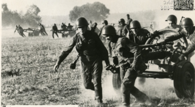
Идут тактические учения.