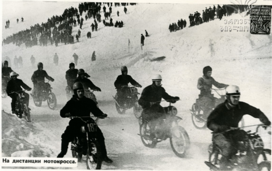
На дистанции мотокросса.

Большую работу по развитию военно-технических видов спорта проводят организации ДОСААФ СССР.