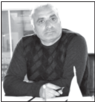
ბატონო თედო ახალი რეგისტრაციის მისთვის მისთვის უფასოდ დაკანონდება?

ქალბატონი გავრცელებული შემთხვევაა, რომ ადამიანები, მათი წინაპრები მინას ფლობდნენ, სარგებლობენ, ზოგს სახლი აქვს აშენებული, ზოგი სასოფლო-სამეურნეო დანიშნულებით იყენებს, მაგრამ არავითარი საკუთრების უფლება ამ მინის ნაკვეთზე არ აქვთ. ძირითადად ორი შემთხვევა იკვეთება, - ან რეგისტრირებული არ არის ოფიციალურად ან საერთოდ არ არსებობს რაიმე საბუთი ან დიკუმენტი არსებული მინის შესახებ. ოდესღაც თვითნებურად დასახლდა წინაპარი, გავიდა წლები, მაგრამ არავითარი დოკუმენტი მინის ნაკვეთზე არ აქვს. ეს ძალიან ხშირი შემთხვევაა. ასეთი ადამიანებისთვის კარგი ინფორმაციაა სწორედ ის, რომ დაინციო მინის სიტემური რეგისტრაცია, რაც გულისხმობს შემდეგ: საჯარო რეესტრის წარმომადგენლები განერილი განრიგის მიხედვით ჩაგვინადგინებენ, აღრიცხავენ მინებს, საკადასტრო ნახაზებს აიღებენ, დოკუმენტაციას გამოითხოვენ.