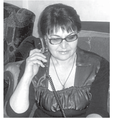
დე საქართველოში დაახლოებით 300 საქორწინო ხელშეკრულება დაიდო, რომელთა აბსოლუტური უმრავლესობაც საქართველოს მოქალაქესა და უცხოეთის მოქალაქეს შორის გაფორმდა.

„საერთო გაზეთის“ მკითხველთა შეკითხვებს პასუხობს გაზეთის იურიდიული კონსულტანტი, ადვოკატი მთივარისა კვიციანივილი. ტელ.: 593 78-64-69