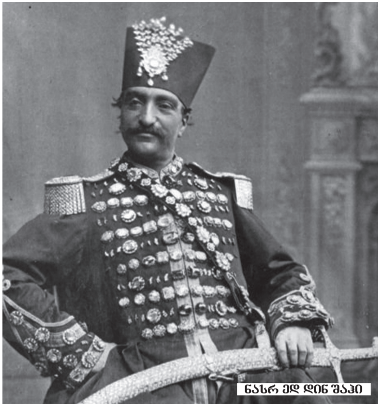
ნასრ ედ დინ შაჰი