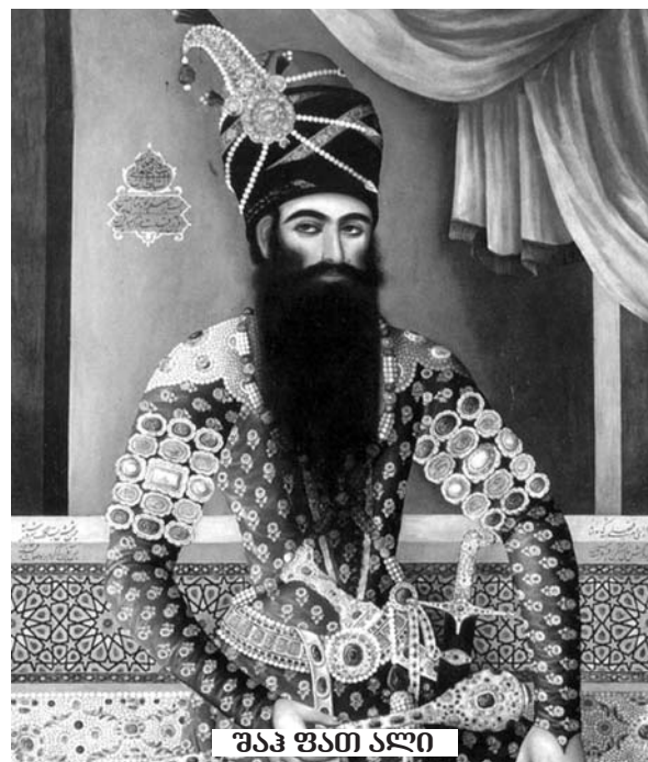
შაჰ ფათი ალი

ამ ხელშეკრულების თანახმად, რუსეთის იმპერიის საზღვარი მდინარე არაქსზე გაივლო. დამარცხებულ ირანს კი კასპიის ზღვაზე სამხედრო ზომალდების ყოლა აეკრძალა. რუსებმა საკუთარ თავს ნება დართეს სპარსეთის ტერიტორიაზე საკონსულოები გაეხსნათ, სადაც მოისურვებდნენ და რამდენსაც მოისურვებდნენ და ამ საკონსულოებს ექსტერიტორიალობის სტატუსი მიანიჭეს. რუს ვაჭრებს სპარსეთში უბაჟოდ ვაჭრობის უფლება მისცეს. სპარსელ ვაჭრებს კი რუსეთში ანალოგიური ვაჭრობის უფლება არ ჰქონდათ. რუსეთის იმპერატორმა საკუთარ თავს უფლება მიანიჭა, სპარსეთის შაჰი ირანის ტახტზე დაემტკიცებინა, ან არ დაემტკიცებინა. დაბოლოს, სპარსელებს, რომელთაც ომი არ დაუწყიათ, რუსებმა 20 მლნ. რუბლის, იმ დროს უზარმაზრი თანხის, კონტრიბუციის გადახდა დააკისრეს.