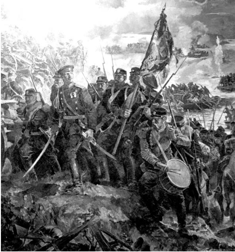
(გაბრძენა, დასაწყისი იხ. „სბ“ N22)