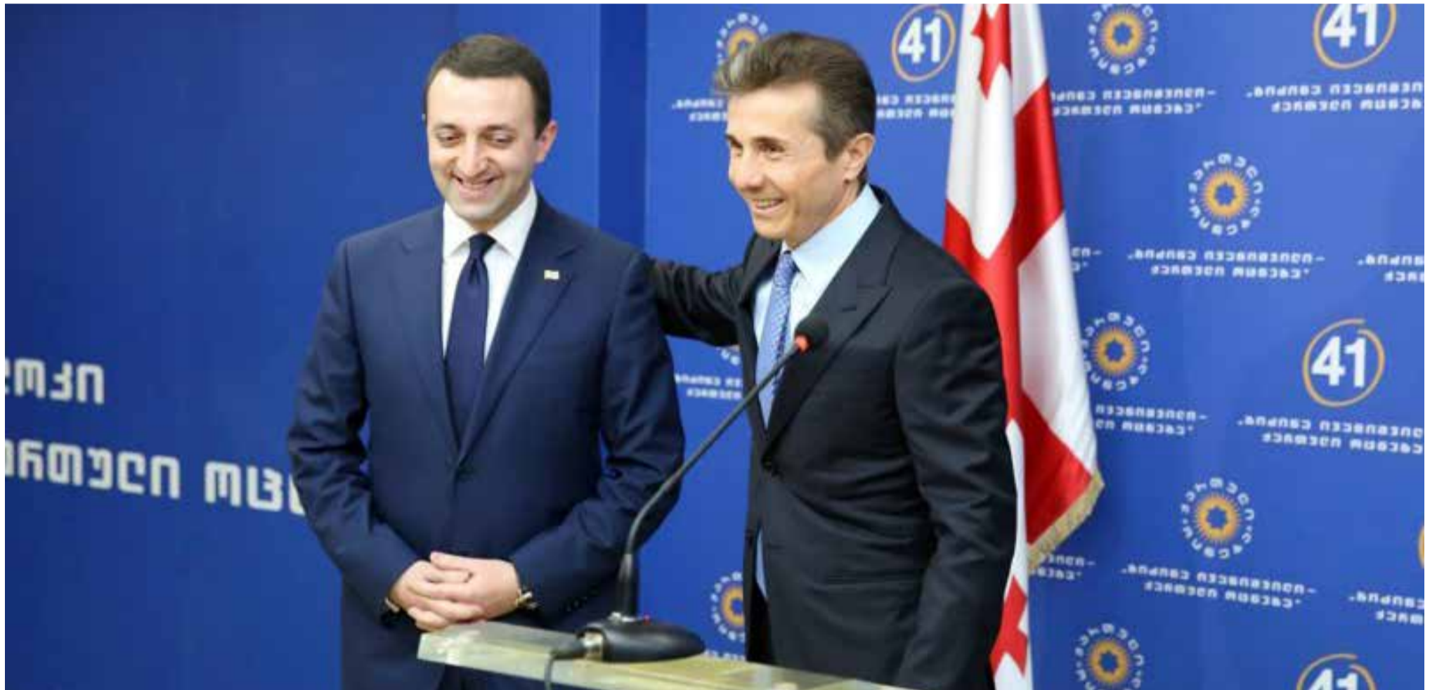
„გვიყვარს ქვეყანა და საბედისწერო ომისთვის არ გვემეტება“ – პრემიერის პასუხი ოპოზიციას