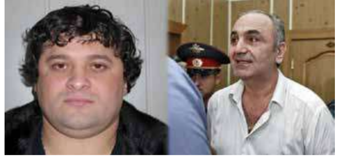
თნიანისა და ლავას ოლღის ომი გრძელდება – ქურდული სამყარო დიდი გარჩევის მოლოდინშია

ვინ და რატომ სცემა ქართველ „კანონიერ ქურდს“ სტამბულში