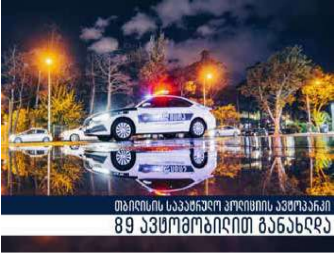
თბილისის საპატრულო პოლიციის ავტოპარკი 89 ავტომობილით განახლდა

საპოლიციო ინფრასტრუქტურის განახლების მიზანია, პოლიციელთა საქმიანობის ეფექტიანობის ამაღლება და მათი სამუშაო პირობების გაუმჯობესება. სამინისტრო მომავალშიც გააგრძელებს საპოლიციო ინფრასტრუქტურისა და აღჭურვილობის განახლება-გაუმჯობესების პროექტებს.