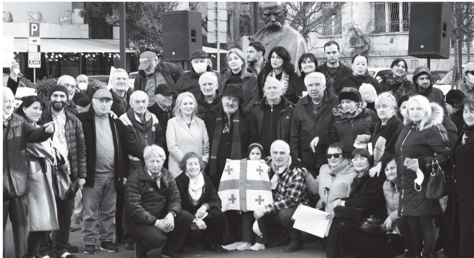
ქართველი მხარეები ტარას შვირინოს ქაზლთან

მებრძოლი, ბავშვი, ქალი, მოხუცი... ზუსტი ციფრი არავინ იცის. თავად რუსებსაც დიდი ზარალი მოსდით. აი, მე გაგაცნობთ 25 მარტის მონაცემებს, რაც უკრაინის გენშტაბმა გამოაქვეყნა: დახოცილია 16 400 რუსი ჯარისკაცი, მოკლულია 7 გენერალი, აფეთქებულია 575 ტანკი და 1 640 ჯავშანმანქანა, ჩამოგდებულია 117 თვითმფრინავი, 127 ვერტმფრენი, განადგურებულია 1 131 ავტომანქანა, დააზიანეს ან ჩაძირეს 7 ხომალდი და ა. შ.