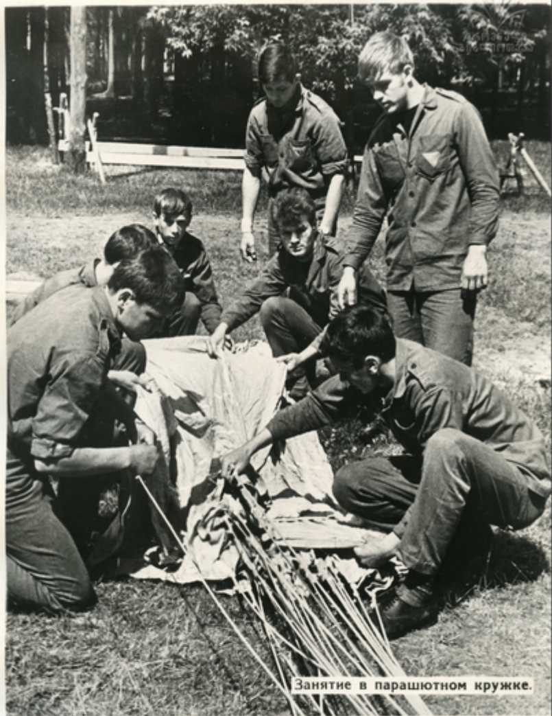
Занятие в парашютном кружке.

Будущих летчиков, парашютистов, механиков, радистов, водителей и многих других специалистов готовят для службы в армии и на флоте учебные организации, кружки и курсы ДОСААФ. № 4