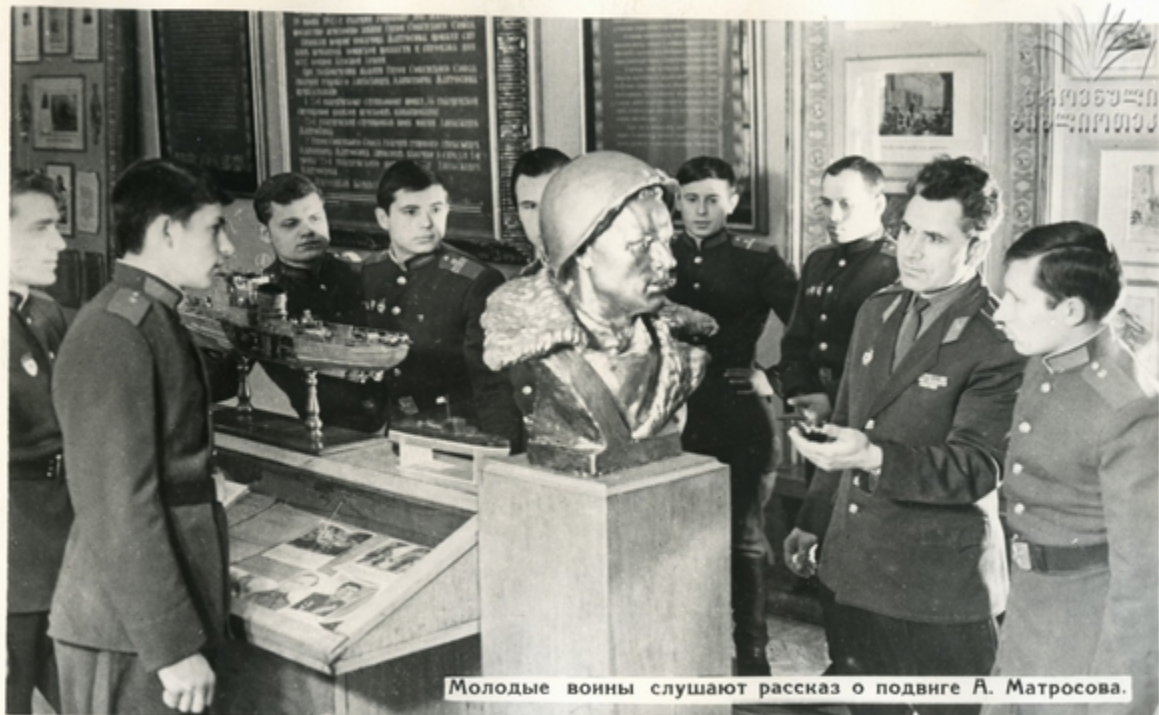
Молодые воины слушают рассказ о подвиге А. Матросова.

В комнате боевой славы части собраны реликвии, рассказывающие о бессмертных подвигах воинов. Сюда приходят юноши нового пополнения, отсюда начинается их армейский путь. Такова добрая традиция посвящения в солдаты.