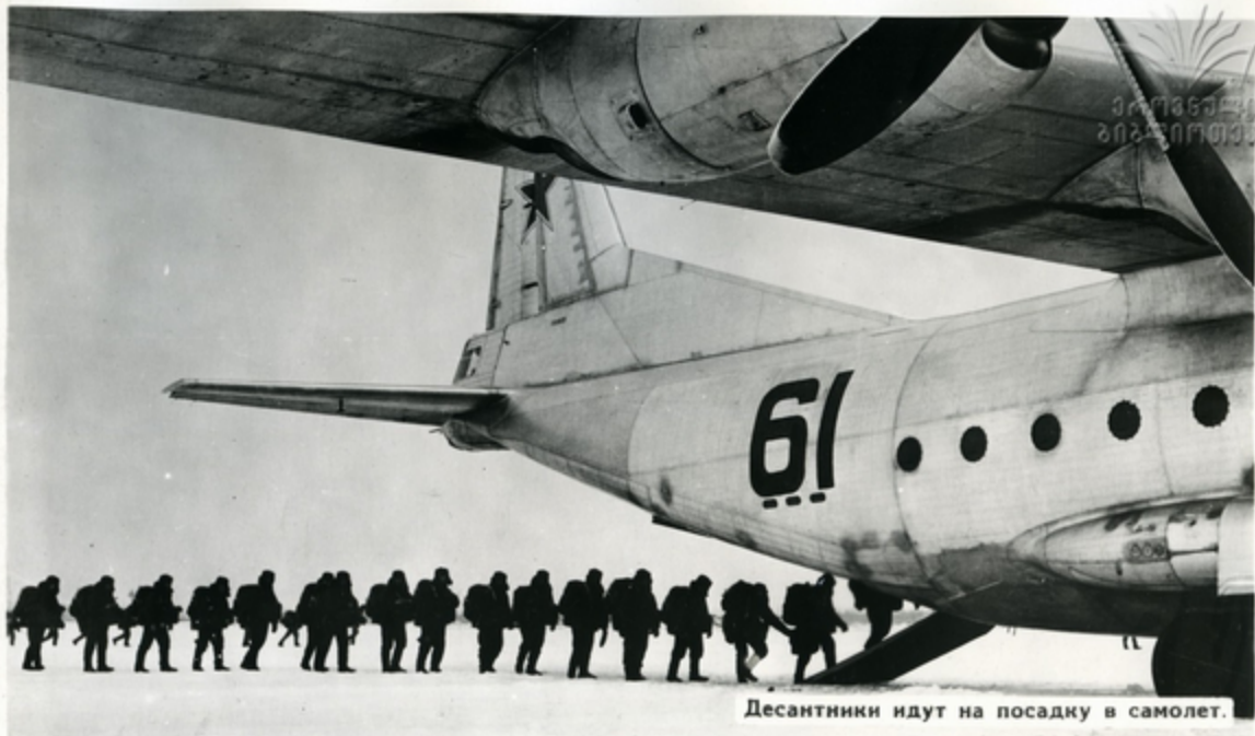
Десантники идут на посадку в самолет.

Новый Закон СССР о всеобщей воинской обязанности повышает ответственность каждого военнослужащего за защиту Родины. Молодые воины стремятся стать отличниками учебы уже на первом году службы.