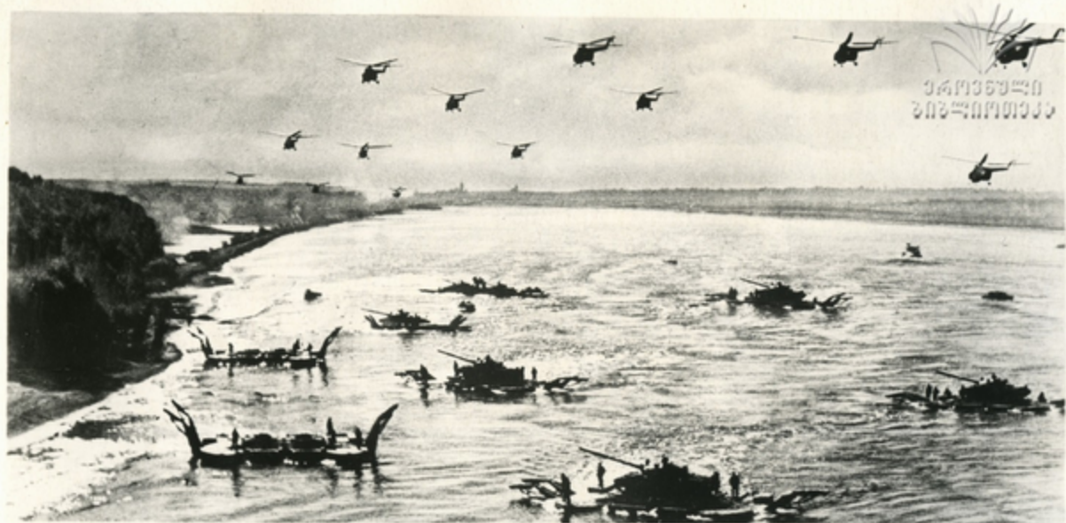
Форсирование водной преграды.

Постоянная боевая готовность войск — главная забота командиров, политорганов, партийных и комсомольских организаций армии и флота.