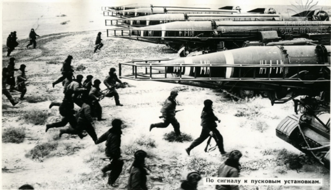
По сигналу к пусковым установкам.

По новому Закону о всеобщей воинской обязанности срок службы в армии стал короче, а знания, которыми необходимо овладеть воину в связи с непрерывным развитием боевой техники, требуют большого напряженного труда. У солдата есть неписаное правило: служба—два года, боеготовность—всегда!