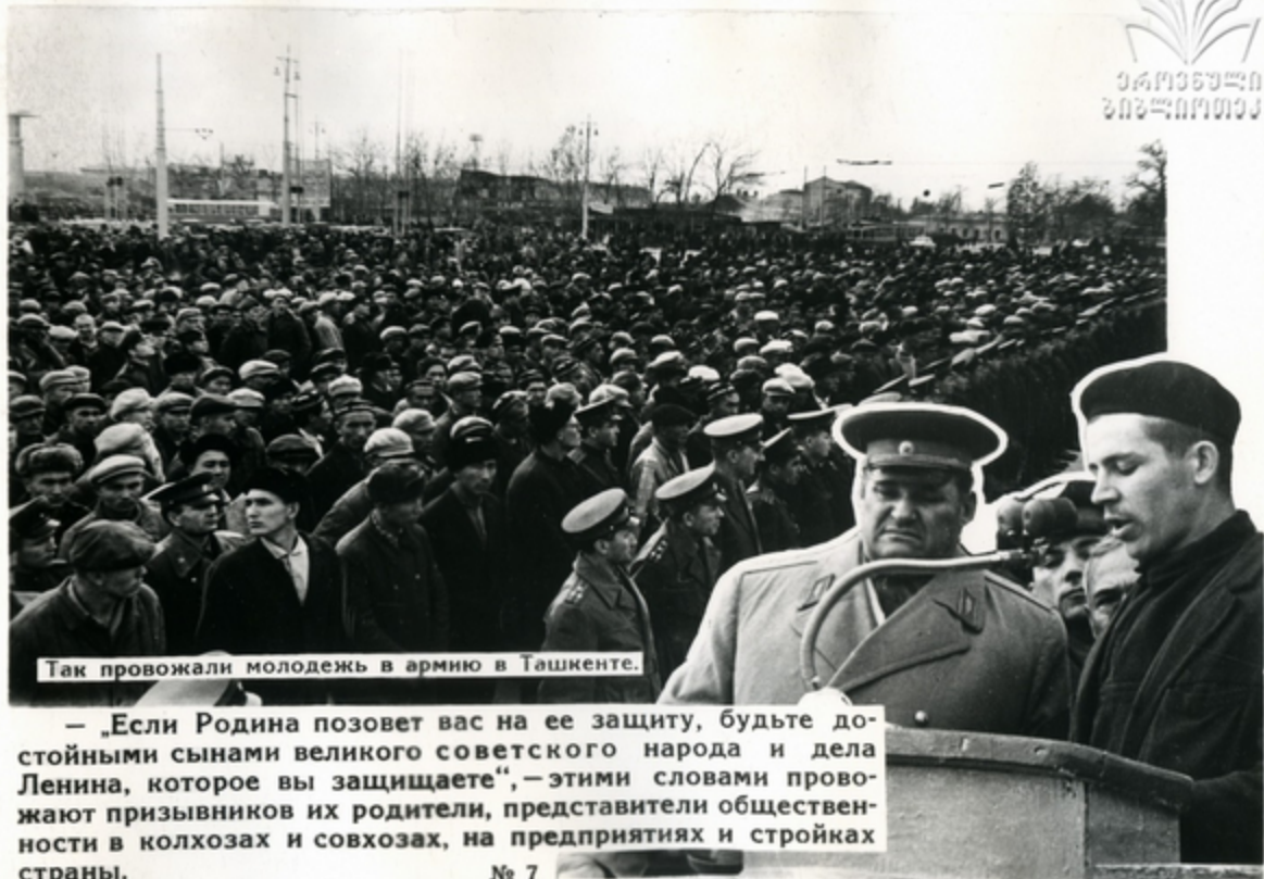
Так провожали молодежь в армию в Ташкенте.

— «Если Родина позовет вас на ее защиту, будьте достойными сынами великого советского народа и дела Ленина, которое вы защищаете», — этими словами провожают призывников их родители, представители общественности в колхозах и совхозах, на предприятиях и стройках страны.