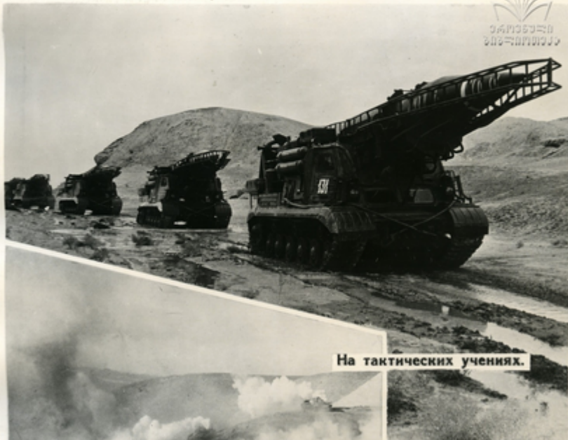
На тактических учениях.