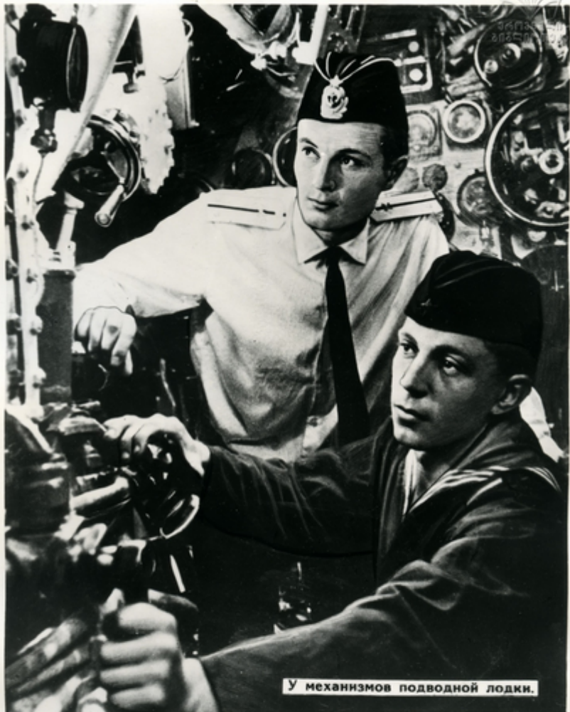
У механизмов подводной лодки.

Товарищеская забота, доброжелательная взыскательность, терпеливая помощь старослужащих окружают молодых воннов с первых дней службы. „Ветераны“ передают новичкам свой опыт, контролируют и направляют их первые самостоятельные действия.