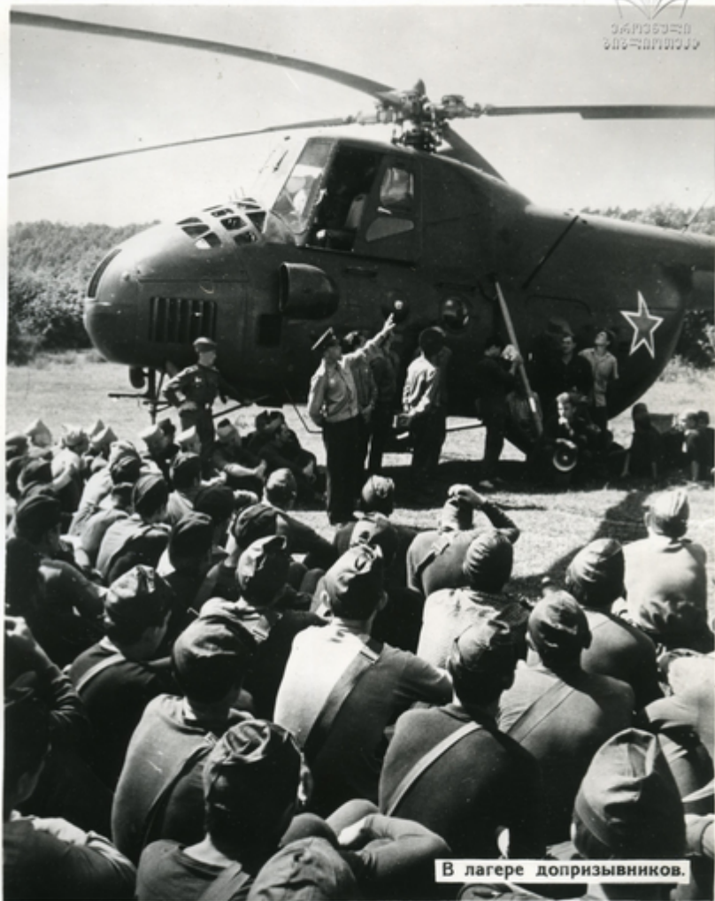
В лагере допризывников.

Новый Закон СССР о всеобщей воинской обязанности предусматривает начальную военную подготовку учащихся старших классов средних школ, ее улучшение со студентами вузов и техникумов и всей допризывной молодежью.