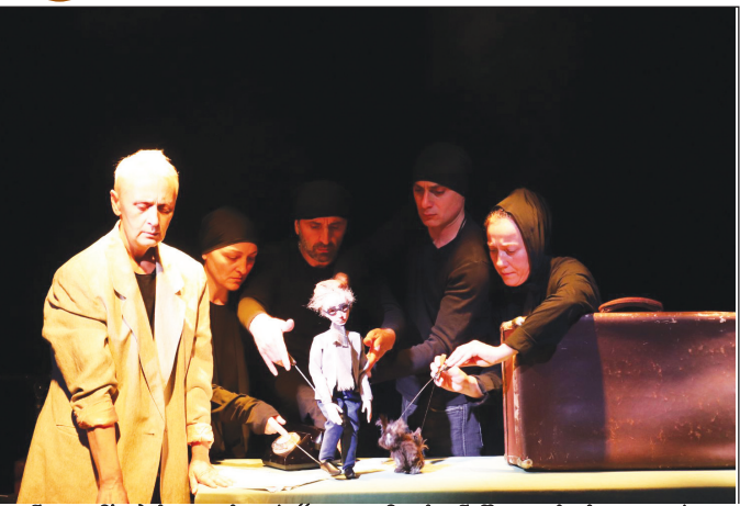
ნ. ღუმბაძის „ცისკარი“ ელ. მაცხონაშვილის საავტორო სპექტაკლი

სპექტაკლი მეორე მსოფლიო ომის ლიტუველი მსწავლებლის ციშირში გადასახლების თემას ეხება. სპექტაკლი მსურველს აძლევს დასკვნების გაკეთების საშუალებას: „რას აკეთებ, როცა ხე ვესვებს არ იღებს“