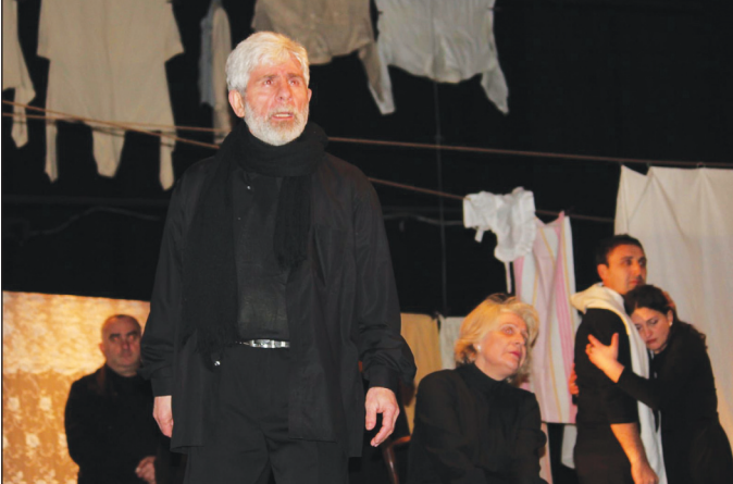
ზესტაფონის სახელმწიფო თეატრი ნ. ღუმბაძე „ნუ გაადვილებ“ რეჟ. ელ. მაცხონაშვილი