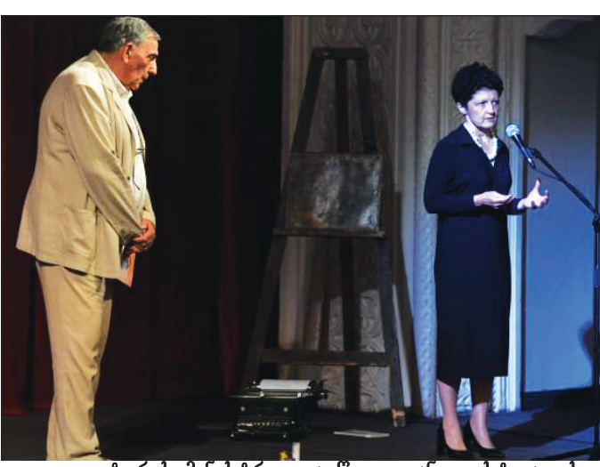
კულტურის მინისტრი თეა წულუკიანი ფესტივალის გახსნაზე