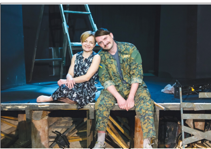
ლვოვის აკადემიური დრამატული თეატრი „ცხოვრება p.s.“