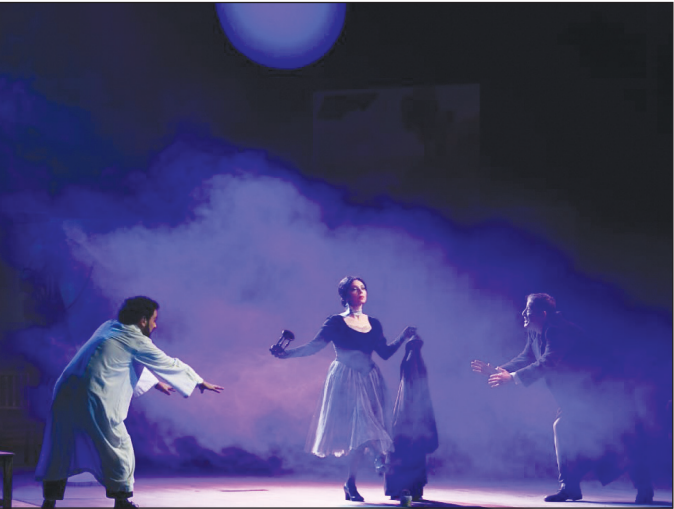
რ. სტურუას საავტორო სპექტაკლი „ვანო და ნიკო“