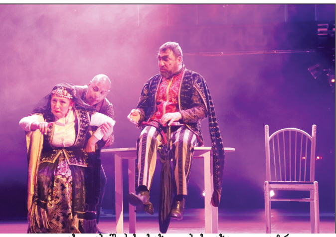
ვასო აბაშიძის სახელობის ახალი თეატრი გ. ერისთავის „ვაყრა“ რეჟ. დ. დოიაშვილი