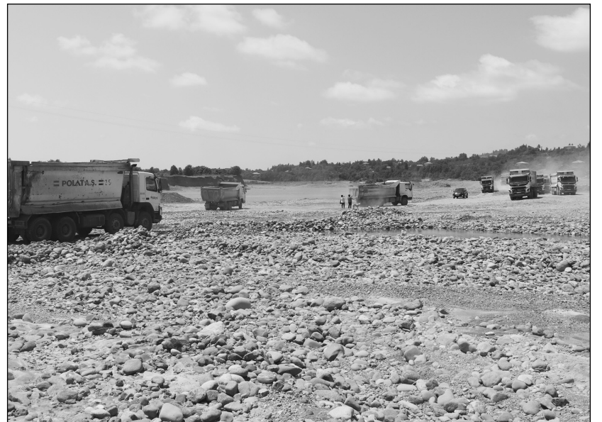
კომპანია POLAT YOL & MAPA უწყვეტ რეჟიმში მუშაობს

წლებია ვწერთ კომპანია „აქვას“ შესახებ, რომელმაც თავისი ლიცენზია კომპანია „ნალუთუს“ გადასცა, რომელიც მდინარე ნატანების ხეობაში კიდევ უფრო ზღვისკენ, სოფელ მერიისა და ლაი-