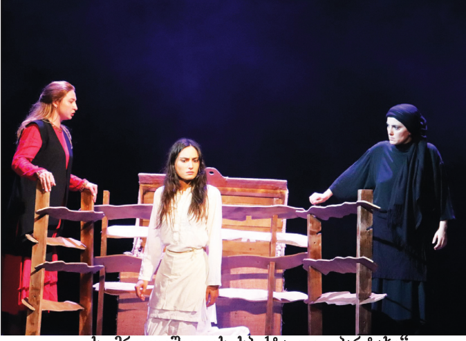
ს. მრეველიშვილის სპექტაკლი „პარტახი“