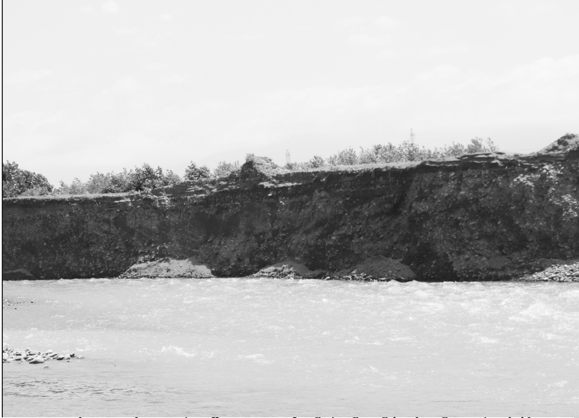
ასე უტევს კალაპოტშეცვლილი მდინარე ნატანები საყურე ფართობებს