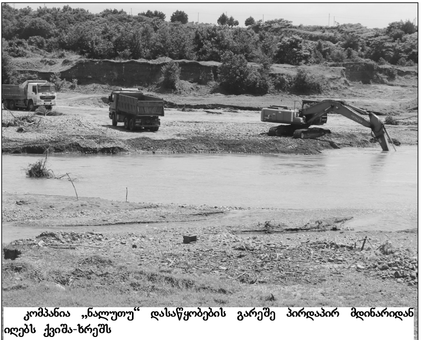
კომპანია „ნალუთუ“ დასაწყობების გარეშე პირდაპირ მდინარიდან იღებს ქვიშა-ხრემს

ცვლილება – „მითითებულ დიაგნოზით ინფრატული მას-ალის მოპოვება ნებადართულია იმ შემთხვევაში, თუ მოპოვება წარმოებს ჭარბი აკუმულაციის უზენაიდან შავი ზღვის ნაპირების (კლავების) ადგილის მიხედვით. მოპოვება დასაშვებია აგრეთვე