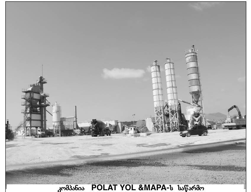
კომპანია POLAT YOL & MAPA-ს საწარმო

ამ მთავარ ვერ შევძელით გადაგვიმოწმებინა საზოგადოებაში არსებული ინფორმაცია იმის შესახებ, რომ მდინარე ნატანების ხეობაში მოპოვებული ინერტული მასალის მნიშვნელოვანი ნაწილი ჩქაროსნული მაგისტრალის მშენებლობის გარდა, მშობა-ბაშ რეგიონში მიმდინარე სხვა მშენებლობებსაც ხმარდება და ამავე შესაბამისი სამსახურები არ რეაგირებენ