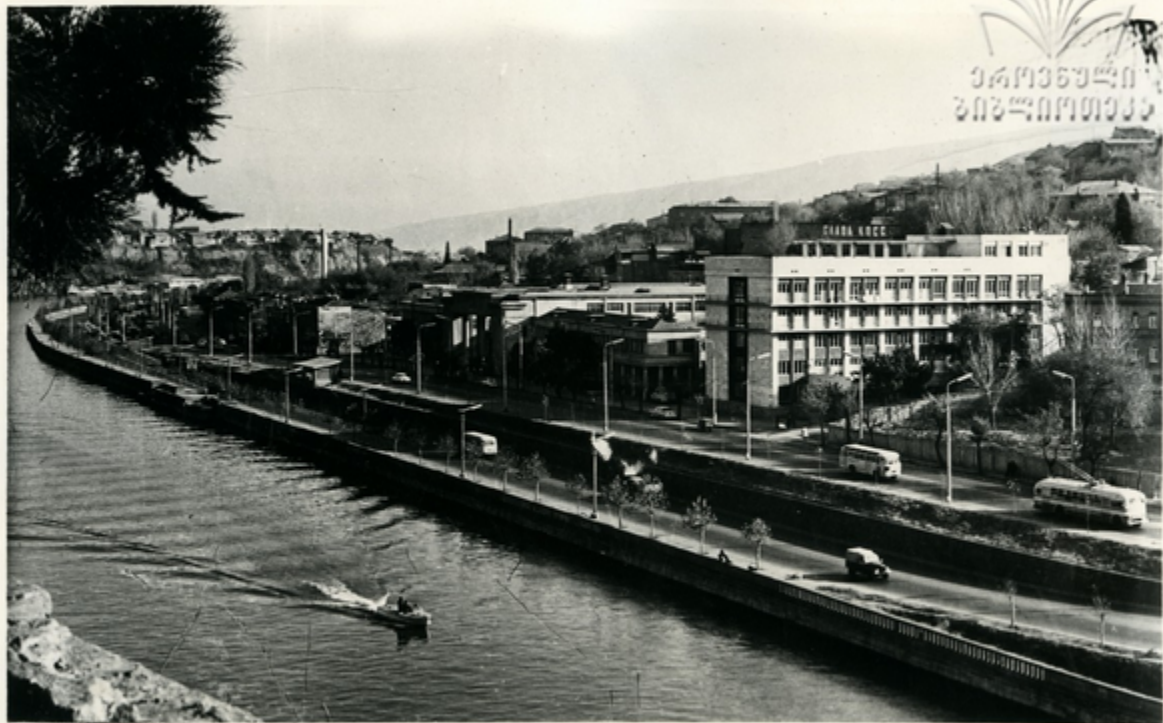
ბალნეოლოგიური კურორტის ხედი