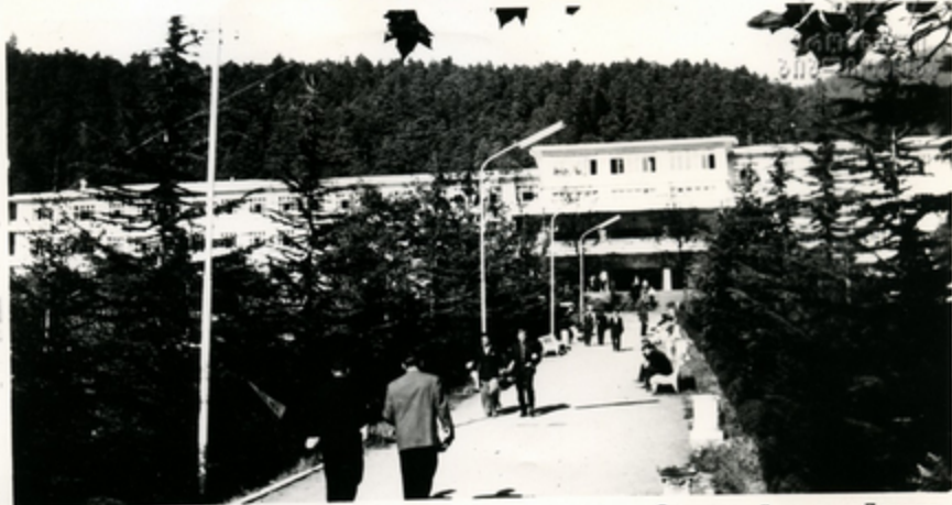
ღვინის სახელობის სასამონიკო