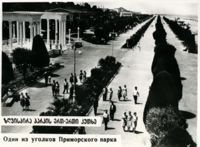
Один из уголков Приморского парка