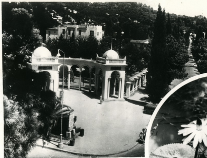
კოლონადა გომბენიკაი ბაღის შესასვლელთან Коллонада у входа в Ботанический сад