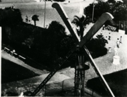
გზისა და პიონერთა პარკის ხედი Вид на озеро и пионерский парк