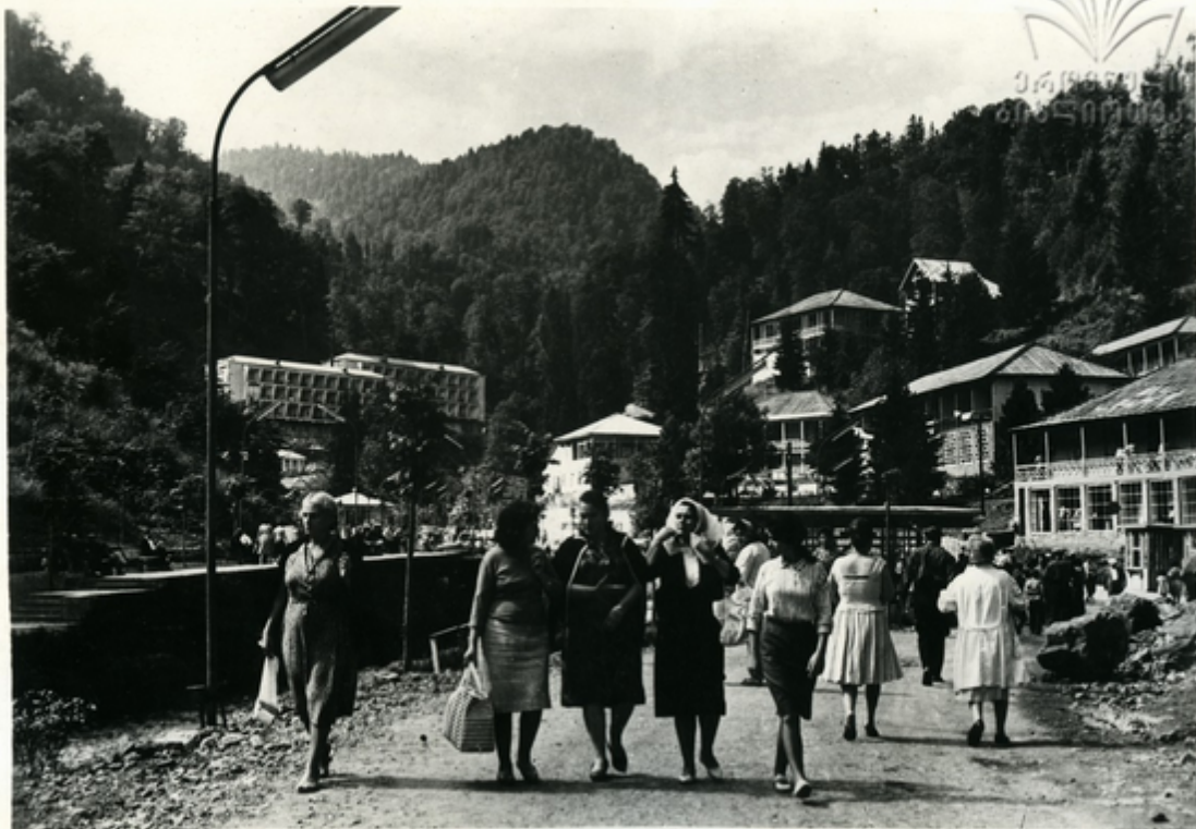
კურორტის ერთ-ერთი კუთხე