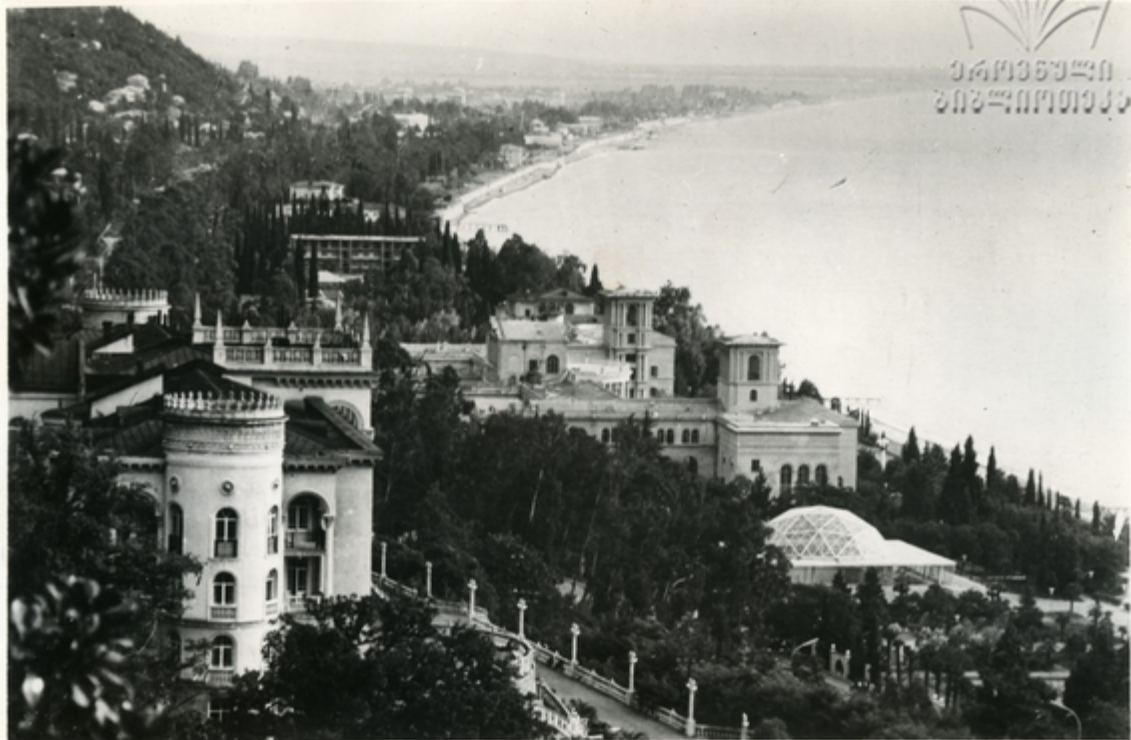
კურორტის საერთო ხედი